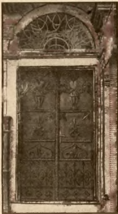
Wejście do domu przy ul. Krakowskiej 34.