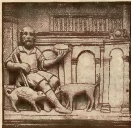
Plaskorzeźba nad furką Szpitala Św. Łazarza.