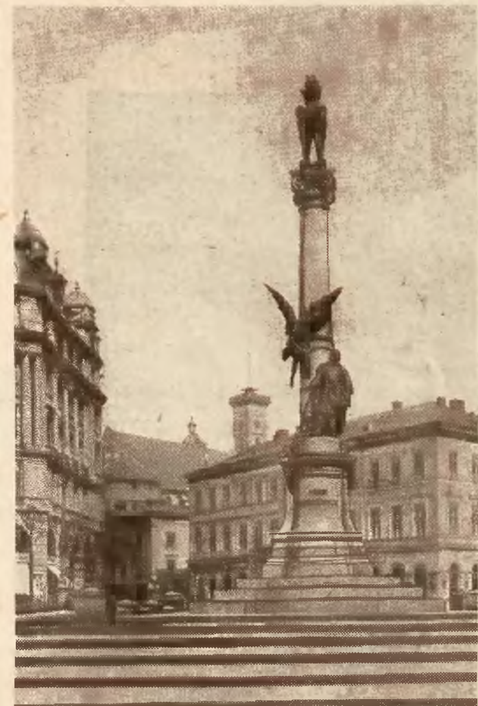
Pomnik A. Mickiewicza na Placu Marjackim=centrum dzisiejszego Lwowa.