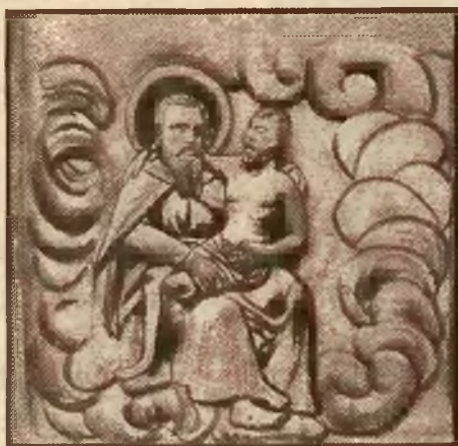
Plaskorzeźba na murze Szpitala Św. Łazarza.