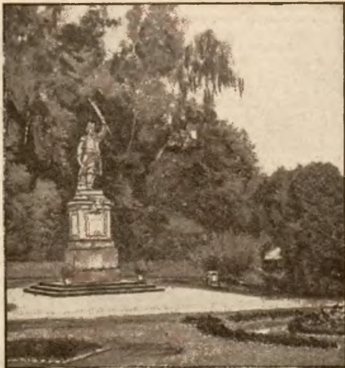
Pomnik Jana Kilińskiego w Parku Stryjskim, dzięki swemu położeniu górzystemu jest jednym z piękniejszych ogrodów publicznych Europy.

Ciężkie chwile przeżył też Lwów w czasie wielkiej wojny, zwłaszcza po jej ukończeniu, gdy rozpadająca się Austrija pozostawiła w spadku rozognioną sztucznie waśń z Rusinami, co wywołało straszne, bratobójcze walki w r. 1918, podczas których, w ciągu