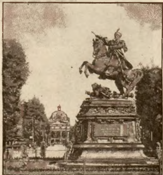
Pomnik, konny Jana III Sobieskiego na Włachach Hetmańskich, pod którymi płynie zasklepieniem korytem rzeczka Peltew.

kilkumiesięcznego oblężenia, Lwów ociekał krwią młodych bohaterów i łzami osieroconych matek oraz świecił żywymi ranami swych murów. Jednak aureolą glorii zwycięstwa uwieńczony, wrócił szczęśliwie na odrodzonej „Ojczyzny łono“, by dalej dla niej pracować, a przez stworzenie „Targów Wschodnich“ przywrócić dawne chwile świetności handlowej.