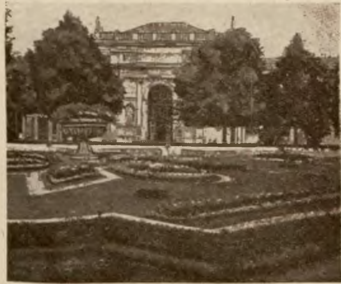
Teatr Miejski, zbudowany w r. 1900, a zwrócony frontem do Wałów Hetmańskich, ozdobiony jest zewnątrz i wewnątrz szeregiem rzeźb, płaskorzeźb i fresków.