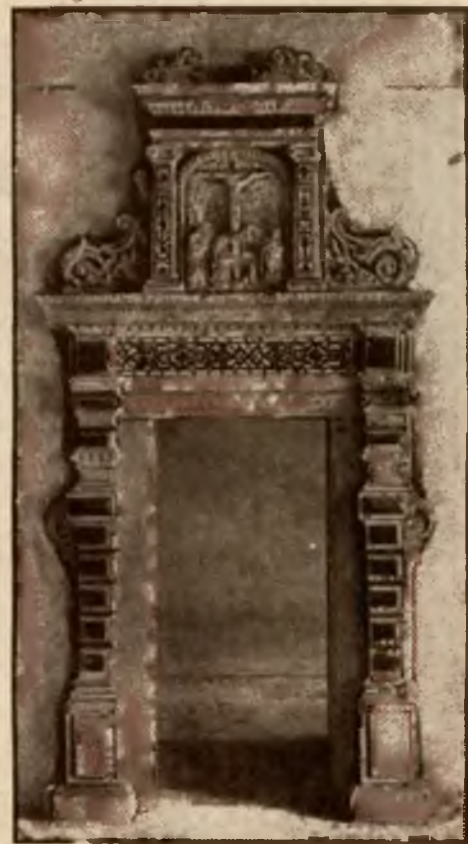
Portal wewnętrzny »Szarej Kamienicy« na Rynku.