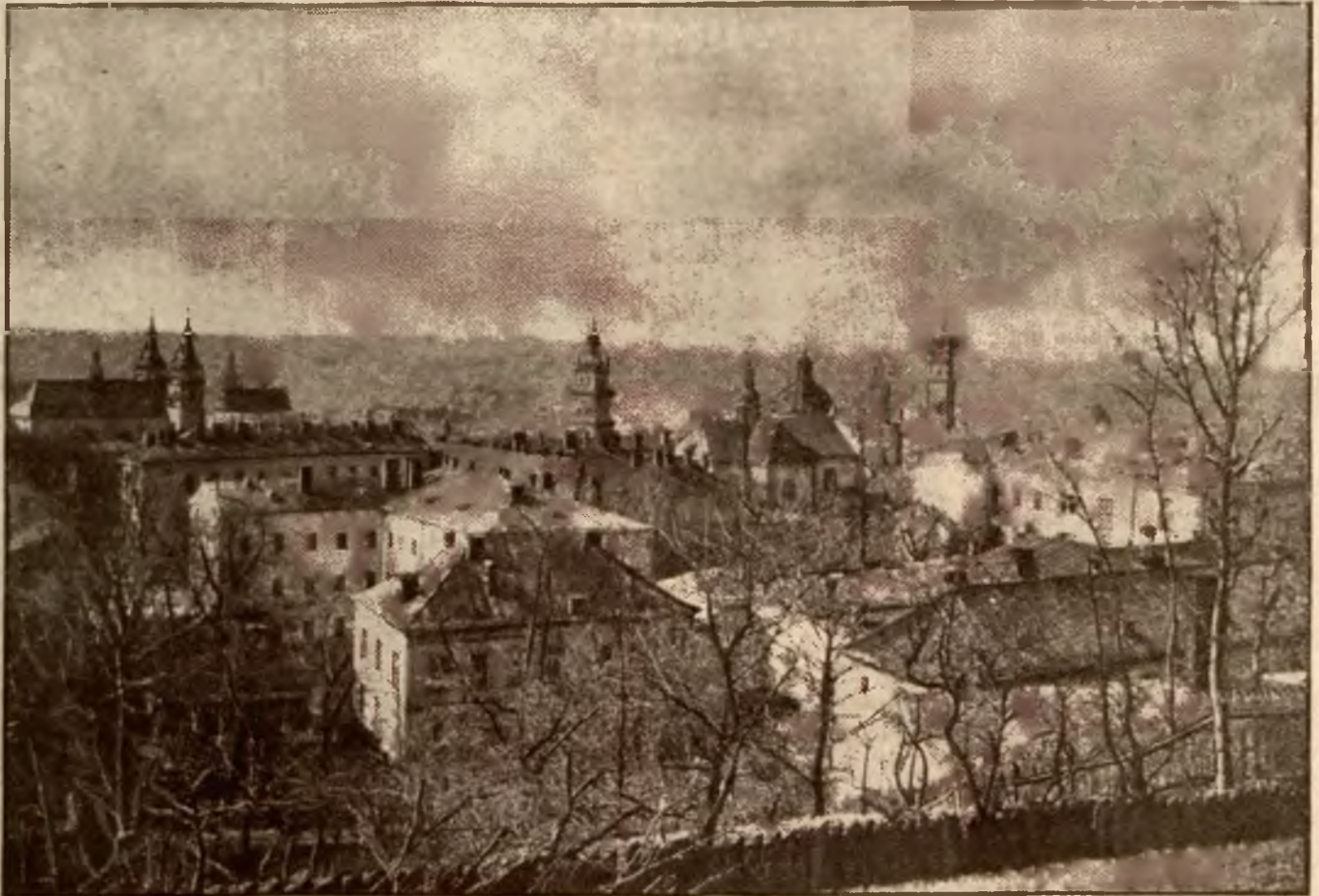
Ogólny widok Lwowa.

Misję tę spełniał Lwów do dni naszych zaszczytnie, a herb jego — potężny lew w koronie — stał się najprawdziwszym symbolem przyszłej bohaterskiej roli, jaką wielokrotnie odegrał w dziejach Rzeczypospolitej naszej, ten „Semper fidelis“ („Zawsze wierny„)