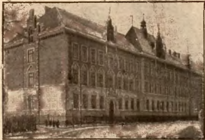
Szkoła Powszechna im. H. Sienkiewicza we Lwowie skąd rozpoczęła się w r. 1918. obrona przed Ukraińcami.

jące się uniwersytety: krakowski i wileński i wszystkie szkoły od najwyższych do najniższych, założyła seminarja nauczycielskie, — wszędzie wprowadzając język polski, jako wykładowy. Powołane do życia „Towarzystwo Ksiąg Elementarnych” miało za obo-