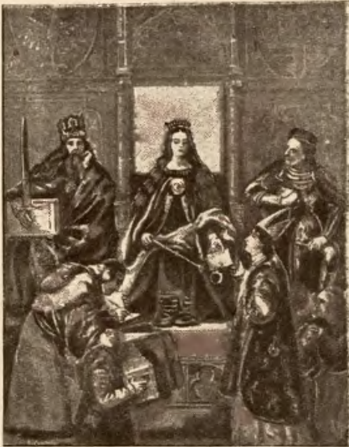
Fundatorowie Uniwersytetu Jagiellońskiego: Kazimierz Wielki—Królowa Jadwiga -- Władysław Jagiello. Mal. J. Matejko

nawet sobie wyobrazić jak prymitywnie odbywało się to nauczanie. Młodzież siedziała w lecie na gołej ziemi, a w zimie na wiązkach słomy. Uczniowie nie mieli ani książek, ani zeszytów, uczyli się zaś z łacińskiego, ręcznie pisanego psalterza, którego jedyny, bardzo cenny egzemplarz posiadał nauczyciel: biskup, ksiądz, lub zwykły zakonnik, nieznający często mowy polskiej i nieraz sam równocześnie się jej uczący. Poza tem pobierała młodzież wiadomości z rachunków, a nadewszystko ćwiczyła się w śpiewaniu pieśni kościelnych.