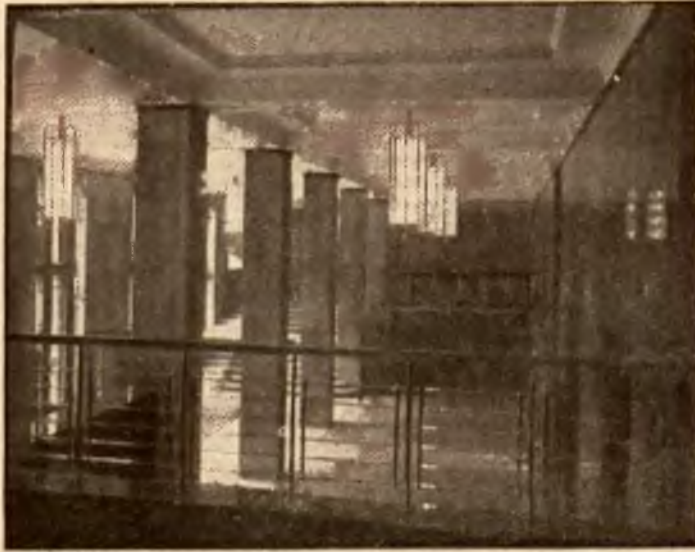
Wspaniały holl w gmachu M. W. R. i O. P.