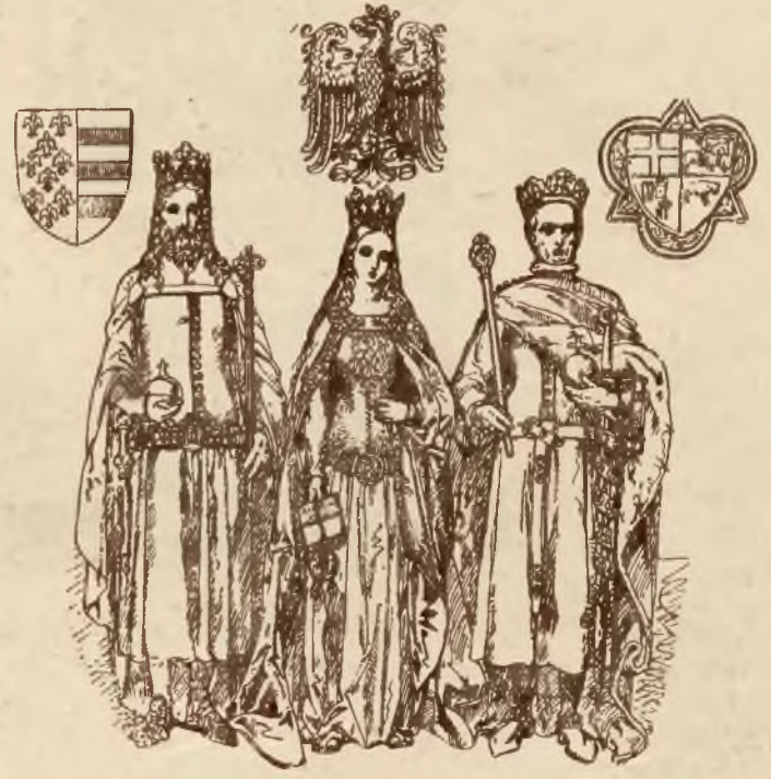
Kazimierz, W. — Jadwiga — Jagiello. J. Matejko — „Ubiory w Polsce”.

Małżeństwo Jadwigi z Jagiełłą i złączenie Polski z pogańską Litwą, którą trzeba było dopiero nawracać, wywołało potrzebę posiadania wielu kapłanów i urzędników, dla umocnienia wiary i zaprowadzenia porządków na rozległych, zjednoczonych ziemiach. Dla swej misji apostołskiej Jadwiga uzyskała w Rzymie