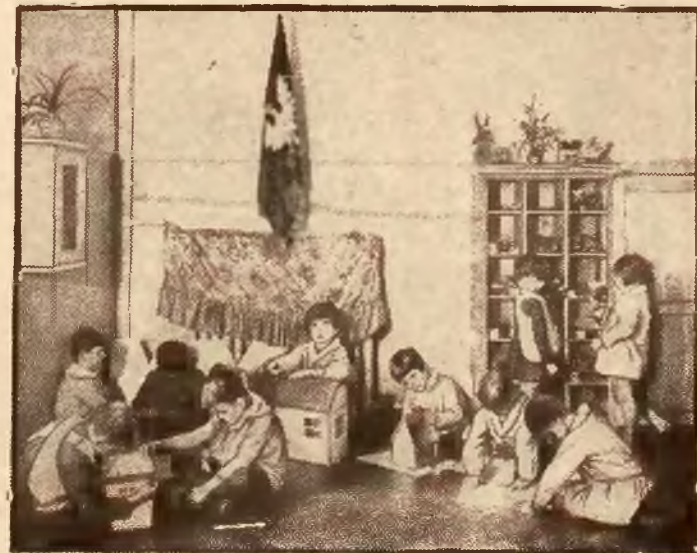
Zabawa dzieci w przedszkolu.

Wzmagające się wpływy rosyjskie w kraju otworzyły oczy wszystkim, zdrowiej myślącym, zachęcając do oporu. Gdy papież Klemens XIV zniósł w roku 1773 zakon Jezuitów, uchwałą sejmową fundusze i dobra jezuickie przeznaczono na cele wychowania narodowego, powołując do życia „Komisję Edukacyjną”, która była pierwszym na całym świecie ministerstwem oświaty. Zreformowała ona oba rozpada-