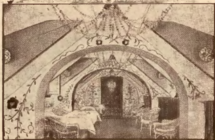
Świetlica w Szkole Budownictwa w Warszawie.

i zakłada sam w Warszawie pierwszą szkołę świecką t. z. „Szkołę Rycerską“, rodzaj Korpusu Kadetów, gdzie kształcił się też T. Kościuszko. Tam synowie niezamożnej szlachty na koszt państwa ćwiczyli się w sztuce wojennej i mustrze, studjowali fortyfikację i strategię.