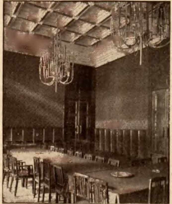
Sala konferencyjna w M. W. R. i O. P.

Odrodzona Polska specjalną zwróciła uwagę na jaknajwyższe podniesienie oświaty w kraju, a konstytucja zagwarantowała specjalne prawa całego