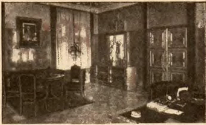
Gabinet ministra W. R. i O. P.