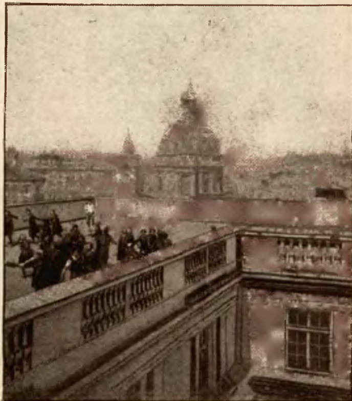
Taras dla zala w nadachu gmachu gimnazjum im. Królowej Jadwigi. — W oddali widać kopulę kościoła św. Aleksandra.

Polska, jako państwo upadła, lecz praca lat ostatnich niepodległości nie poszła na marne, służąc za bazę do egzystencji narodowej poprzez długie lata niewoli.