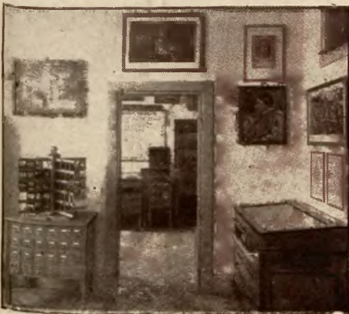
Muzeum Oświaty — Pracownia historii i języka polskiego.

Innymi torami narazie potoczyły się dzieje naszego szkolnictwa i kultury pod zaborem rosyjskim. Cesarz Aleksander I, chcąc uchodzić wobec ówczesnego kursu zachodniej Europy za człowieka liberalnego i zjednać sobie Polaków, w nadziei, że przyciągną doń i swych współrodaków z sąsiednich zaborów, zaczął prowadzić politykę tolerancji, życzliwości i dobrych chęci. Widząc wyższą kulturą Polaki nad półdziką Rosją — mianował kuratorem ks. Adama Czartoryskiego, wychowanka Komisji Eduka-