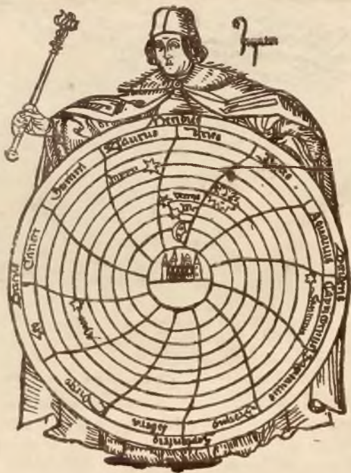
Bakalarz Uniwersytetu Krakowskiego z ówczesną mapą nieba.

zgodę na założenie wydziału teologicznego oraz zapisała na Akademię wszystkie swe kosztowności i klejnoty. Po jej przedwczesnej śmierci dalszą opieką otaczał Wszechnicę król Władysław Jagiełło, przeznaczając na nią część dochodów z żup solnych w Wieliczce oraz ofiarowując dalsze fundacje.