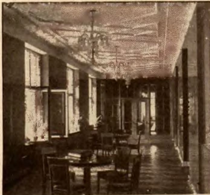
Piękna poczekalnia w gmachu M. W. R. i O. P.

W Małopolsce rozbiory zastały szkolnictwo w stanie ostatniego rozprężenia, gdyż dobroczynny wpływ Komisji Edukacyjnej nie zdołał tam jeszcze osiągnąć, toteż rząd austriacki zabrał się ostro do uszczęśliwienia zaniedbanego kraju na swój niemiecki sposób.