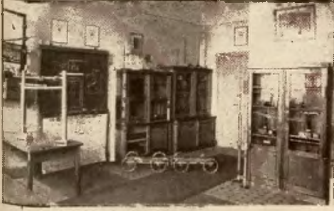
Muzeum Oświaty i Wychowania M. W. R. i O. P. Pracownia fizyczna.

Najsilniejszy ucisk wystąpił początkowo pod zaborem pruskim. Choć następnie zmniejszył się co najmniej, lecz po zwycięskiej wojnie z Francją w roku 1871 spowrotem wzmógł się szalenie pod wpływem rozwoju nacjonalizmu niemieckiego, dążącego do całkowitej germanizacji Polaków, co przejawiało się w postaci walki z Kościołem Katolickim p. n. „Kulturkampf”. Nawet wykłady katechizmu musiały odbywać się w języku niemieckim, a gdy jeszcze nakazano dzieciom odmawiać modlitwy przed lekcjami po niemiecku, wybuchł bunt kilkuset tysięcy dzieci polskich, katowanych następnie przez nieludzkich nauczycieli, i zakończył się słynnym na cały świat procesem we Wrześni w r. 1901.