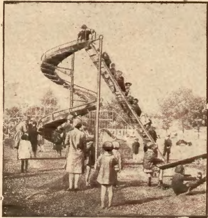
Ogródek Jordanowski dla dzieci w Warszawie.

odrodzenia znikczemniałego pokolenia trzeba tchnąć w pierś jego młodzieży nowego ducha miłości ojczyzny, wiedzy, obowiązku i wyrobić w niem hart woli. Misję tę miał spełniać założony przez siebie w r. 1740 zakład naukowy, — pijarskie „Collegjum Nobiljum” w którym, w przeciwieństwie do skostniałego w łacińskich regułach dotychczasowego szkolnictwa, kazał uczyć fizyki, prawa, języków współczesnych i t. d., wszystkim wykładom nadając charakter społeczny i narodowy.