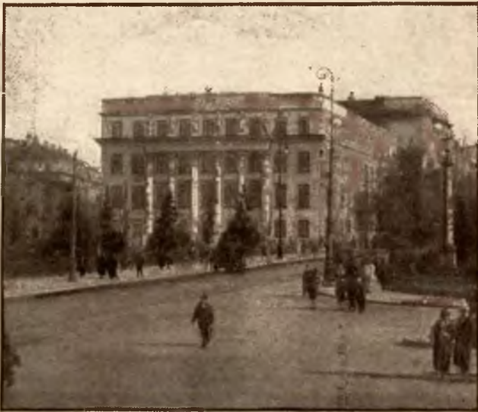
Gimnazjum im. Królowej Jadwigi w Warszawie.

gi rozbiór Polski. W obawie, aby upatrzona zdobycz nie wymknęła im się z ręki czempredzej unicestwili wszystkie wysiłki patrijotów, popelniając jeden z największych gwałtów, jaki zna świat, na żywym ciele Ojczyzny naszej, poczem każdy z trzech zaborów osobną przeżywa gehennę.