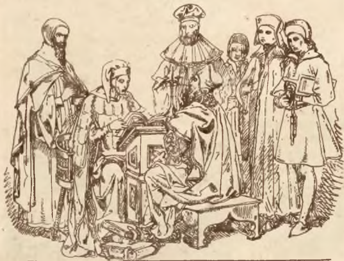
Profesorowie i zacy Uniwersytetu Jagiellońskiego.

Zastój w szkolnictwie nie sprzyjał budzeniu się talentów. Gaśnie zapał i zainteresowanie się nauką i sztuką wśród niebezpieczeństw, niepokojów i trosk. Lecz oto miłościwe losy zsyłają nam człowieka opatrnościowego — zbawcę, którego imię złotymi literami wypisać trzeba w księdze duchowego życia dziejów naszych, a był nim ks. Stanisław Konarski, młody uczonec, który przywdziawszy szatę zakonną Pijarów, po powrocie ze studjów zagranicą, zrozumiał, że dla