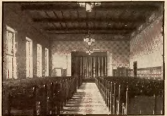
Piękna aula w gimnazjum im. Stefana Batoro.

Polska, jako państwo upadła, lecz praca lat ostatnich niepodległości nie poszła na marne, służąc za bazę do egzystencji narodowej poprzez długie lata niewoli.