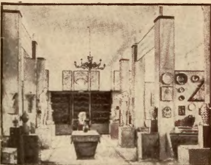
Wystawa prac uczniów szkół zawodowych przemysłu artystycznego.

Obdarzony wielkim poczuciem piękna, zamiłowaniami artystycznymi i zrozumieniem wartości oświaty Stanisław August popiera reformę szkolnictwa