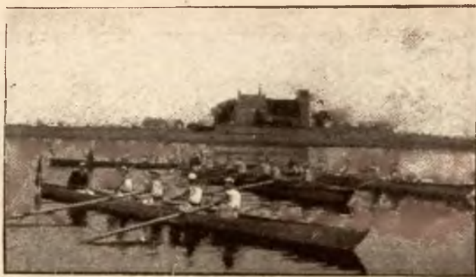
Sport w szkole. — Regaty uczniowskie młodzieży szkolnej w Świeciu.