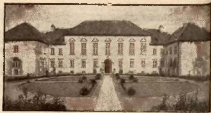
Ogólny widok wzorowego gimnazjum m. Batoro w Warszawie.

gi rozbiór Polski. W obawie, aby upatrzona zdobycz nie wymknęła im się z ręki czempredzej unicestwili wszystkie wysiłki patrijotów, popelniając jeden z największych gwałtów, jaki zna świat, na żywym ciele Ojczyzny naszej, poczem każdy z trzech zaborów osobną przeżywa gehennę.