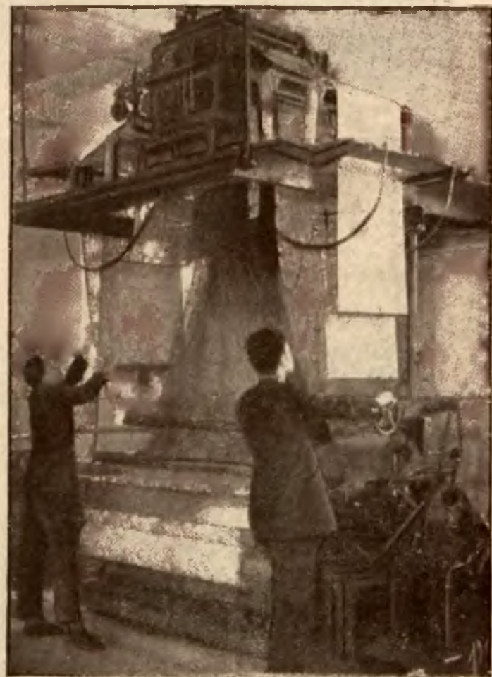
Zajęcia praktyczne w Szkole Zawodowej Przemysłu Włókienniczego w Łodzi.

Dzięki temu wszystkim podniósł się szybko i na ówczesne czasy niesłychanie wysoko poziom ogólnego wykształcenia oraz uświadomienia narodo-politycznego, czego dowodem jest wiekopomna Konstytucja 3-go Maja. Niestety uchwalenie jej wzbudziło przestraszonych i spowodowało sprzeciw trzech sąsiadów — przyspieszając tem dru-