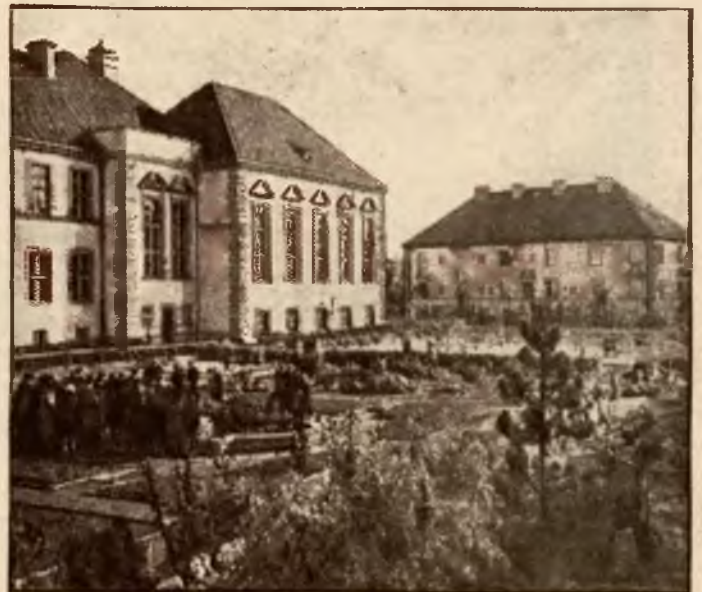
Szkolny ogród botaniczny przy gimnazjum im. S. Batoro.