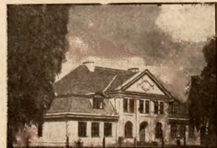
Wiejska szkoła powszechna, w Puszczy Marjańskiej.

Nowoczesny gmach miejskich szkół powszechnych w Warszawie. wiązek wydawania wzorowych podręczników szkolnych. Prezesował temu Ignacy Potocki, a nad wprowadzeniem tych ustaw w czyn czuwał sekretarz Komisji ks. Grzegorz Piramowicz, pełniący funkcje dzisiejszego ministra oświaty.