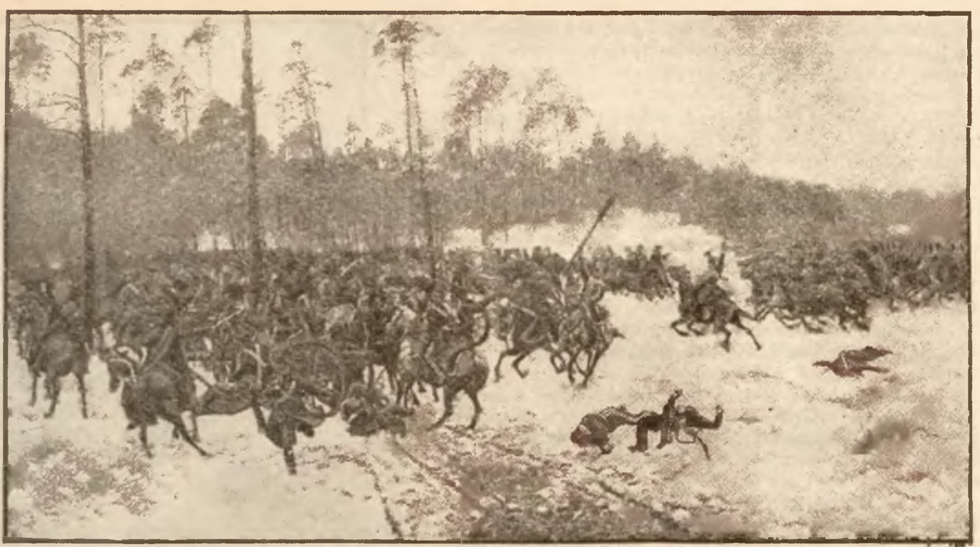
Bitwa pod Stoczkiem — Mal. Jan Rosen.

Grzmią pod Stoczkiem [armaty, Błyszcą białe rabaty, A Dwernicki na przedzie Na Moskala sam jedzie. Hej za lance chłopacy! Czego będziem tu stali?