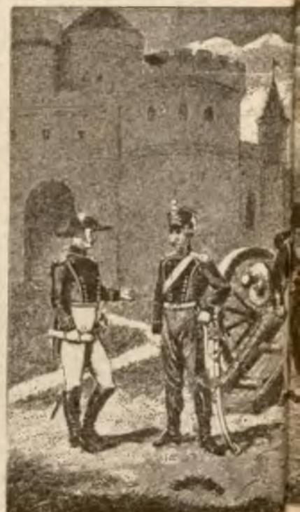
Oficer inżynierów — Artylerja.