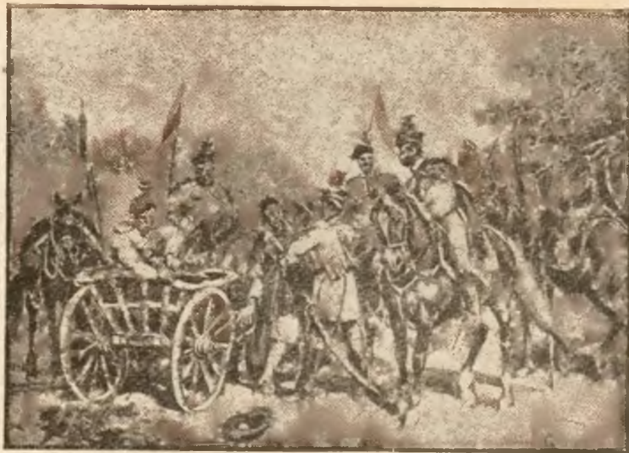
Aresztowanie szpiega. — Mal. Juliusz Kossak.

Mamy więc tu tak popularne dla ojczyzny miano matki, mamy też wspomniany: