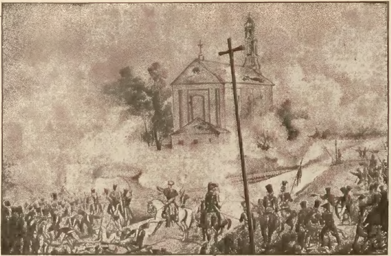
Zdobywanie kościółka na Woli przez Moskali.