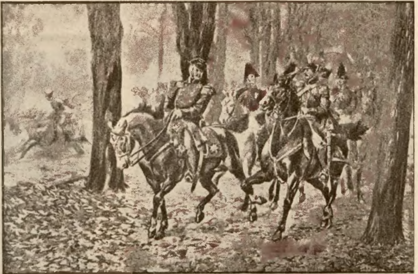
Gen. Dwernicki na czele swego sztabu.

A Dwernicki wspiął konia I okrzykiem ich wita: — Dzielnieście się spisali! Zawsze Polak tak bije! A krakusy wołali — Nasza Polska niech żyje! W. Pol.