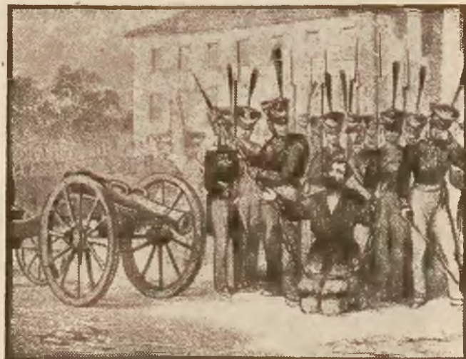
Przykuwanie Waleriana Łukasińskiego do armaty przed wywiezieniem do Rosji.

Ani Chłopicki, ani Radziwiłł, ani Skrzynecki, ani żaden z czołowych generałów nie wykazał danych na dyktatora, nie umiał przekuć w czyn zapa-