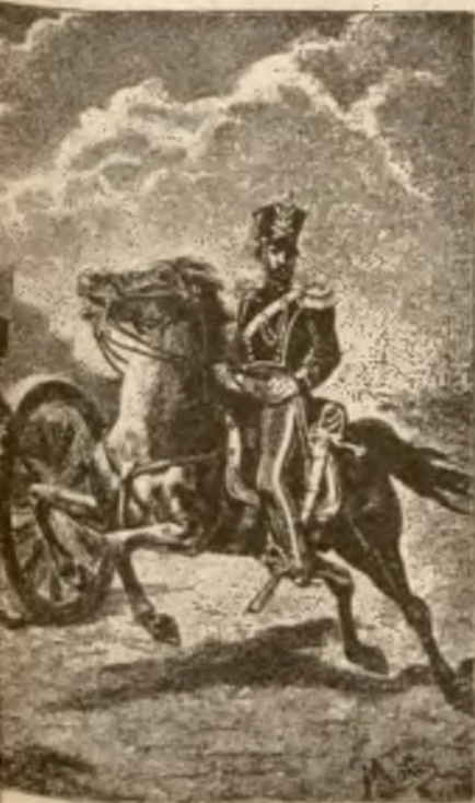
onna — piesza — konna gwardii.

przez naszych poetów. Br. Kicińskiego i Karola Sienkiewicza — z melodią układu muzyka Kurpińskiego, przypominająca nieco nutę Marsyljanki. Zaszczytne swe obywatelstwo zyskała „Warszawianka”, nie tyle dzięki swej bojowej postawie, ile raczej z racji tego, że autor, wieszczym jasnowidztwem jakby natchniony, zdołał odczuć najistotniejsze sedno hasel i cech listopadowej liryki i oddać je w takt serc powstańczych. Mamy więc w „Warszawiance” wszystkie motywy charakterystyczne dla poezji tej doby, a więc przede wszystkim apel do walki wyzwolenczej, wyrażający sakramentalne pojęcia: „Na śmierć lub zwycięstwo!” Oto słowa „Warszawianki”: