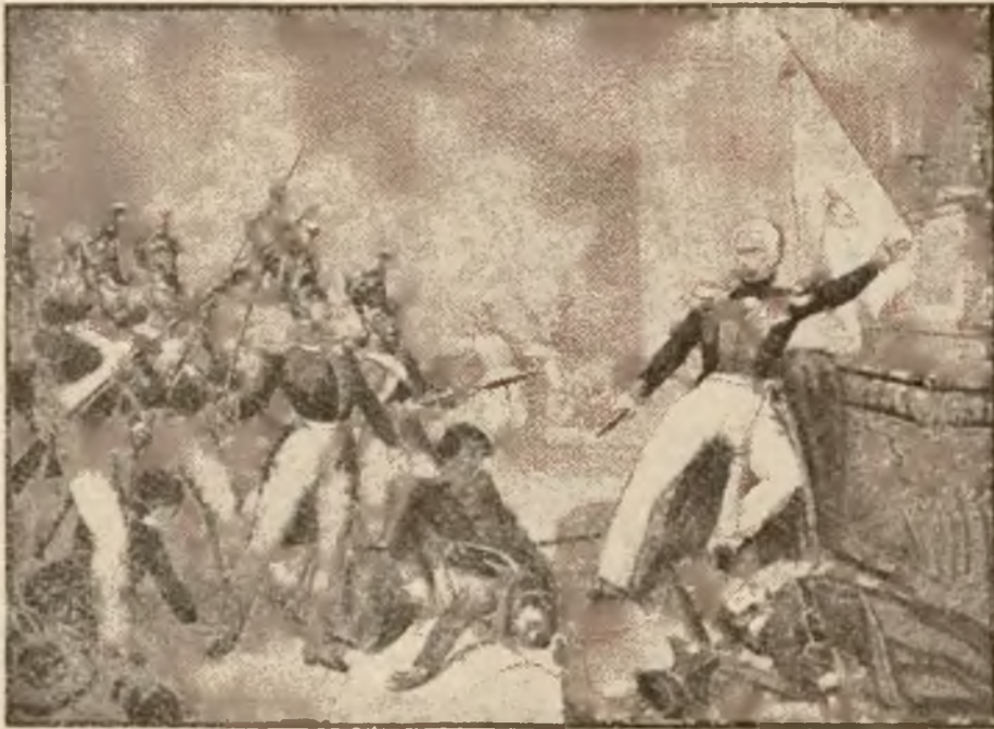
Śmierć gen. Sowińskiego w dniu 6 września 1931 r. na stopniach ołtarza kościółka wolskiego.

Gdy trzechset dział gromy [grzmiące, Dały hasło na bój krwawy, A moskiewskich rot tysiące Biegły na szanice Warszawy, Garstka naszych, za wałami, Przy wolskim skryta kościele, Witając wrogów strzałami,