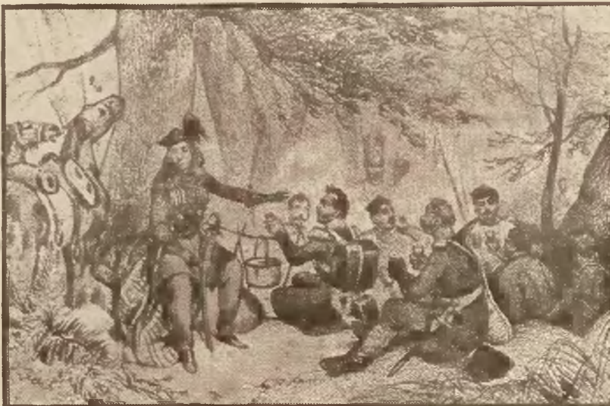
Emilia Plater w obozie powstańców litewskich.