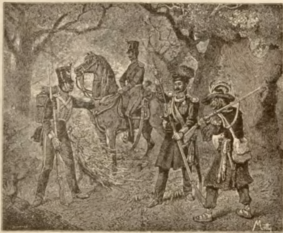
Pułk IV liniowy — Pułk I Strzelców Konnych — Oficer i szeregowiec Kurpików.

„Lat dwadzieścia nasze męże Los po obcych ziemiach gnał, Dziś, o matko, kto poległ, Na twem łonie będzie spał”!