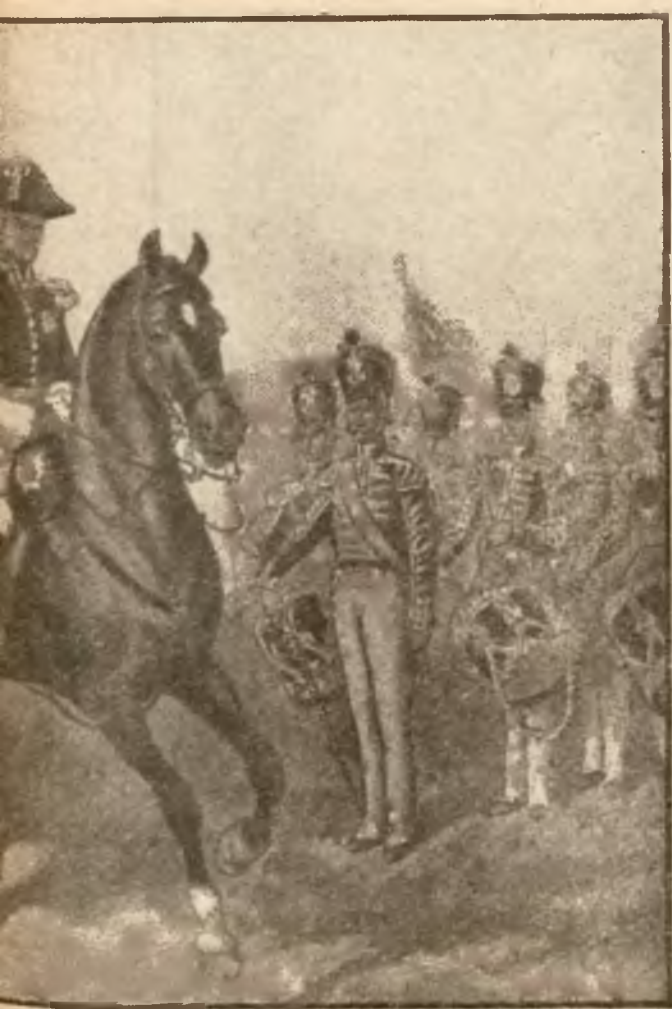
do sztabu. — Mal. Juliusz Kossak.