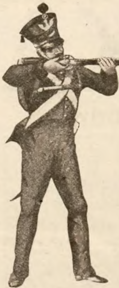
Piechota liniowa z r. 1830.

P owstanie Listopadowe, stworzyło niezwykle bogatą poezję patriotyczno-powstańczą, znaną dziś pod nazwą: liryki listopadowej. Rozwinęła się ona w iście błyskawicznym tempie jako barwny bukiet natchnień, myśli, uczuć i przeżyć charakterystycznych dla tej epoki, tak obfitującej w radosne horoskopy, w górne zamiary, w pełne poświęcenia i zapamięł bohaterstwo, oraz w zmarnowane wysiłki, rozpaczliwym zamknięte zawodem.