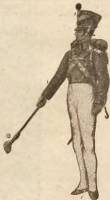
Artylerzysta z r. 1830.