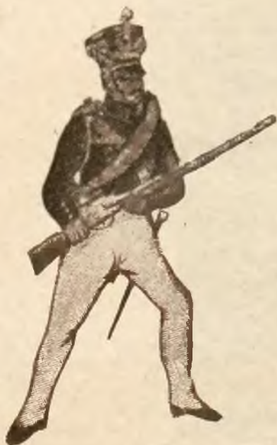
Grenadier z r. 1830.