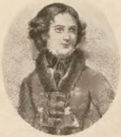
Marja Raszanowiczówna towarzyszka E. Plater, porucznik w Korpusie Giełguda