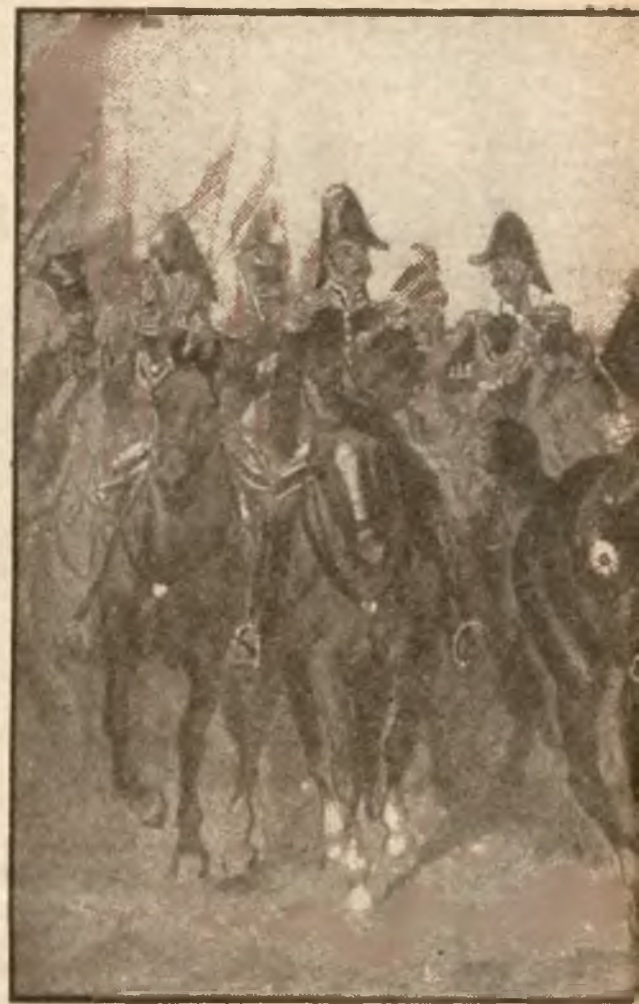
General Skrzynecki na czele

Nie małym wpływem na ideologię powstania listopadowego odbiła się „Oda do Młodości” Mickiewicza, według słów której potęga zapału młodości jest tak wielka, że jest zdolna łeb urwać hydrze, i „zdusić scentaury”. Lecz rzecz osobliwa, że czołowe miejsce w poezji listopadowej zajął utwór Francuza Kaziemierza Delavigne, przetłumaczony dwukrotnie na język polski