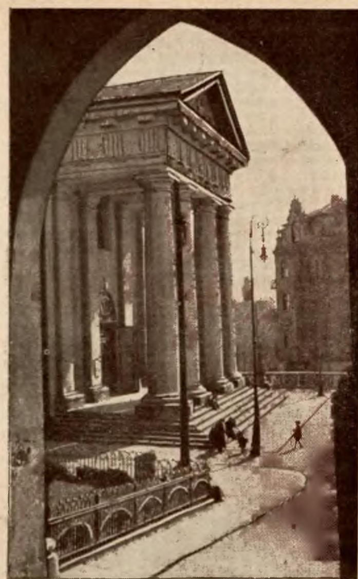
Plac i kościół katedralny Widok z Bramy Trynitarskiej.