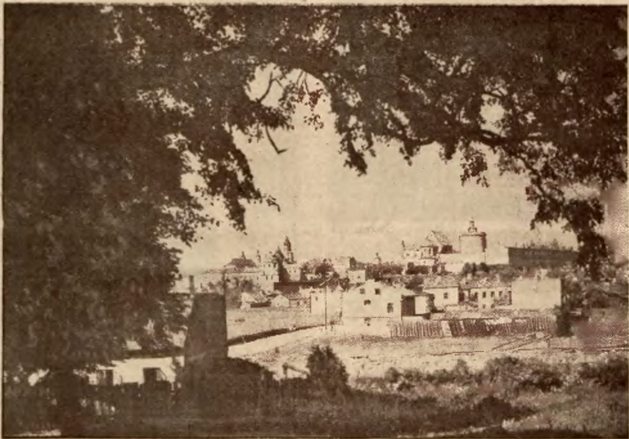
Ogólny widok Lublina.