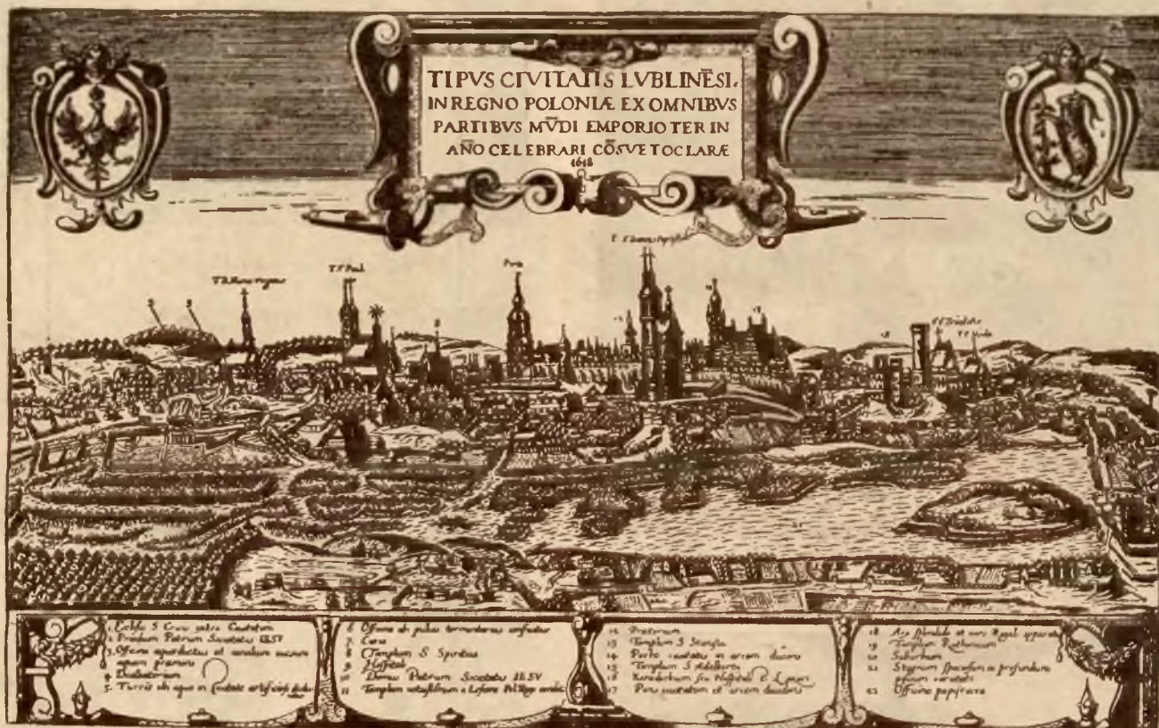
Widok Lublina z r. 1618.

Napad Tatarów w r. 1341 obrócił go w perzynę, lecz odsiecz zbrojna i troskliwa opieka Kazimierza Wielkiego złagodziły ten cios. Król — „wielki budowniczy“, o którym mówiono, że „zastał Polskę drewnianą, a zostawił murowaną“, na miejsce starego wznosił nowy zamek z basztą wysoką, a miasto obwarował wysokimi murami z dwoma gotyckimi bramami wjazdowymi: Krakowską i Grodzką, które w nieco zmienionej i okrojonej formie istnieją po dziś dzień, choć z podkreślających ich obronny wygląd mostów zwodzonych i nawodnionych fos już dawno śladu nie ma. Gotycki kościół św. Trójcy na zamku, tak charakterystyczny przez swą konstrukcję, wspartego na jednej kolumnie sklepienia oraz rozłożysty w konturach kościół Dominikański, posiadający największą ze znanych obecnie, cząstką Krzyża Świętego, ukry-