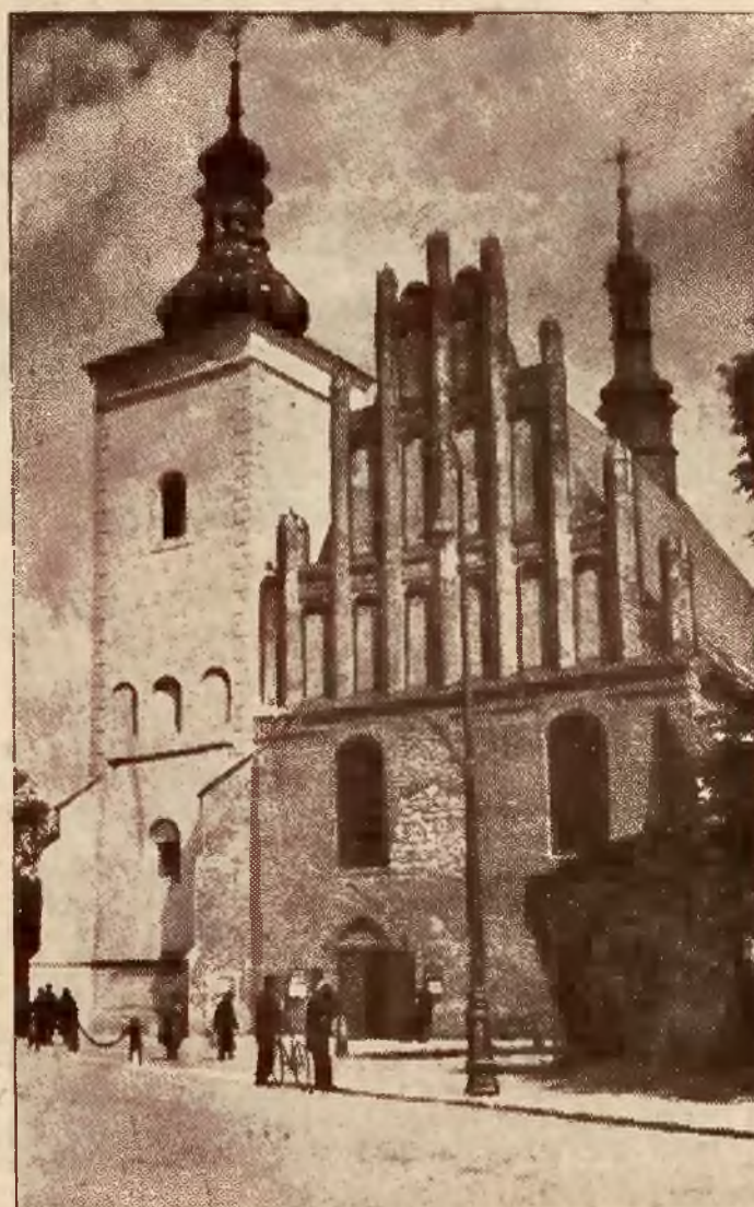
Kościół P. M. Zwycięskiej.