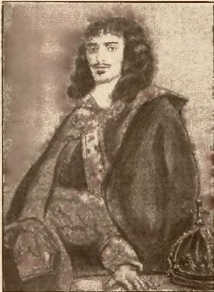
Jan Kazimierz

Lecz oto Moskwa, wzięwszy w opiekę koza-