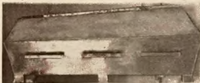
Trumna ze zwłokami hetmana Stefana Czarnieckiego