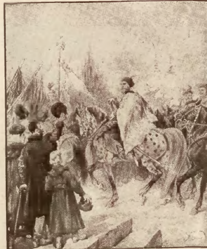
Wjazd Czarnieckiego do Poznania Rys. J. Kossak. upamiętniony w słowach Hymnu Narodowego.

A kiedy po bohaterskiej obronie Jasnej Góry ocknął się cały naród, to i zwolennicy Karola Gustawa zaczynają go opuszczać. Jan Kazimierz wydaje manifest, wzywający naród do czynu i zapowiadający swój powrót, a niemal jednocześnie zawiązuje się w Tyszowcu, w lubelskiem, konfederacja, wzywająca króla wraz z narodem do walki o odzyskanie utraconej niepodległości. Stefan Czarniecki z jej ramienia zostaje ogłoszony regimentarzem, to jest tymczasowym wodzem naczelnym i na zwołanej natychmiast radzie wojennej w Łańcucie, wbrew poglądom hetmanów, przeforsowuje decyzję natychmiastowego podjęcia ofensywy i prowadzenia wojny podjazdowej z unikaniem walnych, otwartych bitew, które z silniejszym technicznie i bardziej wyćwiczonym wojskiem szwedzkim, mogłoby być dla nas niebezpieczne. Rozporządzając szczupłymi siłami, regimentarz przyjmuje pod swe chorągwie tłumnie zgłaszających się ochotników ze wszystkich stanów. Wzywa też do pomocy chłopów. Na ten zew obywatelski nie tylko szlachta i mieszczaństwo, ale i lud wiejski masowo porywa za broń. Udział dzielnych Kurpiów i Górali w tej wojnie, staje się faktem historycznym. Mądrze z góry przemyślany plan tej partyzantki okazał się korzystnym pod względem wojskowym. Nieustanne napady zniemacka po lasach