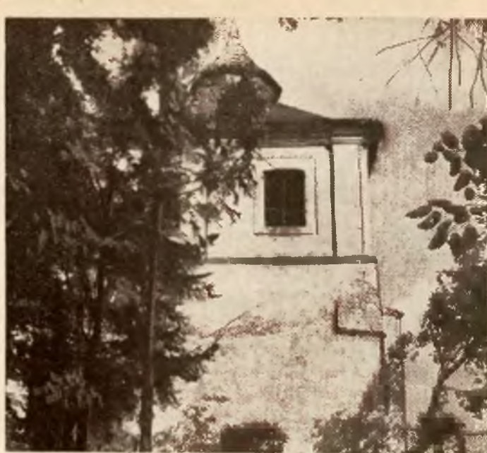
Dzwonnica kościelna w Czarncy