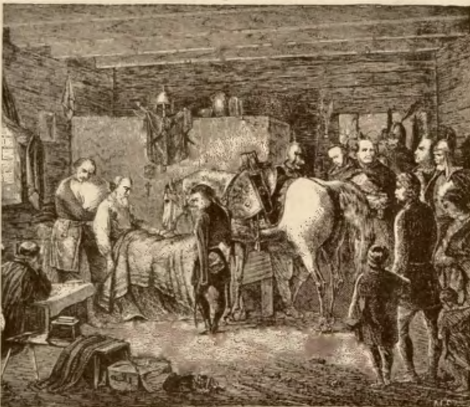
Śmierć hetmana Czarnieckiego

Zadrzał stępak u żłobu powolny Wzniósł na łożu głowę Hetman polny. — Wprowadźcie go! — skinął na [husarzy. I wnet „biały” po izbie się waży, Na pierś tarcą kładzie łeb swój suchy, (A obydwaj biali, jak dwa duchy). Śmiał się hetman, jak dzieciak [szczęśliwy, Tuląc ręce między śniegi grzywy: — „O mój biały”... A biały, spokojnie Zda się z panem rozmawiać o wojnie.