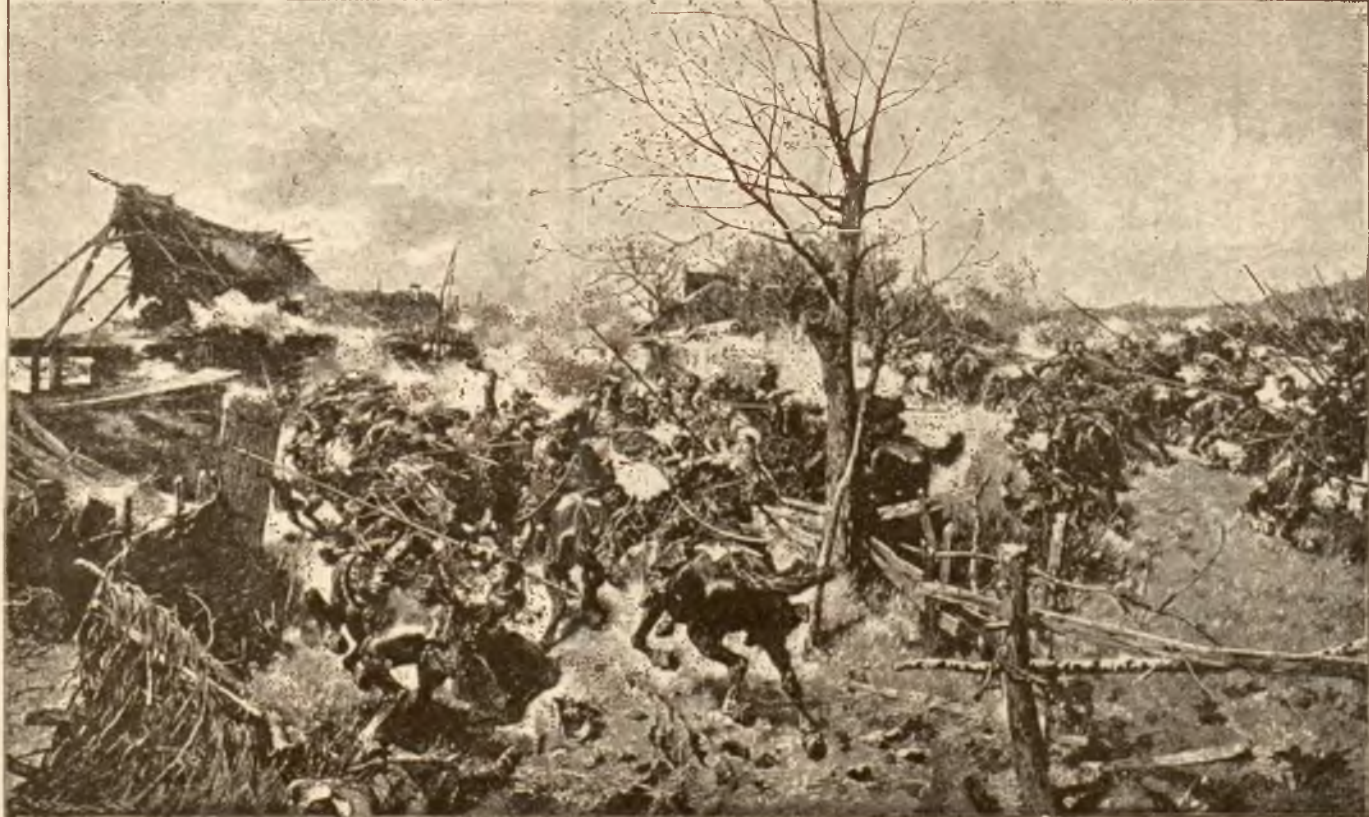
Utarczka ze Szwedami pod Klawaniami