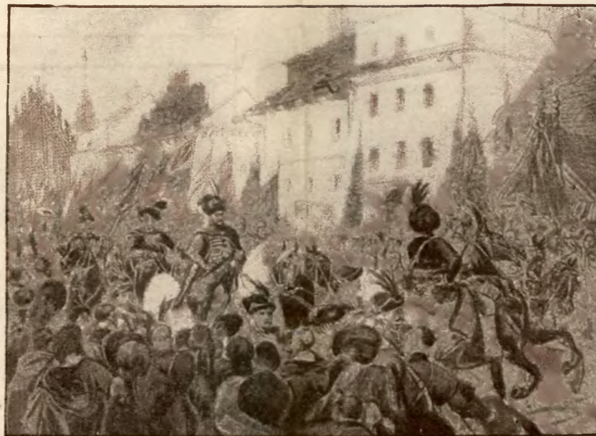
Wjazd S. Czarnieckiego do Krakowa