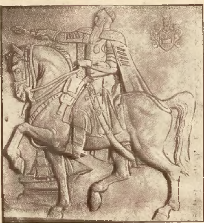
Pomnik-Grobowiec S. Czarnieckiego wzniesiony w r. 1935 w kościele w Czarncy przez Komitet Propagandy Czynu Polskiego.

Jego pogarda śmierci, nieustraszona odwaga, brawurowa, kawalerska fantazja, śmiałość, trafność i szybkość decyzji, impet w ruchach, nieugięta, wytrwała, sugestywna wola i umiejętność wydobycia