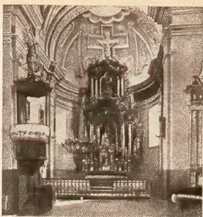
Wnętrze kościoła w Czarncy