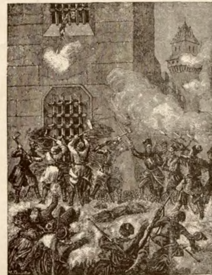
Rys. J. Lewicki.