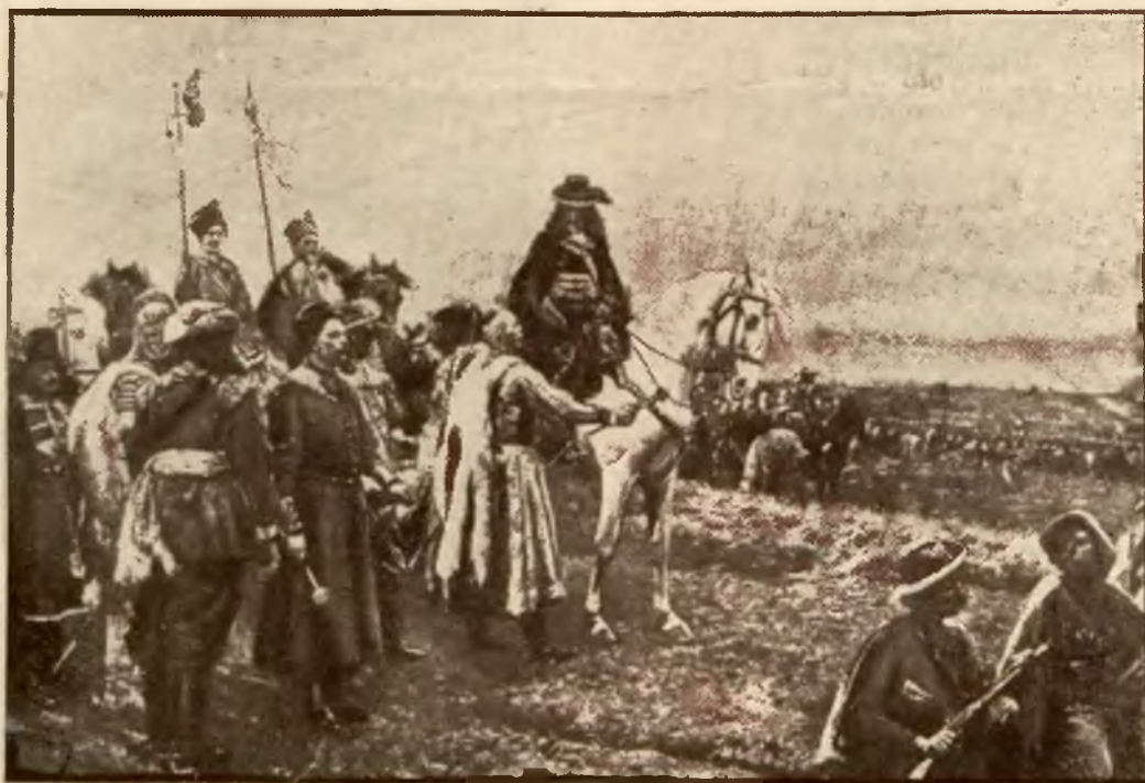
Król Jan Kazimierz przed bitwą pod Beresteczkiem

W trzydniowej bitwie pod Beresteczkiem 100 tysięcy pospolitego ruszenia pobito na głowę 350 tysięcy Kozaków i sprzymierzonych z nimi Tatarów. W bitwie tej Czarniecki dowodził prawym skrzydłem wojsk i odznaczył się swą odwagą i zdolnością, a następnie żywiołowym pościgiem za Kozakami.