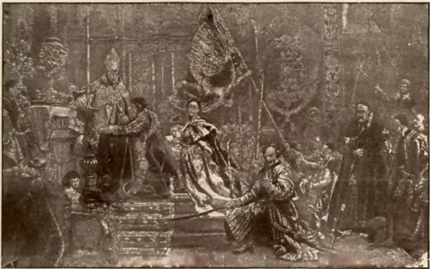
Śluby Jana Kazimierza