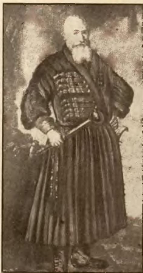
Hetman Stefan Czarniecki

Po ukończeniu chlubnie pod rozkazami hetmana Koniecpolskiego kampanji szwedzkiej w r. 1629, unoszony przez niepohamowany temperament, który mu nie pozwala bezczynnie siedzieć w domu, wstępuje