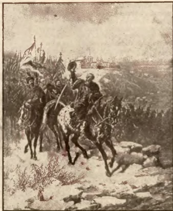
Czarniecki pod Płockiem Rys. J. Kossak. przechodzi wpraw przez Wisłę w pogoni za Szwedami

I teraz znowu cnoty żołnierskie Czarnieckiego zajaśniały całym blaskiem, czyniąc zeń człowieka opatrnościowego, zesłanego dla ratowania Ojczyzny. Jego dwa zwycięstwa w Wielkopolsce i dzielna obrona oblężonego Krakowa, wzbudziły szacunek nawet u wroga. Nieustraszony, wszędzie obecny, umiejący wnikać w każdy szczegół i wszystko przewidzieć, zagrzewa on żołnierzy, a raniomy w twarz, mimo dotkliwego bólu, trwa na posterunku, aby nie dopuścić do popłochu. Jednak, gdy okazało się, że dalszy opór jest bezcelowy i kapitulacja nieunikniona, gdyż cały kraj poddał się Karolowi Gustawowi i na odsiecz niema co liczyć, umiał wyjednać sobie warunki honorowe, co dowodziło, że i król szwedzki go ocenił i dlatego odniósł się do swego przeciwnika z należnym mu szacunkiem i uznaniem.