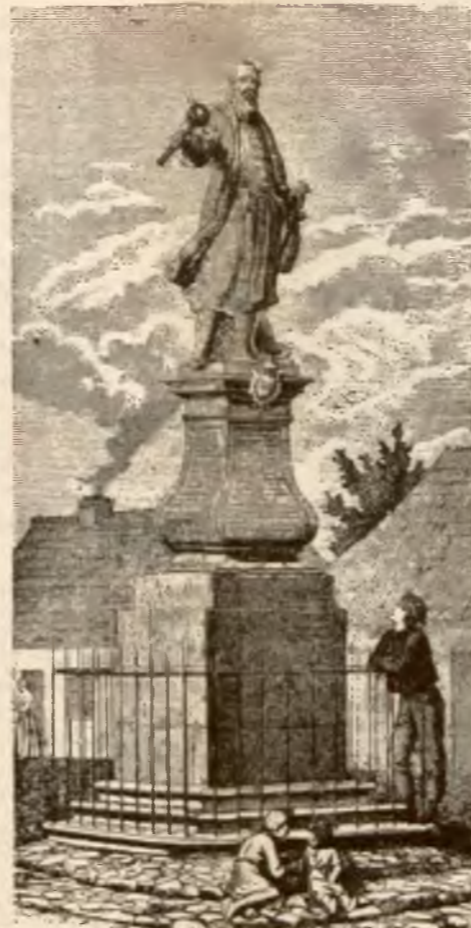
Pomnik hetmana w Tykocinie