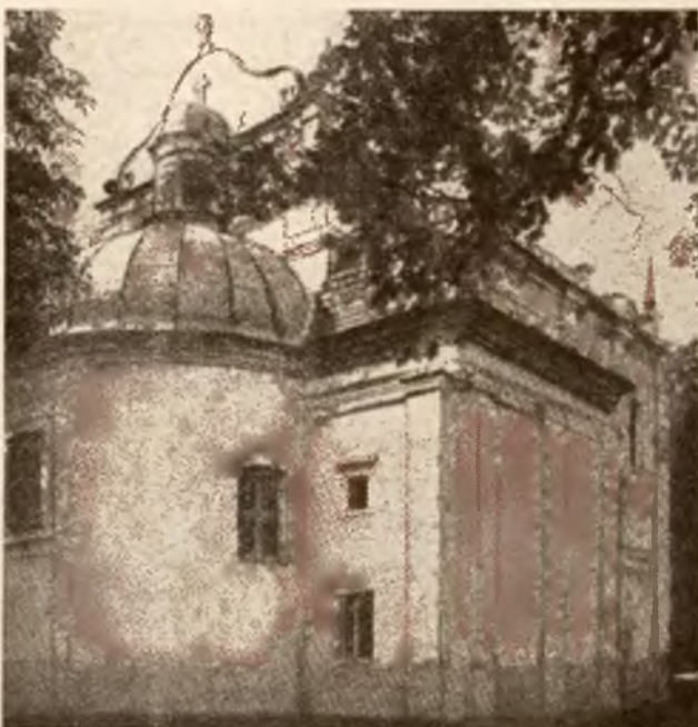
Widok zewnętrzny kościoła w Czarncy

Podane na tej stronie ilustracje dają wyobrażenie, jak się dziś przedstawia ta cenna pamiątka po wielkim bojowniku o wolność i całość Polski.