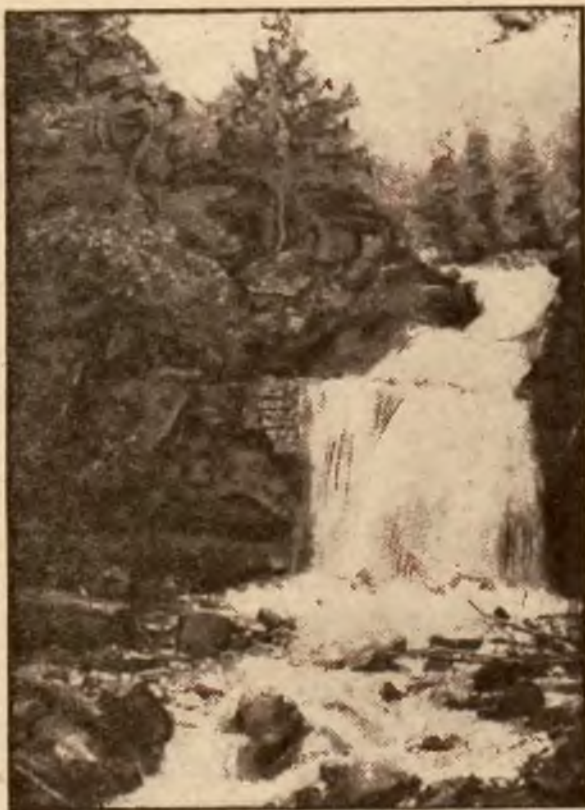
Wodospad Białej Wiselki.