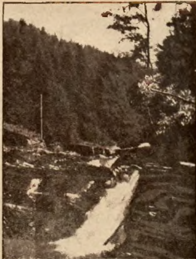
Wodospad Czarnej Wiselki.

„Nie rzucim ziemi, skąd nasz ród. Nie damy pogrześć mowy. Polski my naród, polski lud, Królewski szczerp Piastowy!”