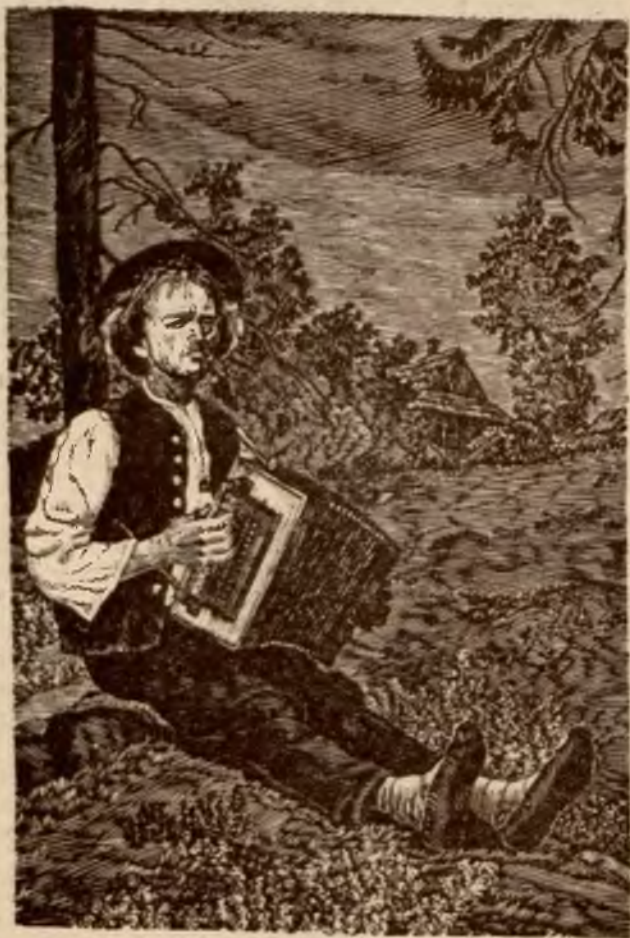
Przeworył J. Walacha.

tryska „z pod Skałki“ na północo--zachodzie pochyłości Baraninej i skacząc wesoło po jasnym piaskowcu w dolinie pełnej światła i przestrzeni, przelewa się z szumem z twardych progów na skaliste dno tworząc liczne kaskady, a między nimi najpiękniejszy srebrzysto kryształowy wodospad Białki. Powstałe dalej z niego baseny wodne są pełne „zwinnych,