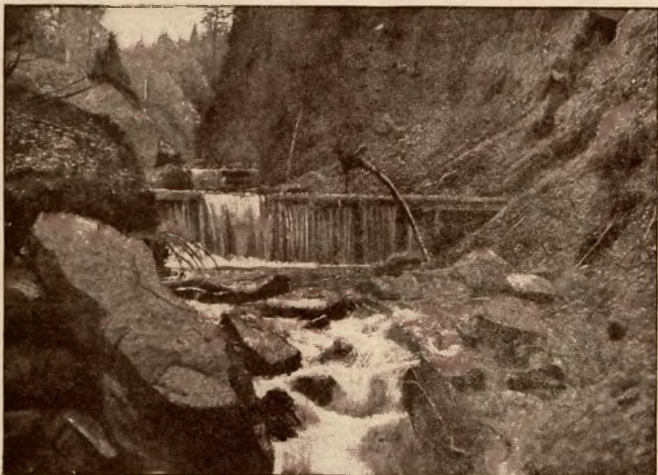
Wodospad w dolinie Białej Wisłki.