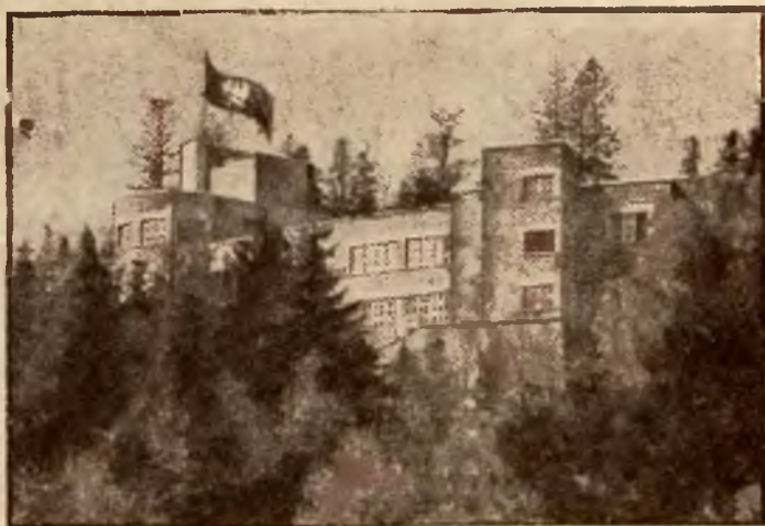
Zamek Pana Prezydenta w Wiśle.

dobne do swych domowych, dymnych chat, prastare olbrzymie księgi modlitewne, z którymi w rękach na tle panoramy gór podąża w niedzielę na nabożeństwo.