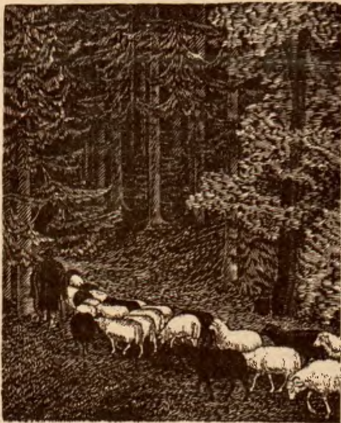
Drzeworyt L. Wałacha.

Szeroko rozłożona w dolinie rzeczki Wisły, prastara bo już od XII w. istniejąca wieś Wisła, choć już dawno „odkryta“ przez uczonego medjumistę dr. J. Ochorowicza, była jednak jeszcze przed 15 laty tylko pierwotnem, mało znanemu szerszemu ogółowi osiedlem górskim, które za jedyny łącznik ze światem, miało wyboisty, ciągnący się u stóp Czantorji, trakt. Obecnie dzięki inicjatywie daleko widzącego gospodarza tych stron, wojewody śląskiego, Grażyń-