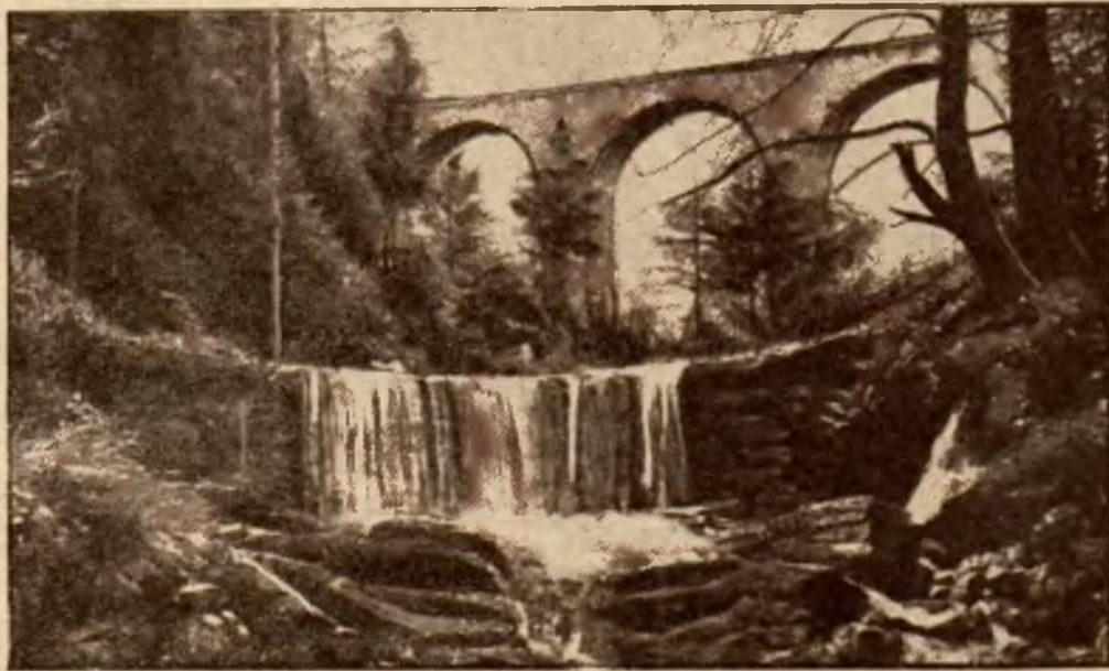
Wodospad Wisły w Łabajowie.

Jeżeli miarą piękności krajobrazu jest wywołanie przezeń pragnienie stałego