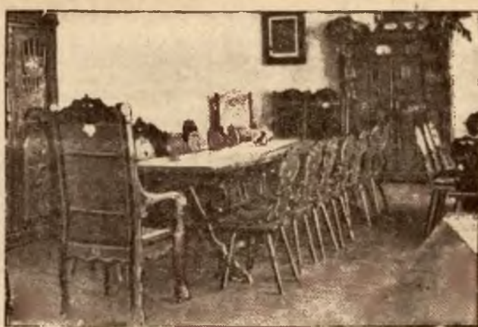
Świetlica w Stanicy Harcerskiej na Buczu.

Mimo powierzchownej metamorfozy nie straciła Wisła nic ze swego regionalnego uroku, bo lud tamtejszy z godnym czci pietyzmem, zachował swe cechy odrębne. swój strój osobliwy, wdzięczną gwarę, stare obyczaje, malowane skrzynie t. zw. „tróły“ ręczne robotki i tkactwo oraz budownictwo zewnętrzne po-