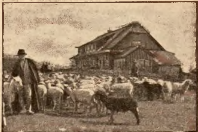
Wypęd owiec na Czantorji.

Widoczne jest również schronisko turystyczne.