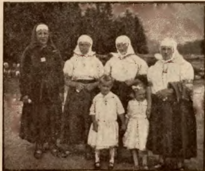
Gaździnki z Istebnej.

Toteż nic dziwnego, że właśnie z łona jednej z tutej-