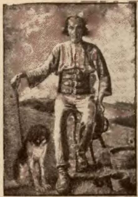
Drzeworyt J. Walacha.