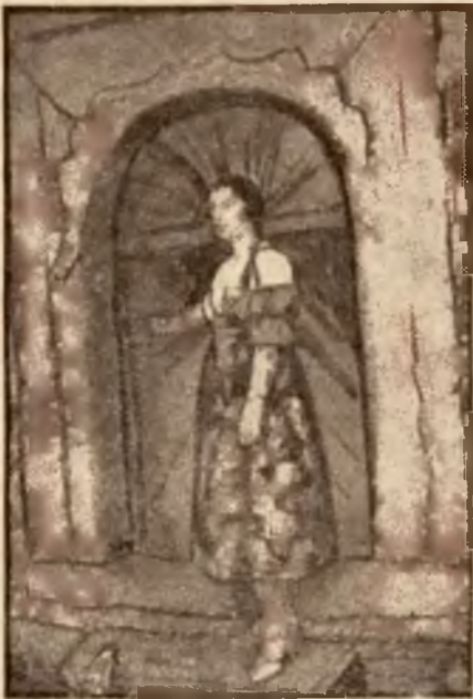
Góralka z Wisły.

Drugi strumień pod mianem Białej Wisetki wy-