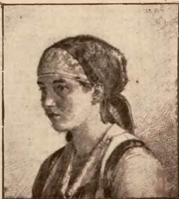
Rys. J. Walach.