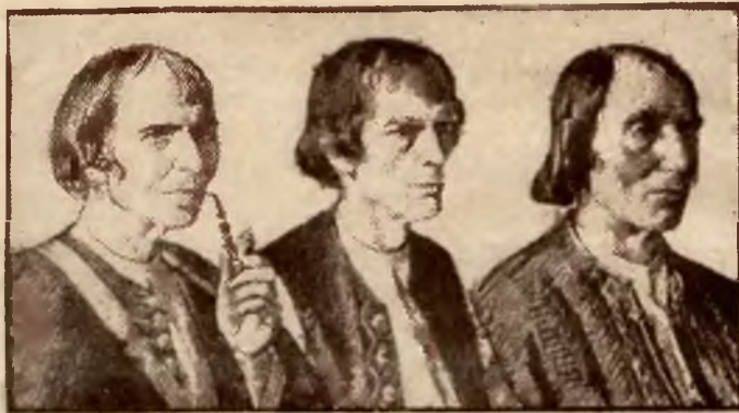
Rys. J. Walach.

Czarnocha wyruszyła w drogę do doliny, Białka zaś żwawo podążyła ku północy, skacząc swawolnie na skały, przepaści i przyspiewując sobie wesoło. Lecz wkrótce zeszyły się znów niespodzianie, więc postanowiły już odtąd więcej nie rozłączać się, a wędro-