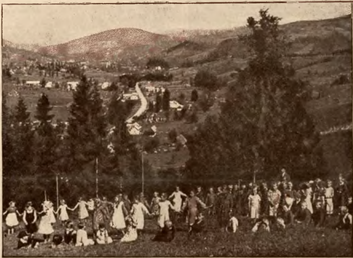
Widok ogólny na uzdrowisko w Wiśle.

Wspólnym dziełem obu artystów jest wnętrze kościółka istebniańskiego. Zarówno rzeźby w kłosa i gałązki świerkowe z Orłem Polskim i Matką Boską Częstochowską, główny ołtarz, jak i złożona z grup symbolicznych i ornamentów o deseniach w stylu ludowym polichromja ścian. „Co mają najlepszego to dali Bogu, niech ich za to Bóg wynagrodzi“ — powiada