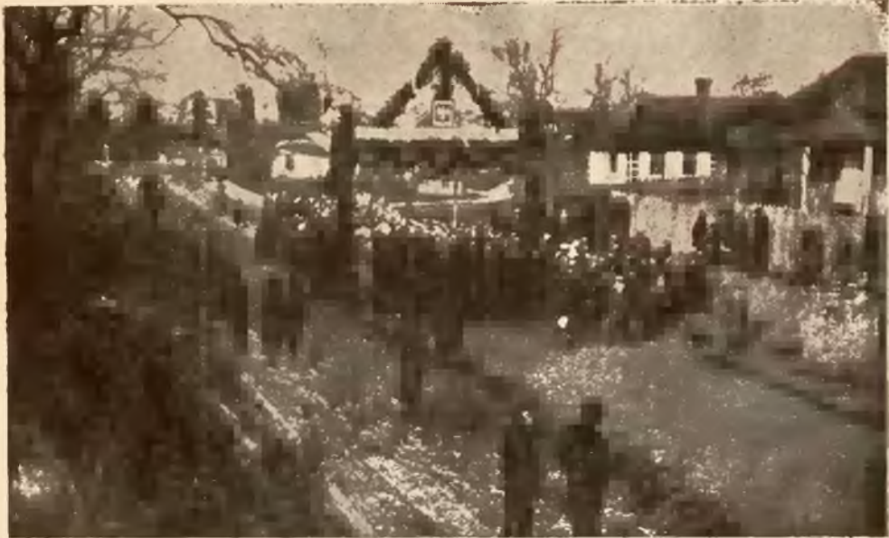
Uroczystość otwarcia i poświęcenia drogi pow. Nr. 7 dnia 14. XI. 1937 w Warężu.