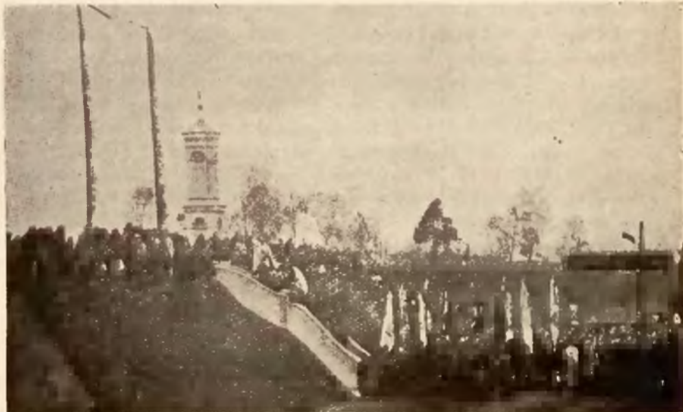
Uroczyste otwarcie drogi pow. Nr. 7 i poświęcenie Pomnika z r. 1704 dnia 14. XI. 1937 w Wareżu.