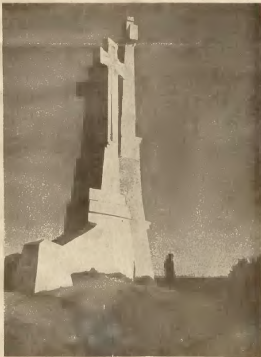
KRZYŻE NAD MIĄSTEM brom