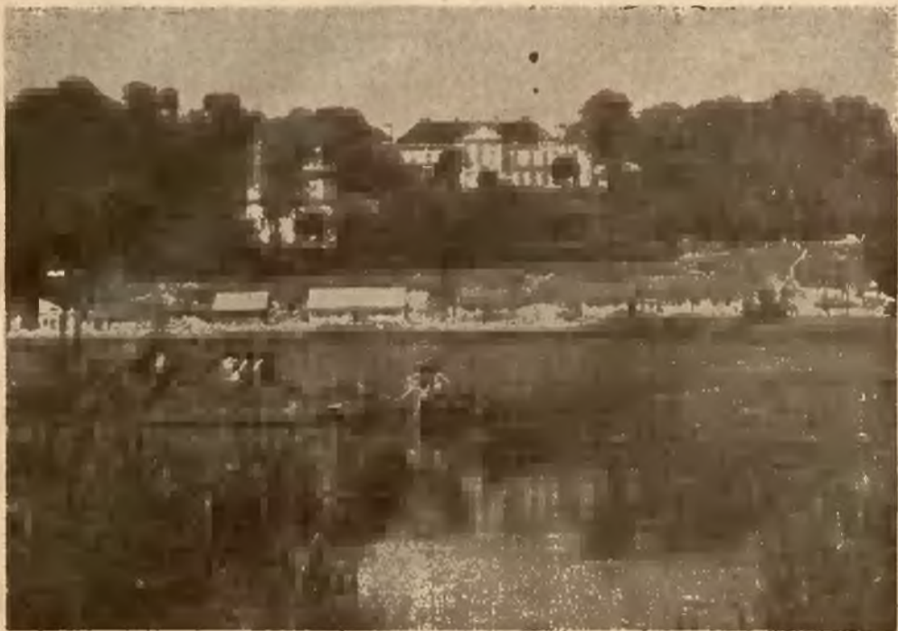
WISNIOWIEC. PAŁAC NAD HORONYEM