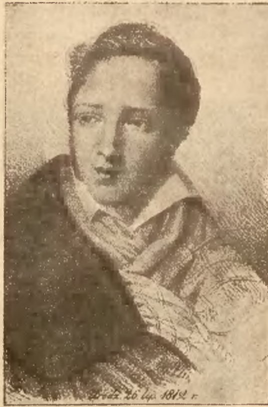
J. I. KRASZEWSKI w r. 1837