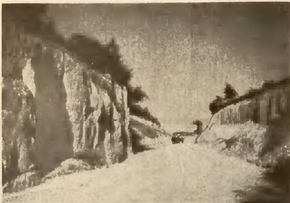
DROGA PRZEZ JAR.

W 1936 r., popierany przez władze państwowe na Wołyniu tygodnik ukraiński