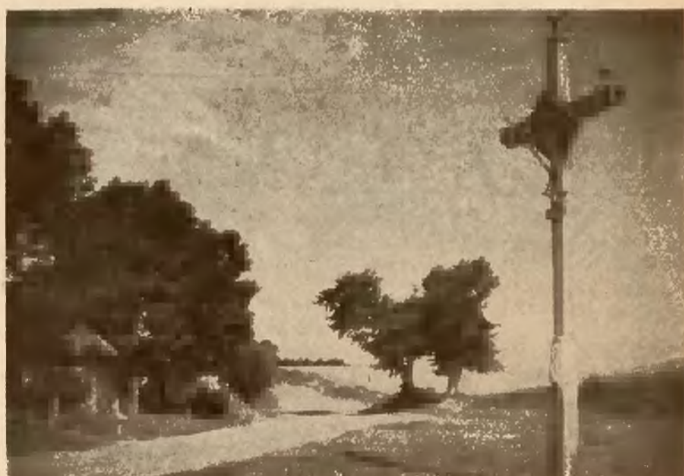
KRZYŻ PRZY DRODZE.