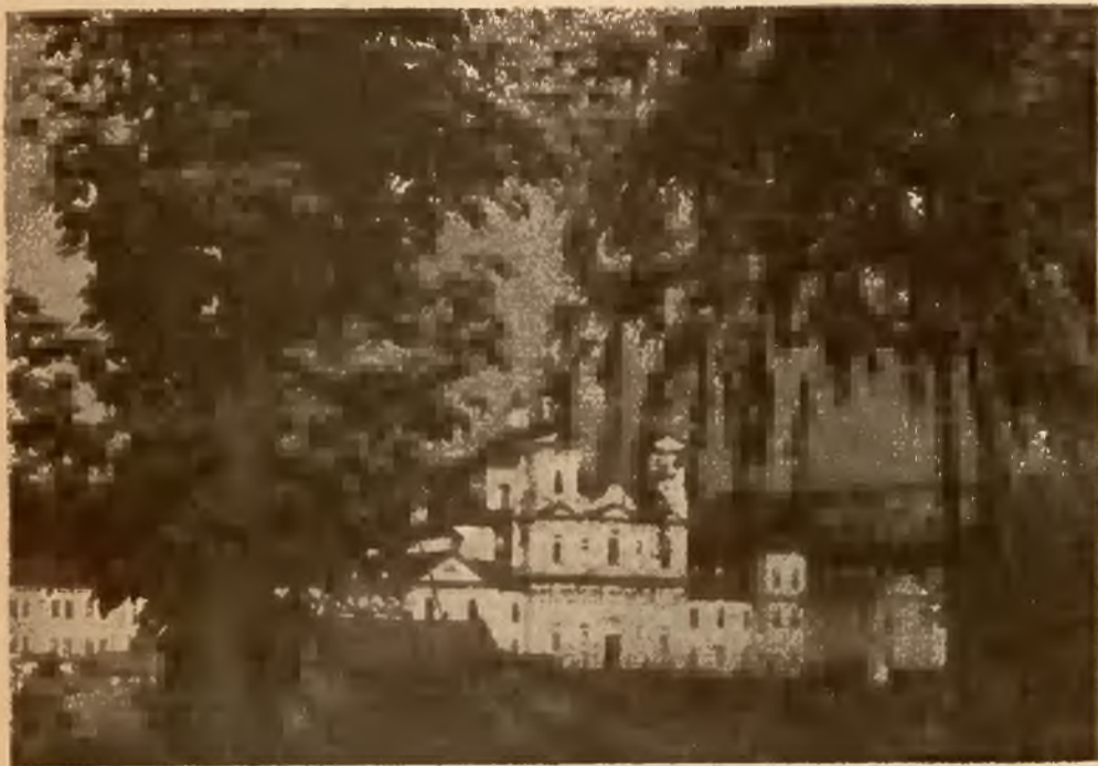
KRZEMIENIEC - LICEUM

Trzydziestoletni wysiłek Wilna i jego kolonii południowej, Krzemieńca zapewnił ciągłość rozwoju kulturze doby Stanisławowskiej, zainicjował życie naukowe Polski na wszystkich polach (w humanistyce, przyrodznawstwie, naukach stosowanych), wychował ogromny zastęp inteligencji, która przez cały wiek XIX utrzymała polski charakter „krajów zabranych”, przeniknęła do innych dzielnic, pojawiła się gromadnie na emigracji, czynna była na wygnaniu — w Rosji, na Kaukazie i Syberji, wszędzie wybijając się swoją inicjatywą twórczą.