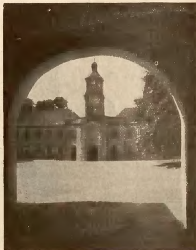
OŁYKA — ZAMEK RADZIWIŁŁÓW.

ważnie nie zrozumiałej dlań akcji urzędowego ukrainizmu, a czasem potrafi nawet stawić zdecydowany opór, na przykład w kwestii ukrainizacji cerkwi.