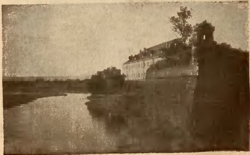
DUBNO, NAD IKWĄ — ZAMEK

Studjowanie przeszłości kraju, podróże po jego obszarach, bezpośrednie i listowne stosunki ze społeczeństwem kresowym, zdobywanie i poznanie wielu papierów rodzinnych, listów, pamiętników, (z których wiele wydał), nakoniec zebranie niezliczonych ustnych relacji, nagromadziło w żywym umyśle znakomitego pisarza olbrzymi zasób materiału do odmalowania żywiołu kresowego.