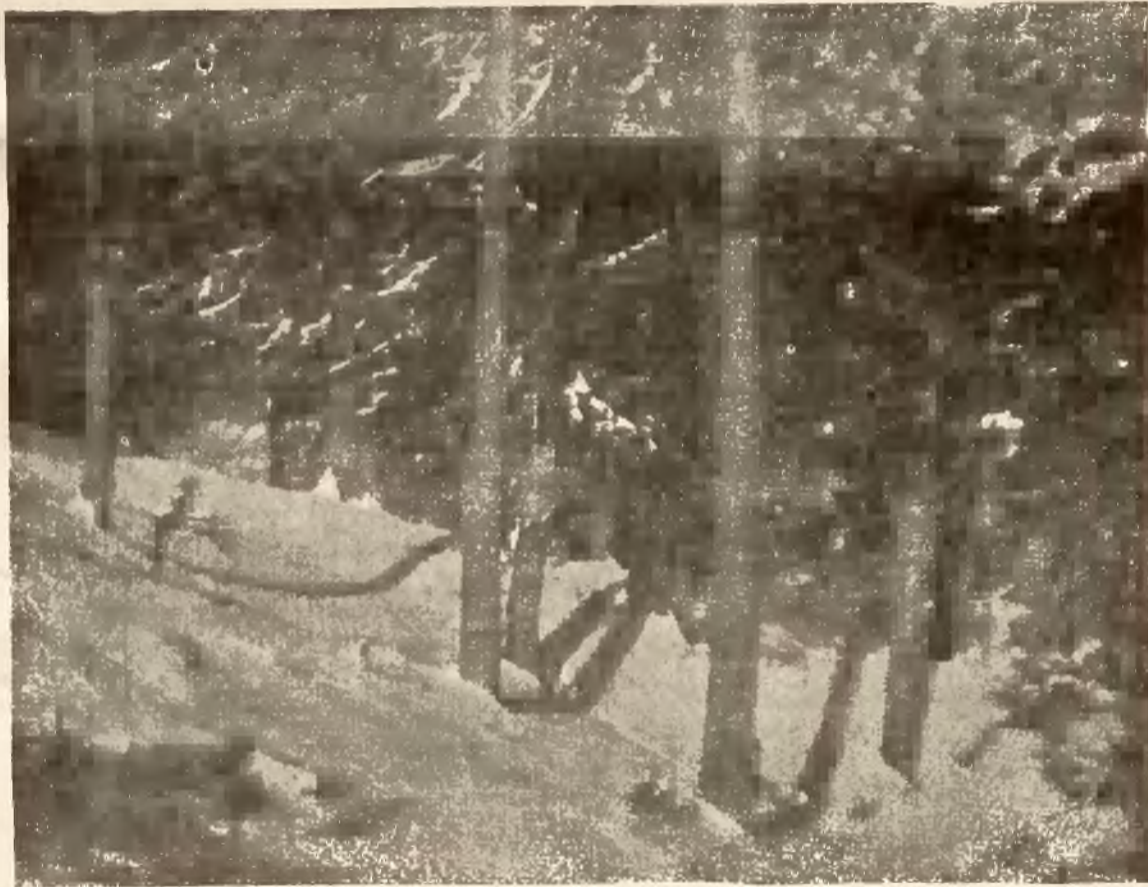
DROGA NA PASTERKĘ.

Nie łatwizna, nie pośpiech, nie namiatki — czynów, myśli, twórczości, tylko fundamentalne budowle, tylko jednostki z charakterem, z własnym stylem — są współczesnemu życiu potrzebne.