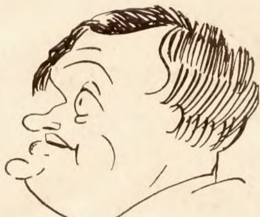
Cat — Mackiewicz.