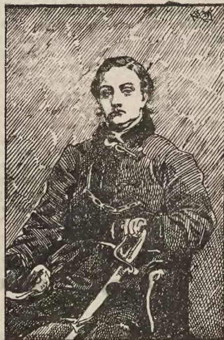
Pustowójtówna adjutant Langiewicza.