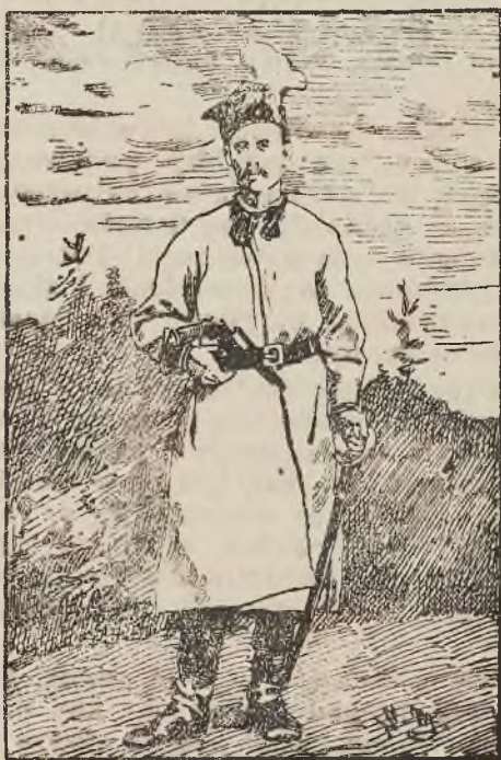
Maciek z powstania.