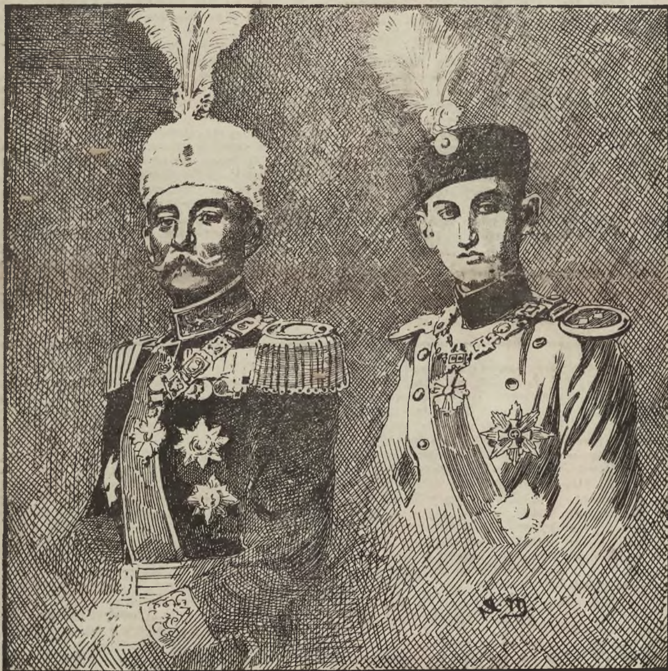
Piotr król serbski.

Jeżeli jednak kobieta, na ogół biorąc, nigdzie dobrze nie zastąpi dobrego kierownictwa męskiego w wychowaniu chłopców, to