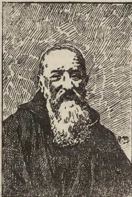
O. Waclaw Nowakowski Kapucyn.

które wzięły udział w powstaniu styczniowym.