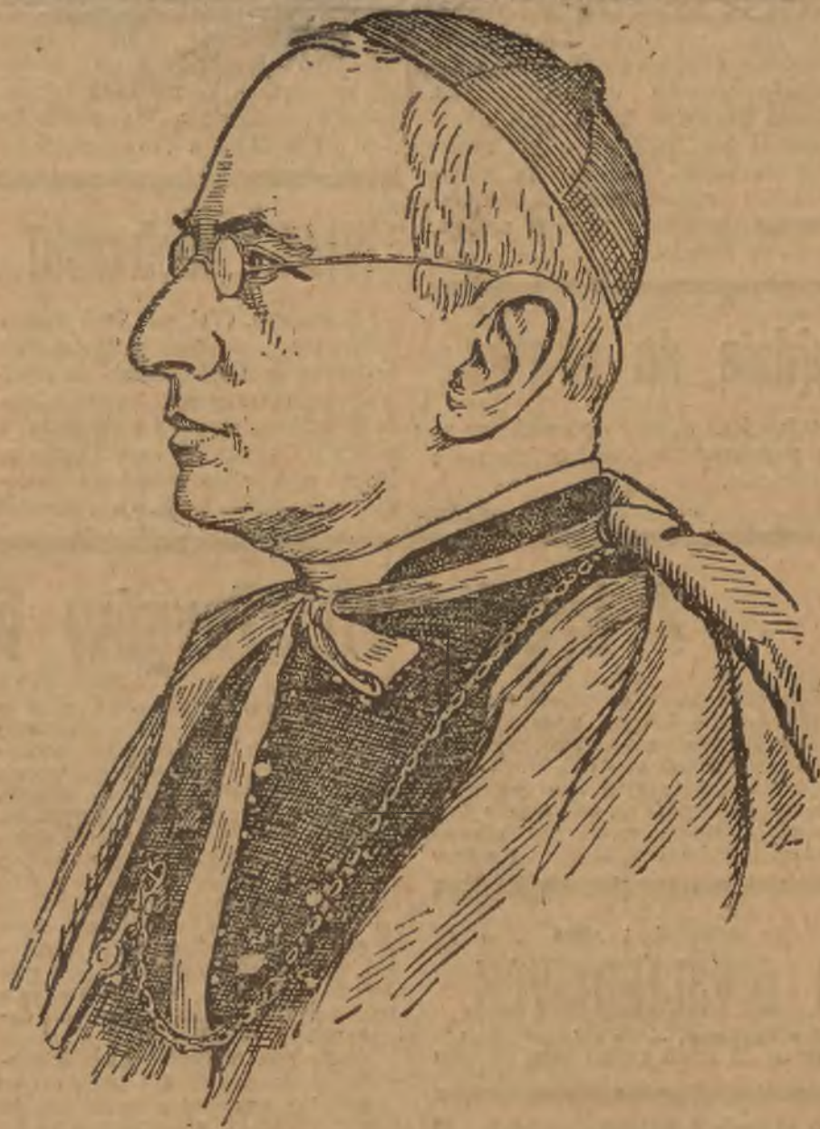
KS. ARCYBISKUP BOLESŁAW TWARDOWSKI.

społeczną działalność kościoła rzymsko-katolickiego na kresach i działalności tej niezliczone pomniki, do dnia dzisiejszego częstokroć zachowane, rola i ważność dziejowa kościoła tem bardziej się uwypukla.