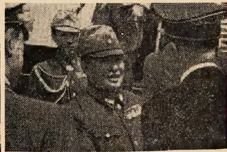
Fragment powitania ambasadora Oshimy przez posła v. Wühlscha na lotnisku w Krakowie.

Kraków, 6 sierpnia. We środę w południe przybył na lotnisko w Krakowie ambasador cesarstwa Japonji w Berlinie general-