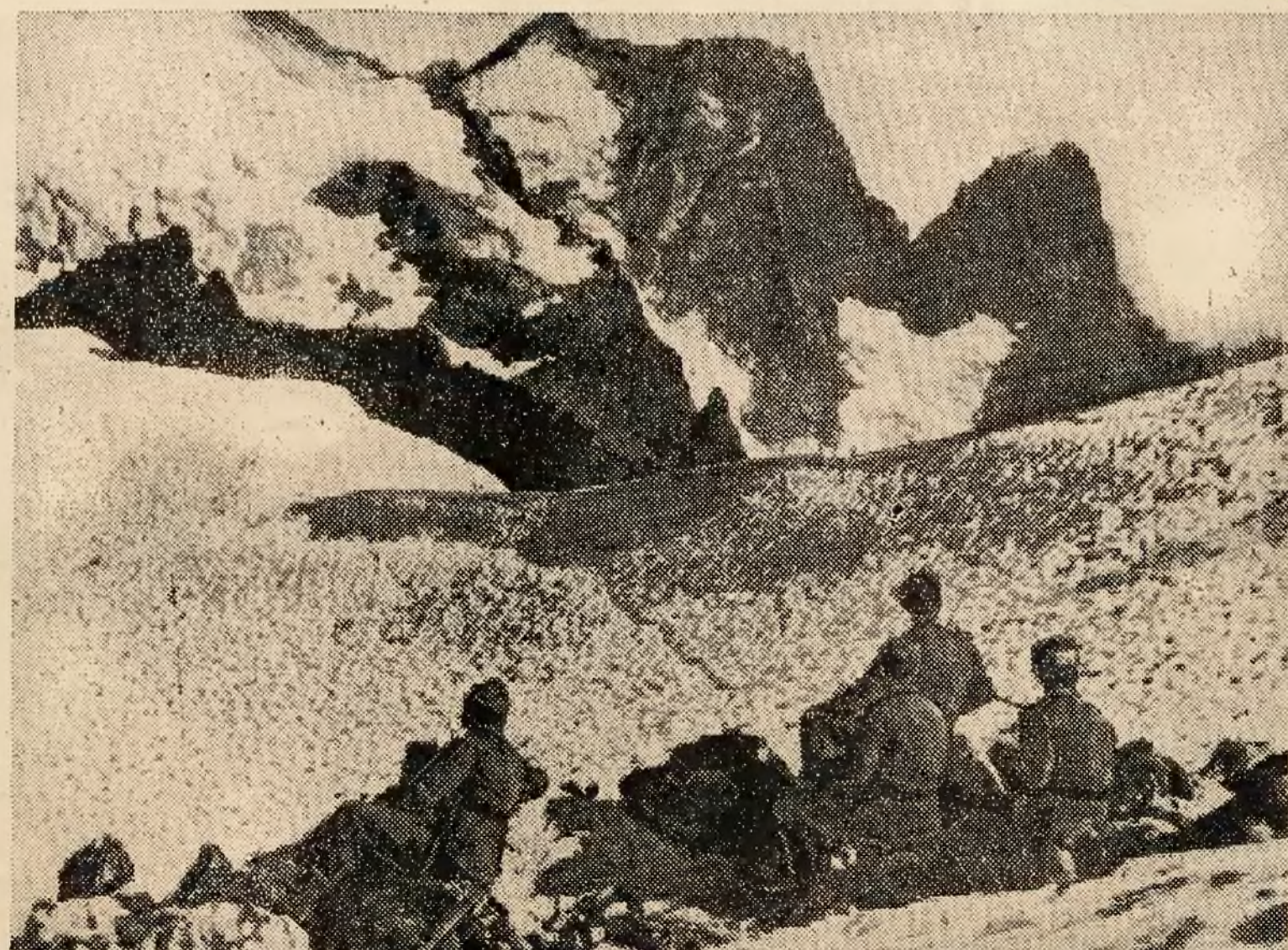
Wojna w górach Kaukazu stawia armji niemieckiej wielkie nieraz wymagania, kiedy przychodzi przekraczać przełęcze i zdobywać szczyty. Ilustracja nasza przedstawia oddział niemiecki na jednej z przełęczy na Kaukazie, którą po długim marszu trzeba było zdobywać na zacięcie broniących się bolszewików.