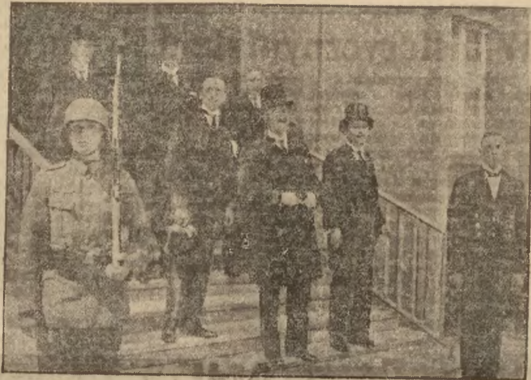
Wśród dyptomatów, którzy wyrazili kondolencje spowodu zgonu marsz. Hindenburga, widziemy w (środku) ambasadora Francji Francois-Poncet.