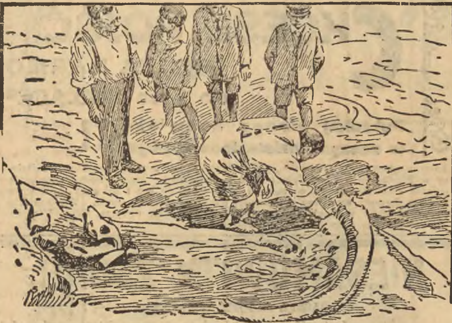
Sensacyjne wykopaliska. W mieście Kremis, leżącym nad Dunajem, dokonano w tych dniach sensacyjnego odkrycia. Znalczono mianowicie zęby mamuta, doskonale zachowane. Jeden z nich ma 1.45 m. długości.

LIPSK 16.30 Koncert radjoork. BRA-TISLAWA 18.00 Recital skrzypcowy prof. R. Basse, KALUNDBORG 22.10 Muzyka kameralna, WROCLAW 19.00 „Orfeusz w piekle”, 20.30 Wieczór niemieckiej pieśni ludowej, DAVENTRY 21.00 Koncert spacerowy, SZTOKHOLM 20.00 Koncert symf. RZYM 21.03 Wieczór muzyki lekkiej. LANGENBERG 21.00 Soliści: B. Mittman (skrz.) i L. Mittmann (fort.). PRA-GA 21.00 Koncert symfoniczny radjoork. MEDJOLAN 20.40 „Il Tabarro” i „Gianni Schicchi” opery Pucciniego, WIEDEN 20.35 Koncert symf. PARYŻ 21.00 Radjo-koncert.