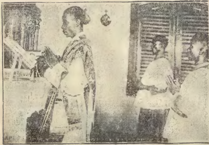
Pierwsza Ofiara Mszy św. odprawiona przez księdza-krajowca w Nigerji.