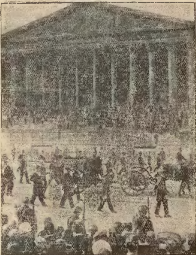
Oto fragment z orszaku pogrzebowego, odwożącego zwłoki francuskiego ministra marynarki wojennej Leyguesa na wieczny spoczynek. Orszak pogrzebowy — jak widzimy na zdjęciu — przechodzi przed gmachem parlamentu.

i jedna czwarta: dillonowska 71; stabilizacyjna 73; warszawska 45; śląska 47.