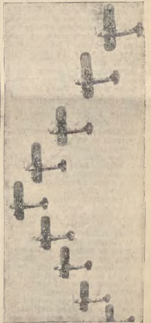
Samoloty myśliwskie w szyku bojowym

Kielce. Wskutek długotrwałych i ulewnych deszczów wszystkie rzeki na terenie woj. kieleckiego znacznie weszły. Narazie nie zachodzi obawa powodzi.