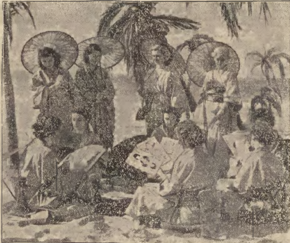
Obrazek ze słonecznej Kaliforniji. — Urocz. „girls” w malowniczych kostjumach japońskich.

GROMADA Rzędna Polska ma jeszcze na sprzedaż parcele budowlane koło Brzuchowic — tania, bo tylko dla Polaków. 15 minut koleja do Lwowa. Dogodne warunki sprzedaży 2.779