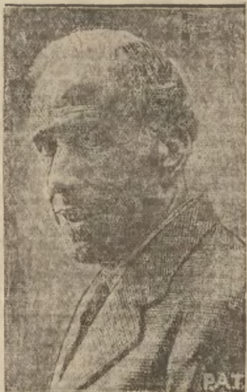
Besteiro, który na pewien czas stracił znaczenie polityczne, został ostatnio obrany 363-ma głosami przeciw 2. prezydentem sejmu hiszpańskiego.