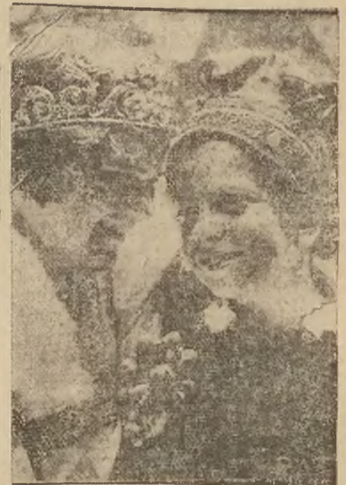
W Chicago odbył się niedawno dziwny konkurs. Nagrodę dostała para dzieci najwięcej obdarzona przez naturę piegami. Zdjęcie przedstawia królową i króla piegowatych w chwili na koronacji.