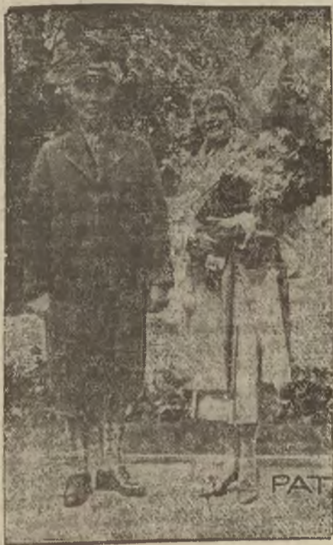
W drodze z Łotwy do Szwajcarii i Paryża, zachowując ścisie incognito, zabrzmał się w Poznaniu prezydent Łotwy p. Kwiesis z małżonką i synami i zwiedził miasto, dłuższy czas przepędzając w pięknym parku Wilsona. Zdjęcie przedstawia prezydenta Kwiesisa z małżonką przed pomnikiem Wilsona w Poznaniu.