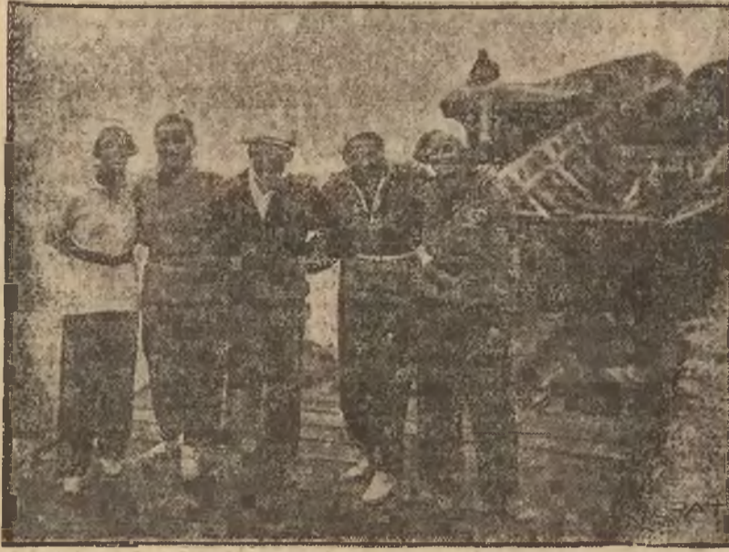
W ubiegłą niedzielę odbyły się na Wiśle Międzyklubowe Regaty Żeglarskie przy udziale 48 łodzi. Na ilustracji naszej widzimy osadę jednej z łodzi, biorącej udział w regatach.