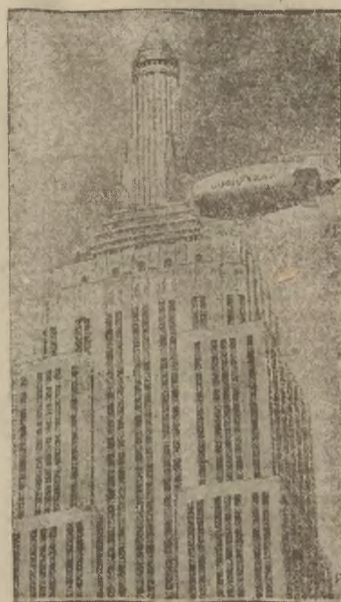
Ilustracja nasza przedstawia system, jakim pomysły dziennikarza amerykańskiego rozwoził po Nowym Jorku pierwszy propagandowy numer swego wydawnictwa.

Najpiękniejsze arcydzieło sławnego malarza można popsuć przez nieodpowiednią oprawę; — wdzięk najpiękniejszej kobiety może się rozwiać przez zaniedbane włosy. Lśniący połysk, elastyczność i świeżość włosów ożywiają wygląd Pani, a regularna pielęgnacja za pomocą szamponu CZARNOGŁÓWKA-EXTRA zapewni Pani świetny wygląd. Do każdej torebki szamponu CZARNOGŁÓWKA-EXTRA dołączony jest proszek „POLYSK DLA WŁOSÓW”, który odświeży i uzdrowi włosy Pani. 4554