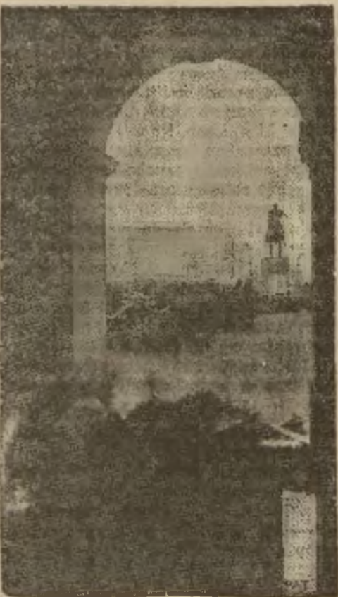
W niedzielę rozpoczęły się obrady Związku Obrony Kresów Zachodnich. Zdjęcie nasze przedstawia złożenie wienca na grobie Nieznanego Żołnierza przez uczestników Zjazdu.