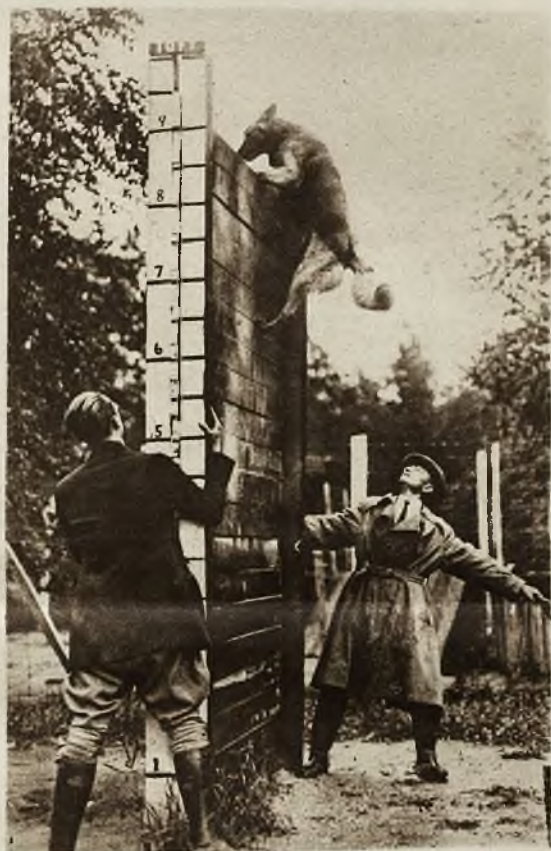
1) Słynna artystka filmowa Gloria Swanson, posiada w swych żyłach krew polską. Dziad jej był emigrantem polskim, który po powstaniu styczniowym wyjechał do Ameryki. 2) Uczestnicy gymkhany motorowej w akademii wojskowej w Camberley (Ang.) defilują przed publicznością. 3) Słynny w Belgii pies policyjny „Moro”, w wspaniałym skoku bierze 3 metrową gładką przeszkodę.