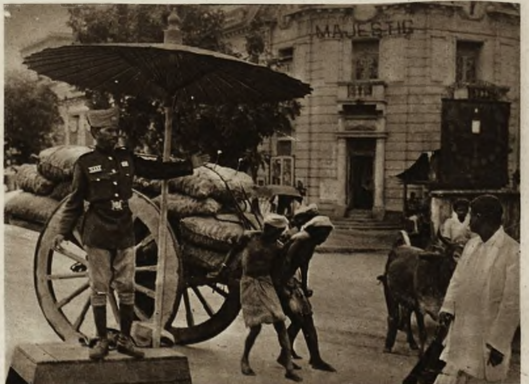
Oryginalny obrazek z Burmy (Indje ang.) Tubylczy policjant pod parasolem, reguluje prymitywny ruch uliczny. Z tyłu widoczny gmach wspaniałego nowoczesnego hotelu. Kontrast jest uderzający