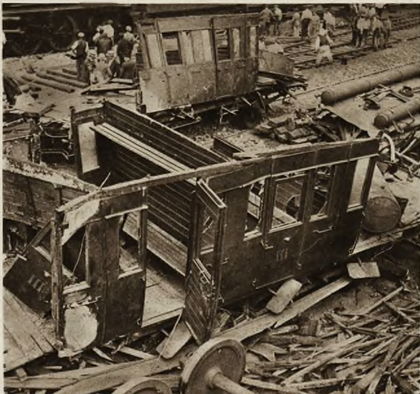
Zdjęcie dokonane po strasznej katastrofie kolejowej na linii Paryż-Boulogne, która pochłonęła wiele zabitych i rannych.