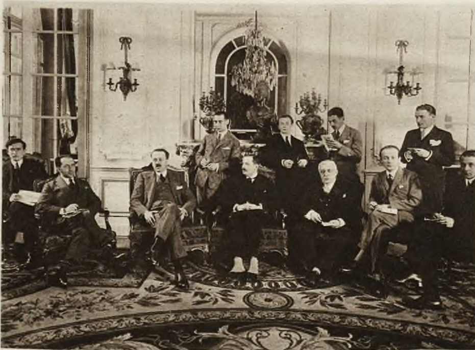
Minister Skrzyński w drodze powrotnej ze Stanów Zjednoczonych przyjmuje w Paryżu w hotelu Ritz reprezentantów prasy polskiej.