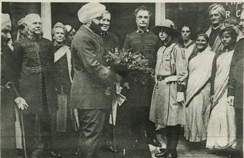
1) Najbogatszy (i) maharadża indyjski z Patiala, który zdobył sławę w Europie tem, że wozi ze sobą największą, znaną dotychczas ilość kufrów i bagaży. Poza tem jest on bardzo dobroczynny i zdjęcie nasze przedstawia go odwiedzającego centralne biuro armji zbawienia w Londynie, na której cele ofiarował poważne sumy. 2) Lolita Lee (naturalnie gwiazda filmowa) jest przeciwniczką obciętych włosów, ale chcąc w inny sposób zwrócić na siebie uwagę, okręca włosy naokoło szyji. 3) Ks. Yorku, drugi syn ang. króla, o którym prasa zagraniczna rozpuszczała wiadomości, że stara się o tron polski. (Wiadomości te złożyć należy na karb ogórkowego sezonu).