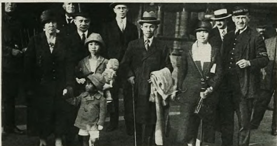
Książę siamski Demres przybył z rodziną do Europy, gdzie obejmie godność posła siamskiego w Berlinie.