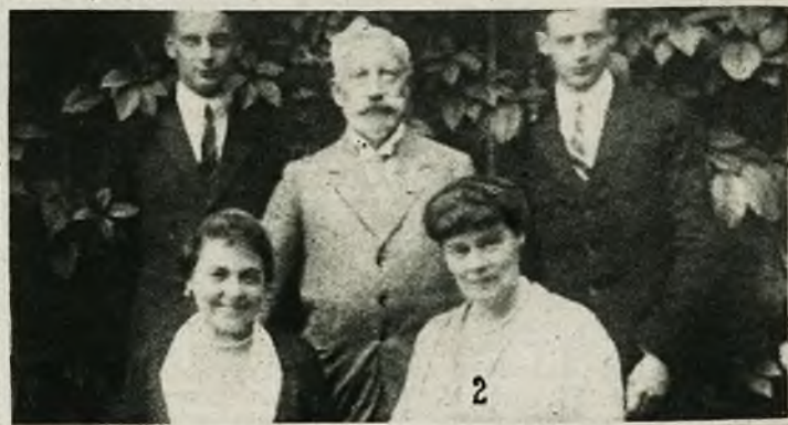
1) Wspaniały okaz wieloryba, schwytanego w okolicach Alaski. 2) Nasz stary „miły” znajomy „Kaiser” Wilhelm w otoczeniu rodziny w Dorn.