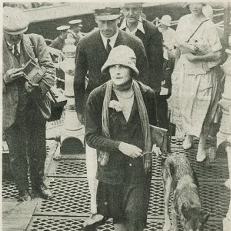
Lord i Lady Louis Mountbatten po swem zwycięstwie w wyścigach jachtów motorowych, opuszczają port w Bournemouth. Para ta uchodzi za najelegantszą w Londynie a lord Mountbatten, który dawniej nazywał się Battenberg, jest najlepszym przyjacielem następcy tronu.