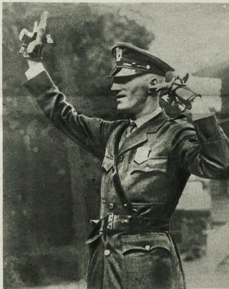
W Bostonie policjanci, regulujący ruch uliczny zaopatrzeni są w lampki sygnałowe, które noszą na rękach.