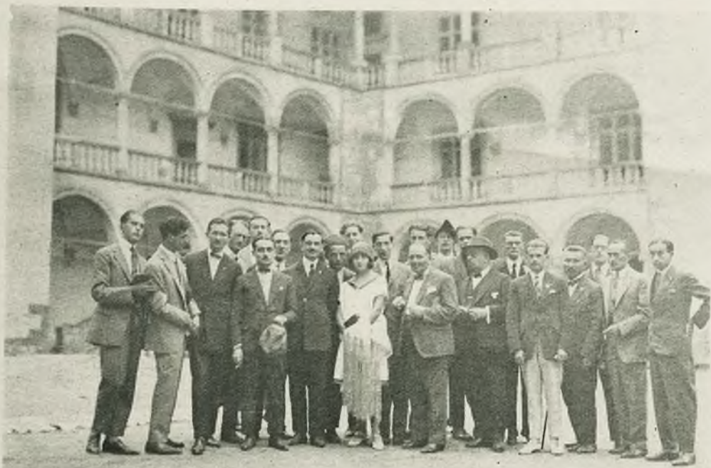
W Polsce bawi obecnie wycieczka studentów włoskich. Zdjęcie nasze przedstawia ich na dziedzińcu arkadowym Wawelu.