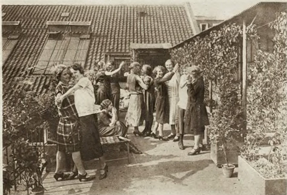
Praca i wypoczynek. Jak starają się zagranicą chlebodawcy o swój personal? Ogród na dachu 10-piętrowego bazaru handlowego w Berlinie. Na pierwszym zdjęciu widzimy panny, zajęte w bazarze, podczas przerwy w pracy wypoczywające na leżakach. Na drugim, personal po pracy zaimportował sobie dancing w promieniach słońca w oryginalnym ogrodzie na dachu.