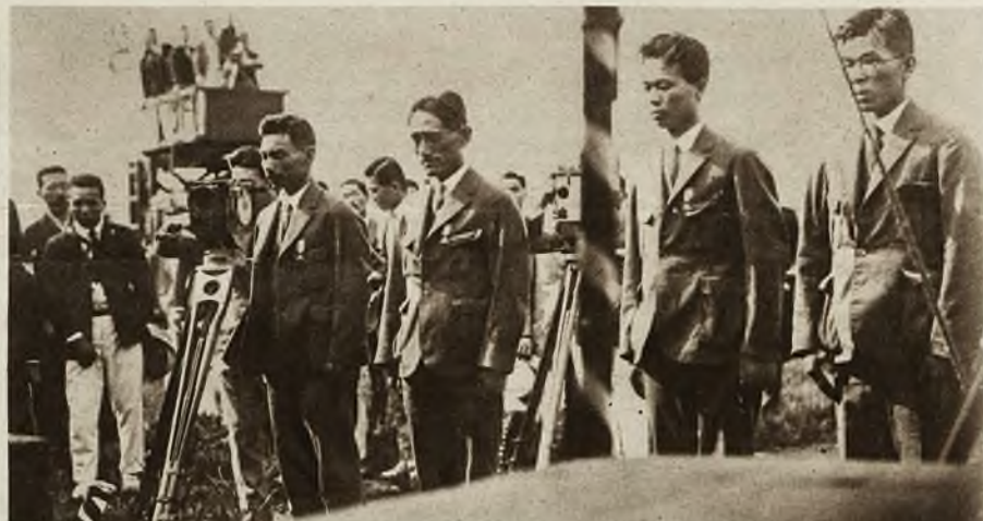
Zdjęcia z współczesnej Japonji. 1) Pływalnia w Tokio. 2) Lotnicy Japońscy podczas raidu Tokio—Paryż, po przybyciu do Moskwy.