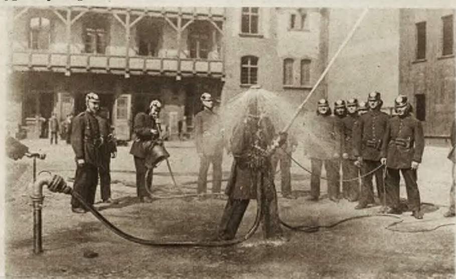
1) Olbrzymia kolej łańcuchowa, w jednej z górnośląskich kopalń węgla, transportująca węgiel z kopalni do magazynów kolejowych. 2) Nowo wynaleziony dla strażaków aparat ochronny przeciw dymowi, ze skrapiaczem. Grosz