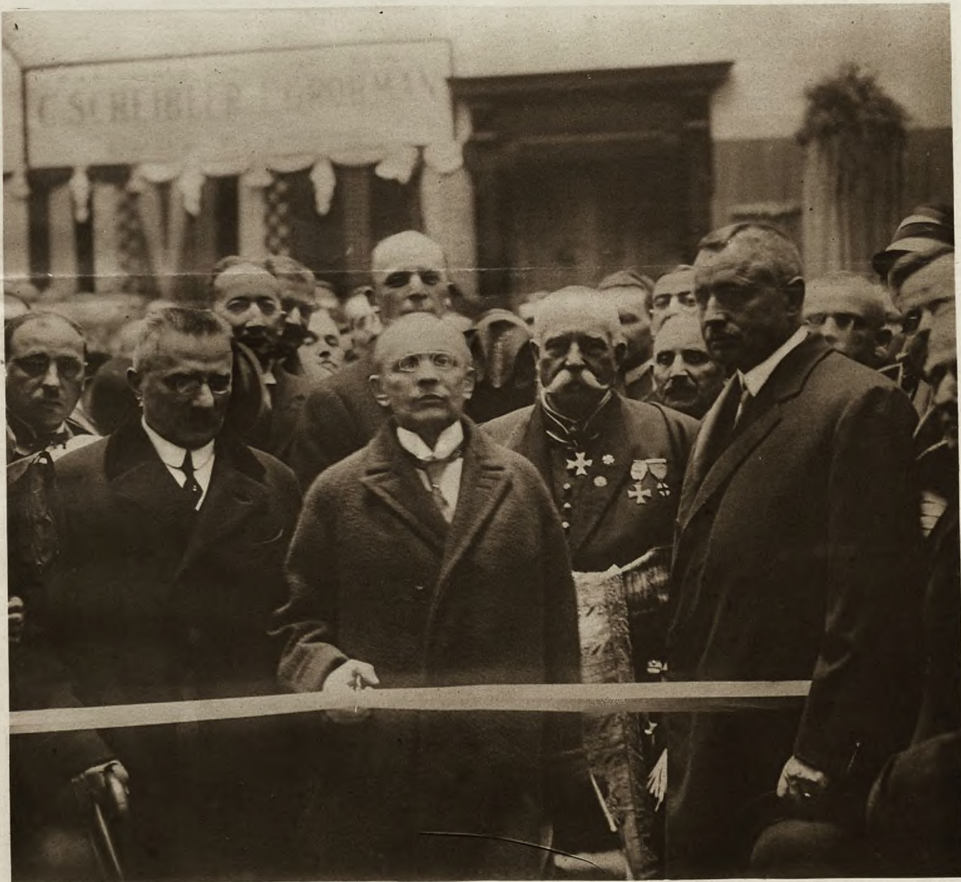
Minister przemysłu i handlu dr Klarner, przecina biało-czerwoną wstęgę i otwiera wystawę.