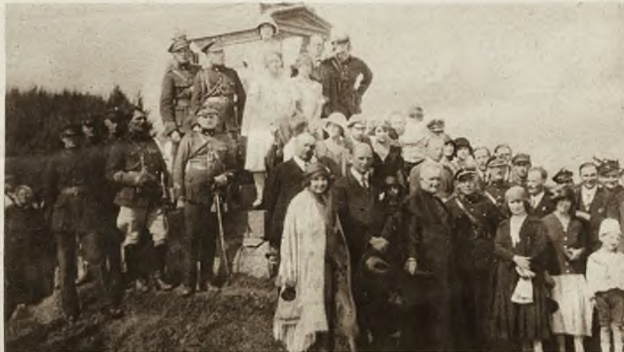
Ag. Fot. Propaganda