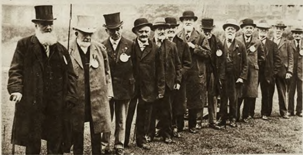
1) „Majestic” największy parowiec transatlantycki linii „White Star Line” (56.000 ton) wprowadzony przez 2 pilotów do portu w Southampton po przebyciu bardzo ciężkiej 24 godzinnej burzy na oceanie. 2) Groteskowa grupa z starego Londynu: 13 weteranów, dorożkarzy, z których każdy odznacza się tym, że przewoził podczas swej fiakerkiej kariery króla angielskiego lub następcę tronu.