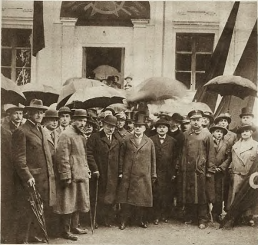
Przed pawilonem bolszewickim.

Dnia 6 września nastąpiło uroczyste otwarcie V. Targów Wschodnich we Lwowie w obecności licznych przedstawicieli Rządu, Sejmu, Senatu, Wojskowości i dyplomacji zagranicznej.