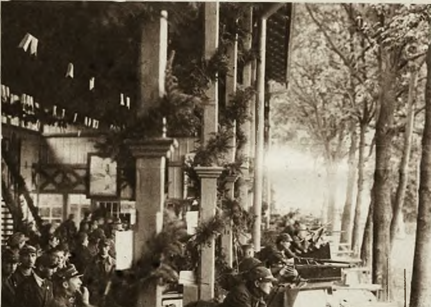
II. Narodowe zawody strzeleckie w Krakowie na Woli Justowskiej. Strzelanie z karabinów.