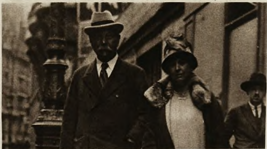
W Paryżu obraduje obecnie międzynarodowy kongres spirytystów przy niezwykle licznych udziałach delegatów. Górne zdjęcie przedstawia kilka ciekawych typów zjazdu. Na dolnym widzimy przewodniczącego kongresu, słynnego twórcę Sherlocka Holmesa, sir Arthura Conan Doyle'a, który jest obecnie jednym z najwybitniejszych badaczy spirytyzmu. Jego znakomite dzieło o spirytyzmie p. t.: „The new revelation” wyszło teraz w przekładzie polskim p. t. „Nowe Objawienie”.