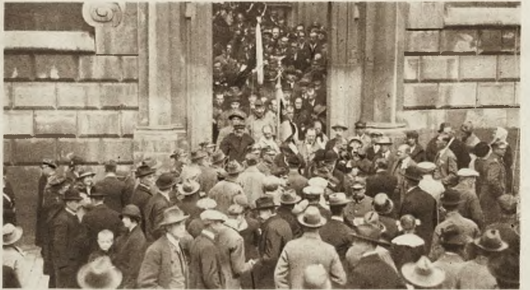
Kraków obchodził ostatniej niedzieli podniosłą uroczystość poświęcenia sztandaru Inwalidów Ziemi krakowskiej. Zdjęcie nasze przedstawia fragment pochodu przy wyjściu z kaplicy Zygmuntowskiej na Wawelu.