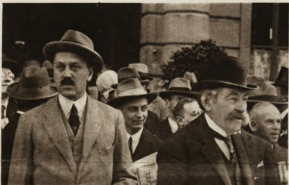
Zdjęcia nasze przedstawiają kilka ciekawych momentów z obecnej sesji Ligi narodów w Genewie. Pierwsze zdjęcie przedstawia uroczyste otwarcie pierwszego posiedzenia przez franc. prez. ministrów Painleve. Na drugim widzimy słynnego podróżnika i badacza okolic podbiegunowych Nansena, delegata Szwecji. Na trzecim widzimy grupę najwybitniejszych dyplomatów, stojących przed gmachem Ligi. Od lewej stoją: Briand, franc. min. spr. zagr., Chamberlain (Anglja), Hymans (Belgja), Benesz (Czechosłowacja) i Painleve. Na ostatnim wychodzą z posiedzenia Skrzyński i Briand.