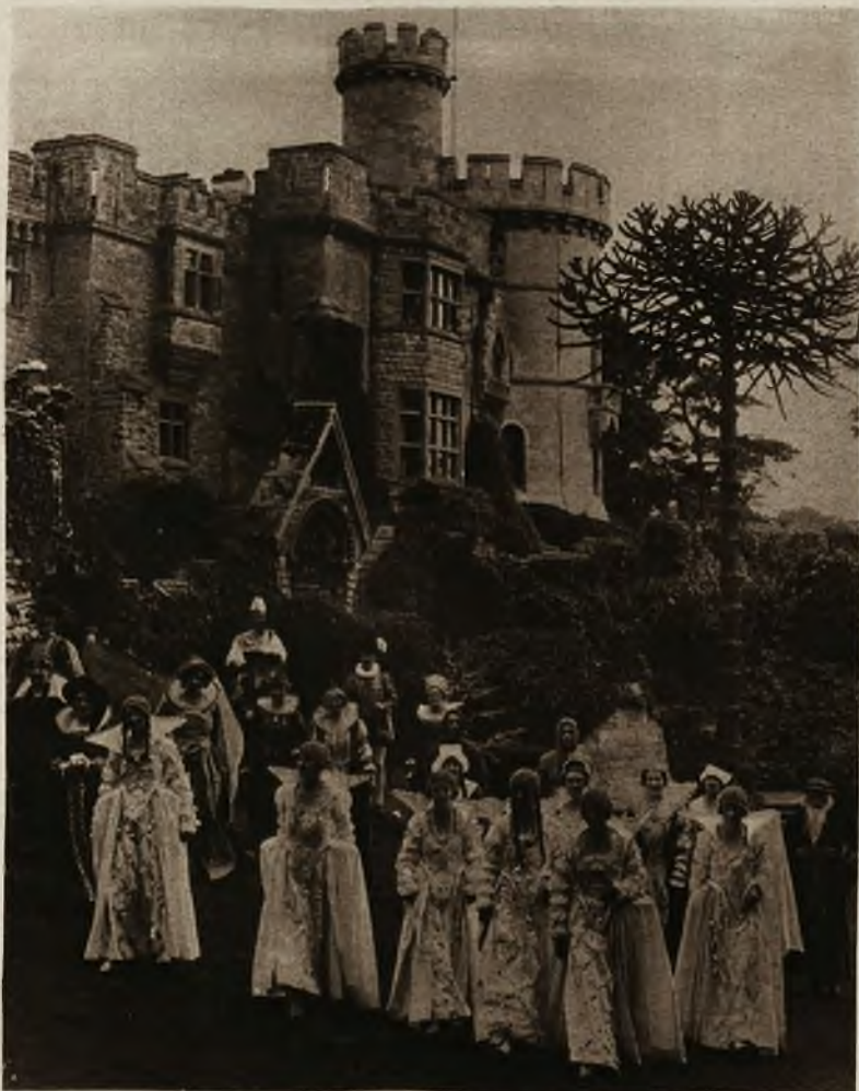
Ciekawe zdjęcie z tak popularnych w Anglii „pageant” tj. obrazów historycznych odtwarzanych na tle starych zabytków. Obraz nasz przedstawia dwór jednego z Tudorów, przed zamkiem Devizes w Wiltshire, pochodzącym z XIV w.