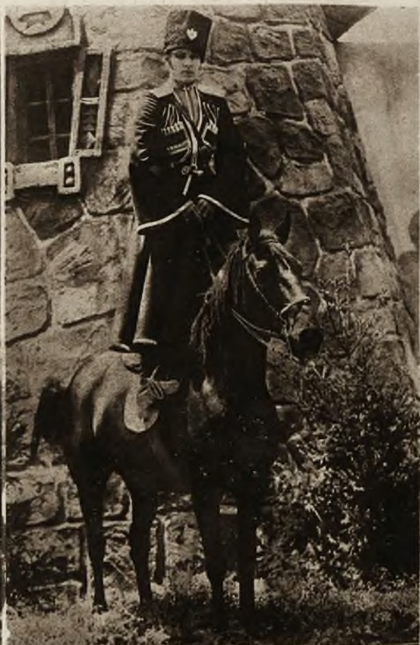
1) Przy robotach wodociągowych koło świątyni Karnak w Egipcie, wykopano nadzwyczaj ciekawą statucę faraona Achnatona, teścia Tutankhamena. Zwrócić należy uwagę na ciekawe traktowanie rzeźby rysów twarzy, które przypomina zupełnie modernistyczną sztukę. 2) Słabnąca już epidemia zagadek krzyżkowych zdaje się znowu podnosić głowę, jak wskazuje na to nasza fotografia, która pochodzi naturalnie z Ameryki. 3) „Najpiękniejszy” z aktorów filmowych słynny Rudolf Valentino, w swej najnowszej kreacji oficera Czerkiesów, w wspaniałym filmie Zrzeszenia artystów amerykańskich.