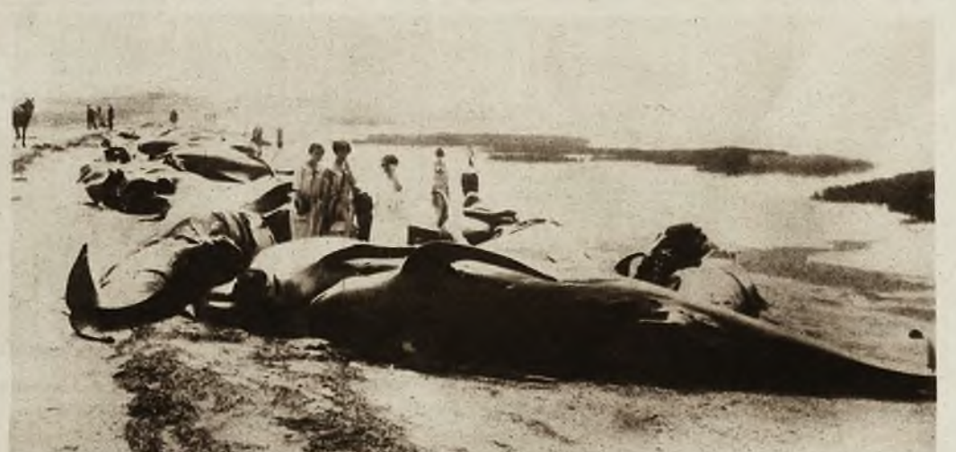
Na północnych wybrzeżach Kanady zdarzył się rzadki wypadek. Gwałtowna burza morską wyrzuciła na brzeg około 100 wielorybów. Jedna taka sztuka waży przeciętnie 3000 kg.