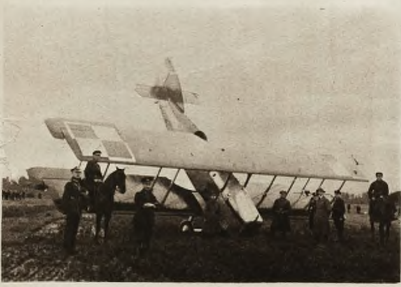
Widok aparatu uszkodzonego przy lądowaniu w nowo otwartym parku lotniczym L. O. P. P. w Łodzi.