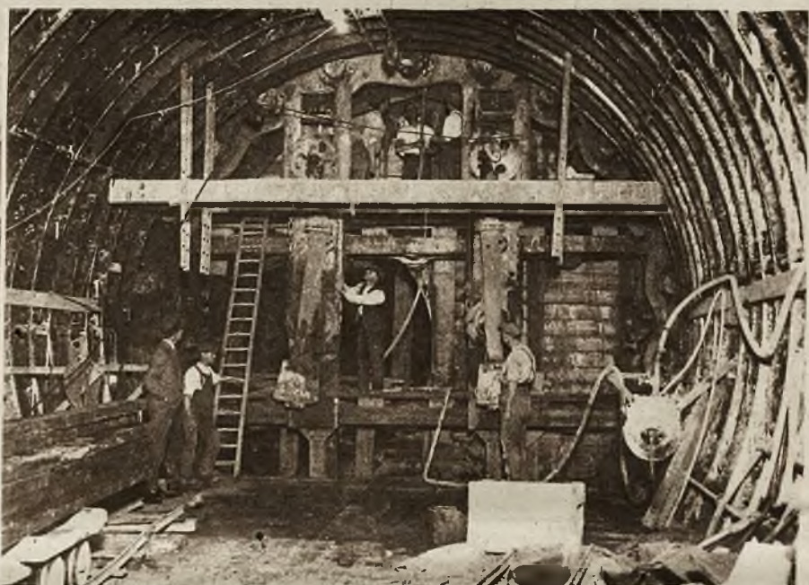
Bawiący w Europie Indianie szczepu „Sioux” zwiedzają w Berlinie lotnisko i z zaciękwieniem oglądają aparaty pasażerskie Junkersa. 2) Nadzwyczaj ciekawe zdjęcia z budowy kolei podziemnej t. zw. „tube” pod Tamizą w Londynie. Jest to najgłębiej w ziemi położona kolej w okrągłych tubach i osiągająca największą szybkość (200 klm na godzinę).