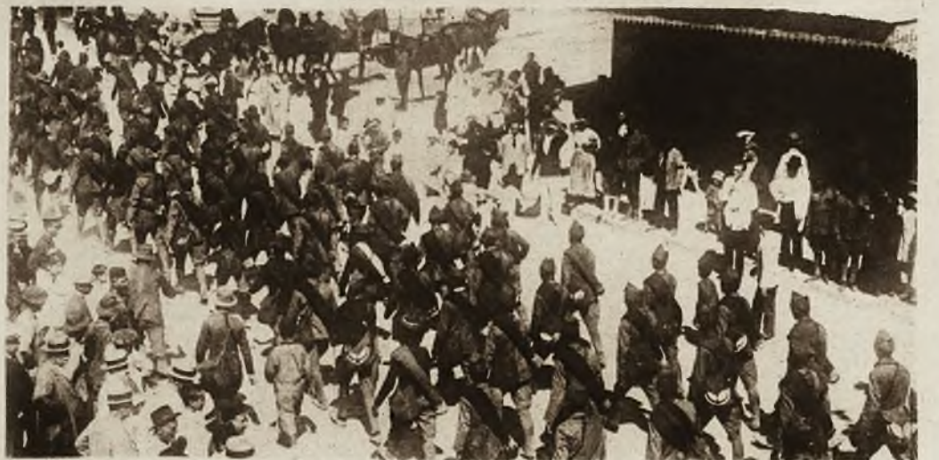
Wojska hiszpańskie, biorące udział w wojnie z Riffami, wkraczają do Alhucemas.