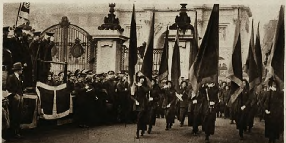
Słynna ang. „Armja Zbawienia” obchodzi teraz jubileusz swego powstania. Gen. Both, twórca armji, czyni przegląd w Hyde Park'u w Londynie.