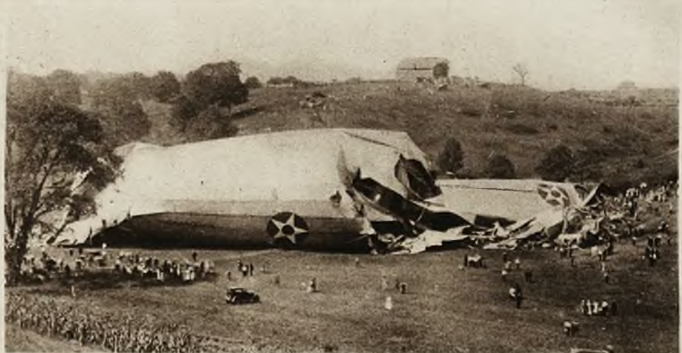
Ciekawe zdjęcie z katastrofy największego okrętu powietrznego Ameryki „Shenandoah”.