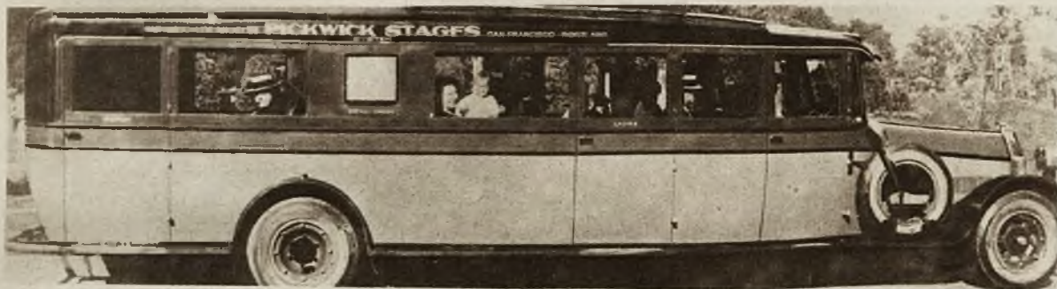
Między Los Angeles i San Francisco kursuje pierwszy wielki wagon samochodowy. Wóz ten zaopatrzone jest w jadalnię, łazienkę, oddział dla pań, dla palących etc.