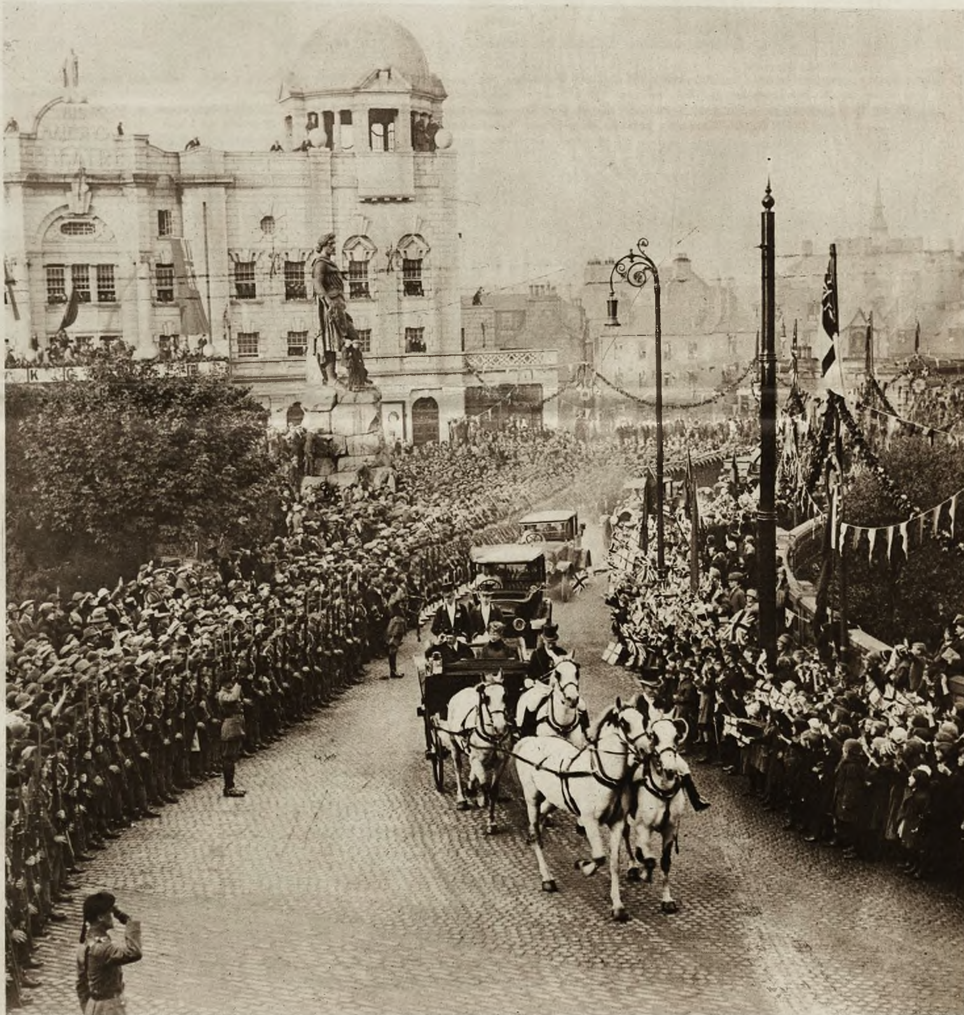
Król angielski Jerzy V. wraz z małżonką przyjechali do Aberdeen, gdzie wzięli udział w otwarciu miejskiej Galerji Sztuki. Królewska para była entuzjastycznie przyjmowana. Zdjęcie nasze przedstawia wspaniały moment z tej uroczystości. Na lewo widoczna fasada teatru „His Majestys“.