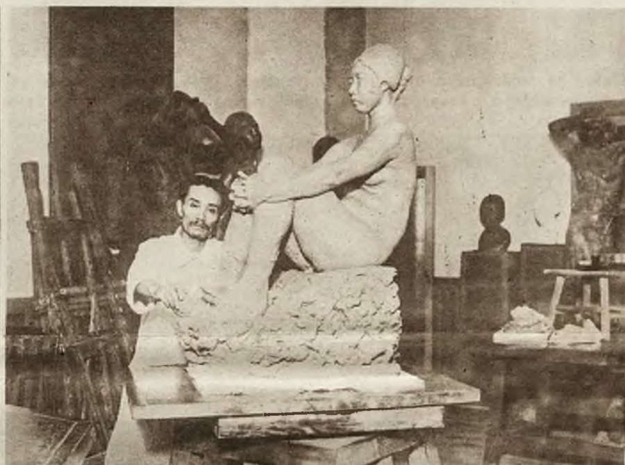
1) W Berlinie urządzono obecnie wystawę konkursową urządzeń ogrodowych. Obraz nasz przedstawia jeden z nagrodzonych fragmentów tej wystawy. — 2) Ze współczesnej sztuki japońskiej. Jeden z najwybitniejszych rzeźbiarzy japońskich Daimu w swej pracowni, obok dzieła „Marząca dziewczę”.