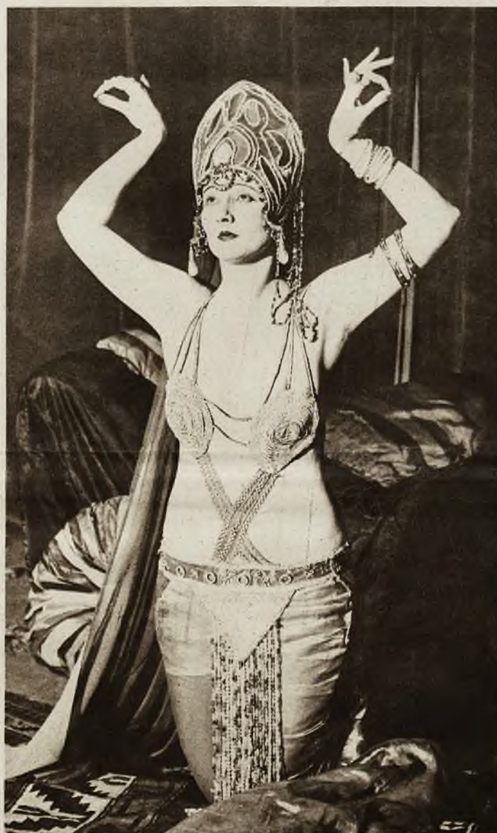
Słynna artystka filmowa Betty Blythe, znana w Polsce z filmów „Królowa Saba” i „O czym marzą kobiety”, bawi obecnie w Londynie, gdzie kreować będzie główną rolę w filmie „Chu Chin Chow”.