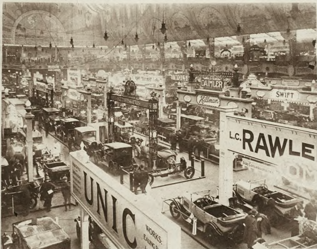
Dnia 1-go października otworzono w Londynie 19-tą międzynarodową wystawę samochodów i motorów. Zdjęcie nasze przedstawia widok ogólny na główną halę wystawową w Olympia Hall.