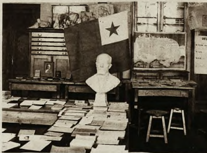
W krakowskim muzeum przemysłowym otwarto wystawę esperancką. Na wystawie odbywają się próbne lekcje, mające zobrazować łatwość tego języka.