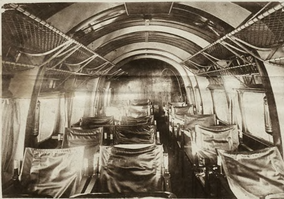
Wnętrze luksusowej kabiny w samolocie pasażerskim, kursującym między Londynem i Paryżem. Kabina mieści 22 osób i zawiera także bufet. Ruch lotniczy na tej linii popularyzuje się tak, że zaczyna go już odczuwać dotkliwie ruch morski.