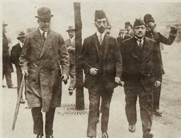
Król Iraku, Feisal, który jest pionkiem w rękach Anglików, zwiedza obecnie Europę.