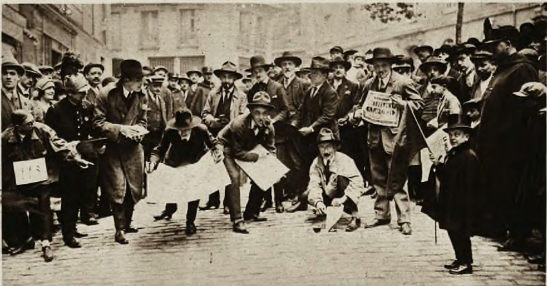
Święto artystów na Montmartre. Oryginalne zawody sportowe. W zawodach biorą udział malarze, poeci i pisarze, którzy mają przebiegnąć pewną przestrzeń i w międzyczasie wymalować obraz, względnie napisać jakiś utwór. Zwycięzcą zostaje twórca najlepszego dzieła, o ile przyszedł pierwszy do mety.