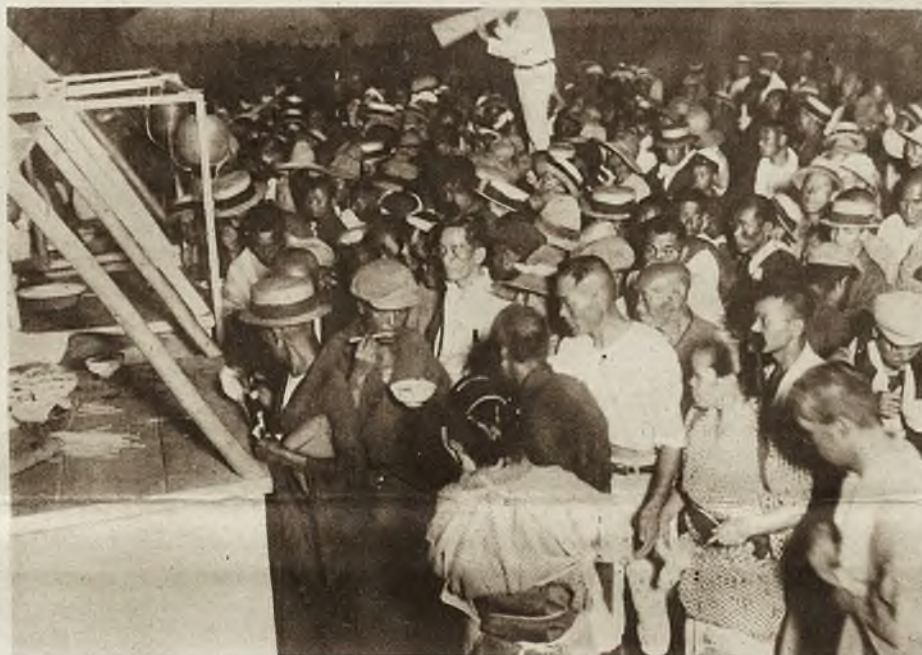
Bezrobotni w Japonii otrzymują bezpłatne posiłki w publicznych kuchniach. Urzędnik zapomocą megafonu kieruje akcją. Ciekawe są pałeczki, którymi Japończycy posiłkują się przy jedzeniu.