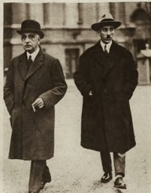
Konflikt grecko-bułgarski: Minister Karpinos X, delegat Grecji do Ligi Narodów, opuszcza gmach Ligi w Genewie.