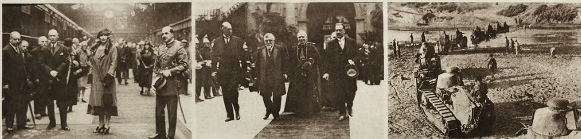
1) Przyjęcie królowej hiszpańskiej na Gare du Nord w Paryżu. — 2) Kardynał paryski Dubois, zjednął sobie sympatię wszystkich eleganckich Paryżanek albowiem oświadczył ostatnio, że nie jest przeciwnikiem mody krótkich sukien, włosów i dekoltów, które uważa za praktyczne i odpowiadające dzisiejszym stosunkom życiowym. — 3) Oddział lekkich wozów pancernych armji francuskiej, w drodze na front w Marokku, przebywa wśród rzekę.