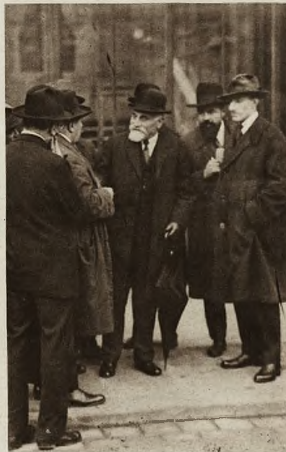
Z przesilenia gabinetowego we Francji. Mr. Doumergue, prezydent Rzplitej francuskiej, opuszcza po obradach swe mieszkanie w pałacu elizejskim.