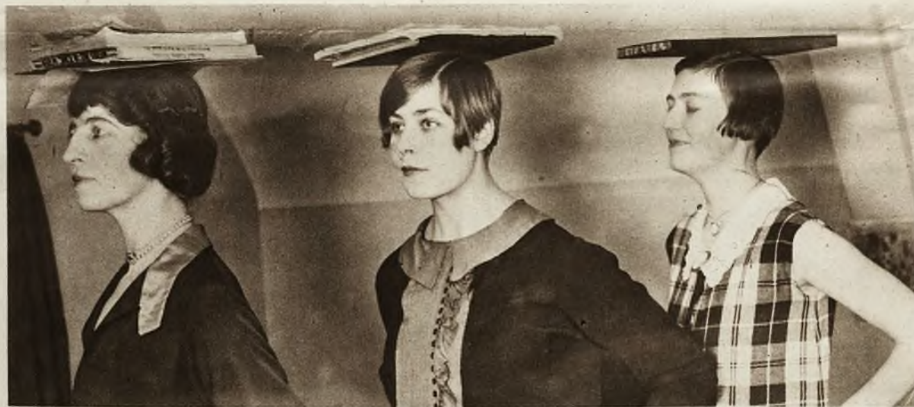
Nie jest to tak łatwo zostać manekinem krawieckim. W Londynie założono nawet specjalną w tym celu akademję. Na zdjęciu naszym widzimy adeptki tej szkoły, jak ćwiczą odpowiednie trzymanie głowy. Każdy ruch ciała używany przy demonstrowaniu toalet, musi być długo i mozolnie ćwiczony. Niektóre ćwiczenia odbywają się nawet przy gramofonie.