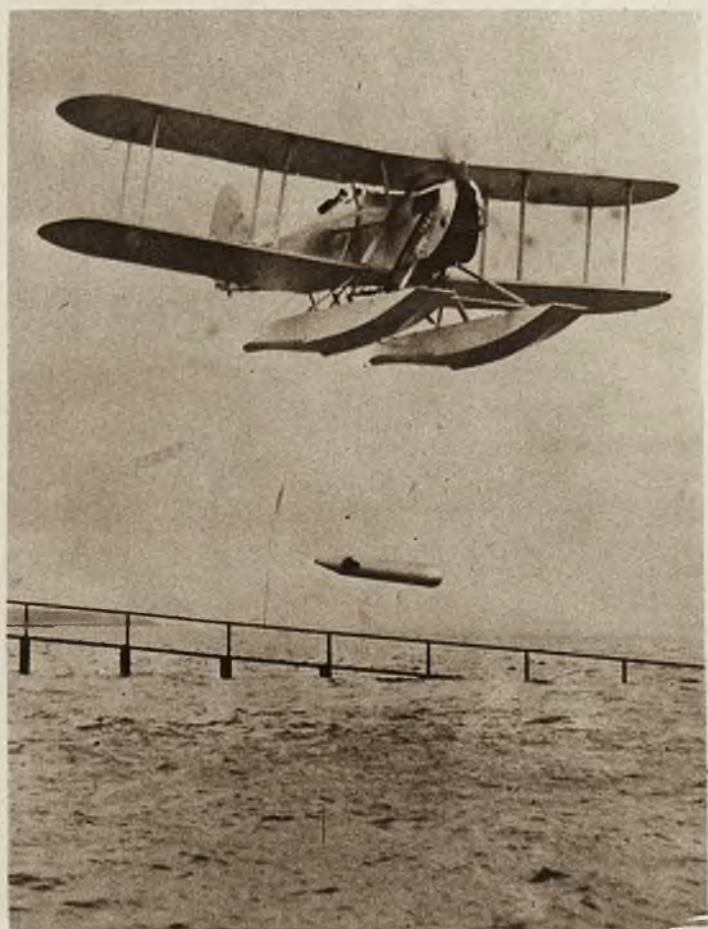
Pierwszy torpedowiec powietrzny. Na zdjęciu widzimy torpedę rzuconą przez hydroplan, której siła wystarcza do wysadzenia w powietrze największego okrętu wojennego.