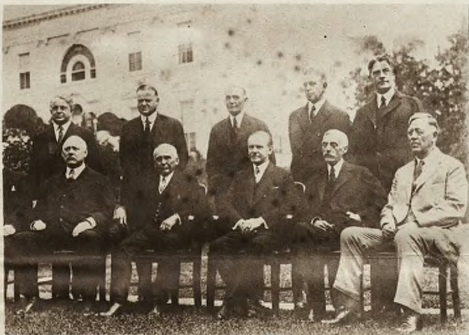
Obraz nasz przedstawia pierwsze wspólne zdjęcie całego gabinetu Stanów Zjednoczonych z prezydentem Coolidge. Ludzi ci faktycznie rządzą nie tylko Ameryką, ale całym światem.