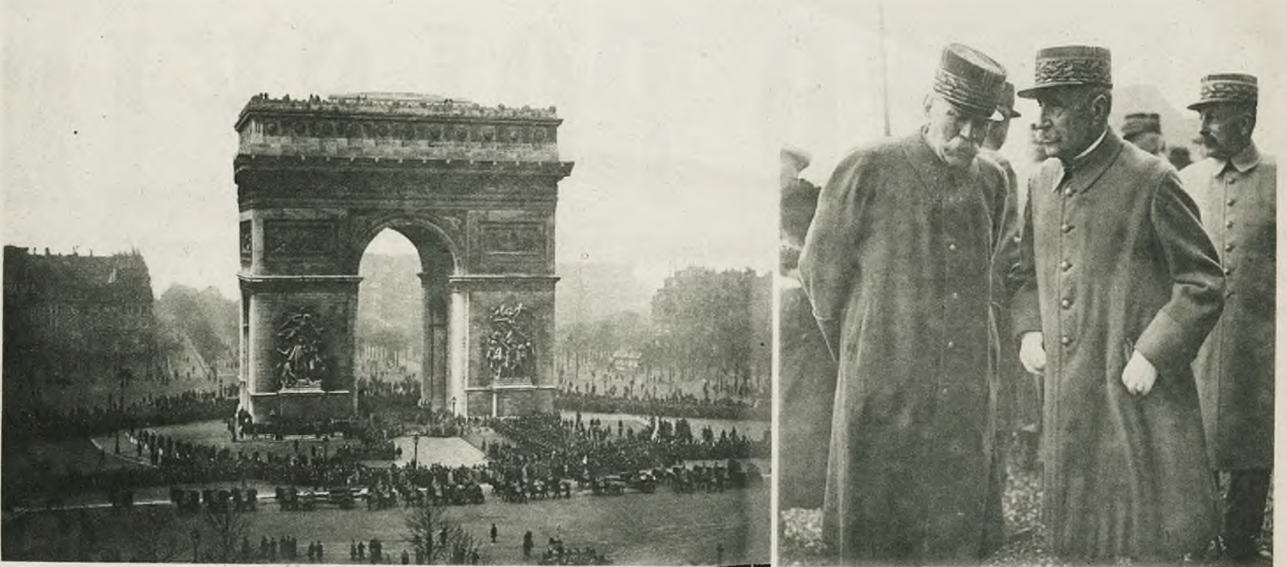
Siedmioletnią rocznicę zawieszenia broni obchodzono również uroczystości w Paryżu. Na lewo widoczna defilada wojsk przed grobem Nieznanego Żołnierza, znajdującym się pod Łukiem Triumfalnym, na prawo bohaterowie Wielkiej Wojny Joffre i Foch.