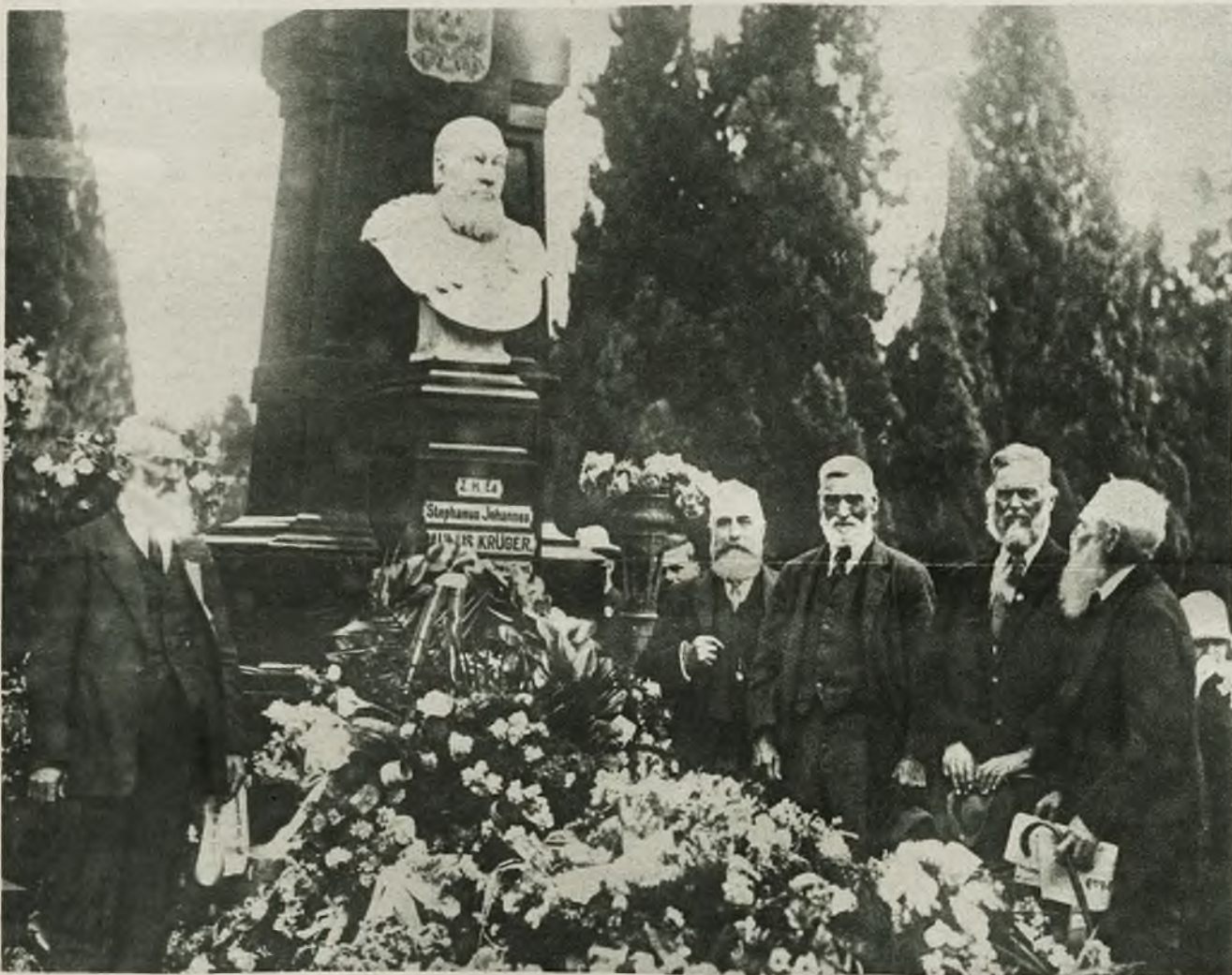
W pold. Afryce obchodzono obecnie urocznicę 100-letnią rocznicę urodzin Pawła Krügera, pierwszego prezydenta Transvaalu, bohatera wojny Burów z Anglikami. Na grobie jego w Pretorji koledzy i towarzysze Krügera z czasów wojny złożyli wieńce i kwiaty.