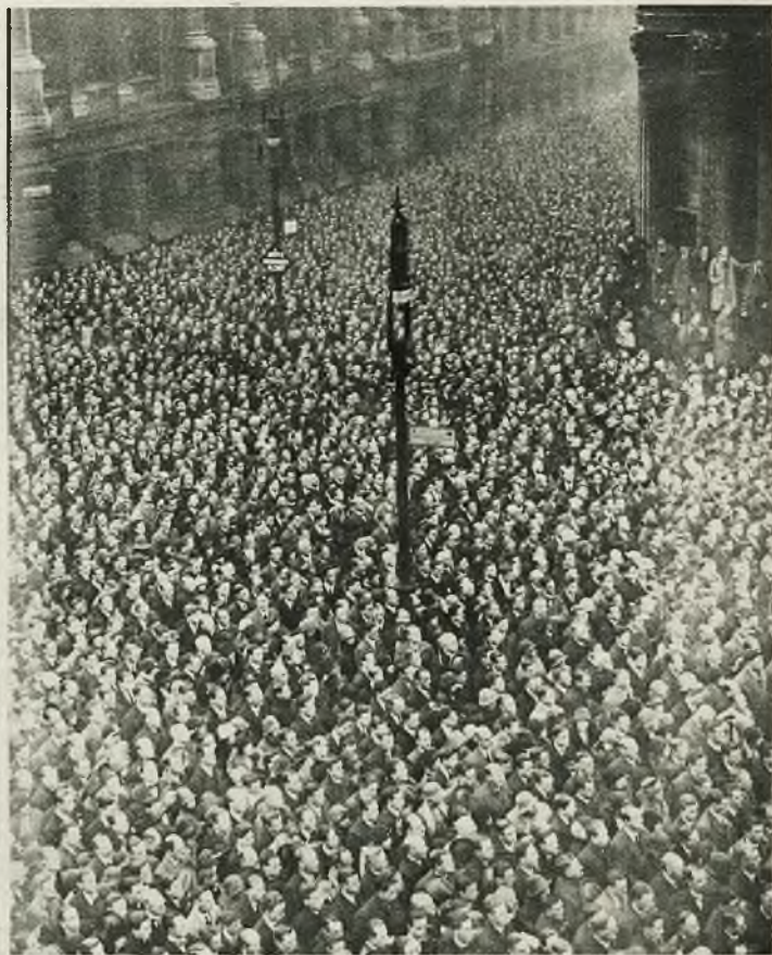
Siedmioletnią rocznicę zawieszenia broni obchodził Londyn 2-minutowym powszechnym milczeniem. Zdjęcia nasze przedstawiają uroczystości przed grobem Nieznanego Żołnierza, oraz moment z centrum miasta, przed Bankiem Angielskim.