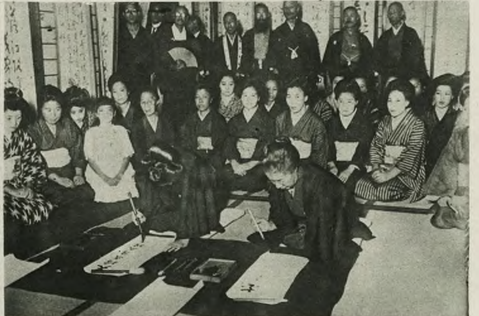
Obrazki z Japonji. 1) Poświęcenie nowego mostu w Osaka. Pierwsi przechodnie stanowili 3 generacje tej samej rodziny, potem przeszli przedstawiciele władzy a dopiero potem most został oddany do użytku publicznego. 2) Zdjęcie nasze przedstawia konkurs kaligraficzny w Tokio. Sztuka pisanja po japońsku jest bez porównania trudniejsza niż u nas. Odbywa się ona zapomocą szerokiego pędzelka i tuszu.