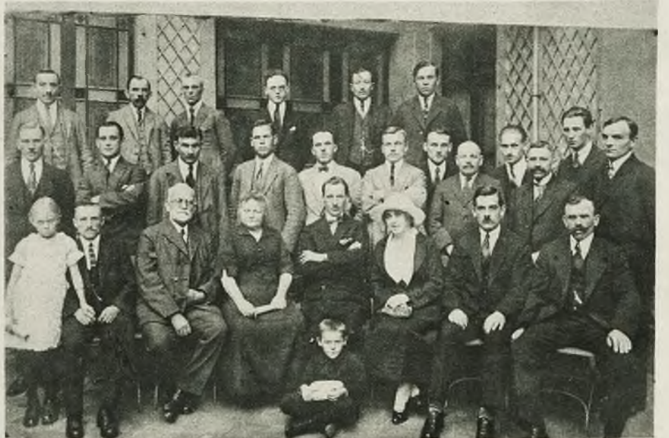
1) Z sensacyjnego procesu Bajot-Daudet. Komisarz policji Colombo oskarżony przez Daudeta o współudział w zamordowaniu jego syna, składa w sądzie zeznania. 2) Z życia wychodźstwa polskiego we Francji. Koło robotników polskich w Strassburgu.