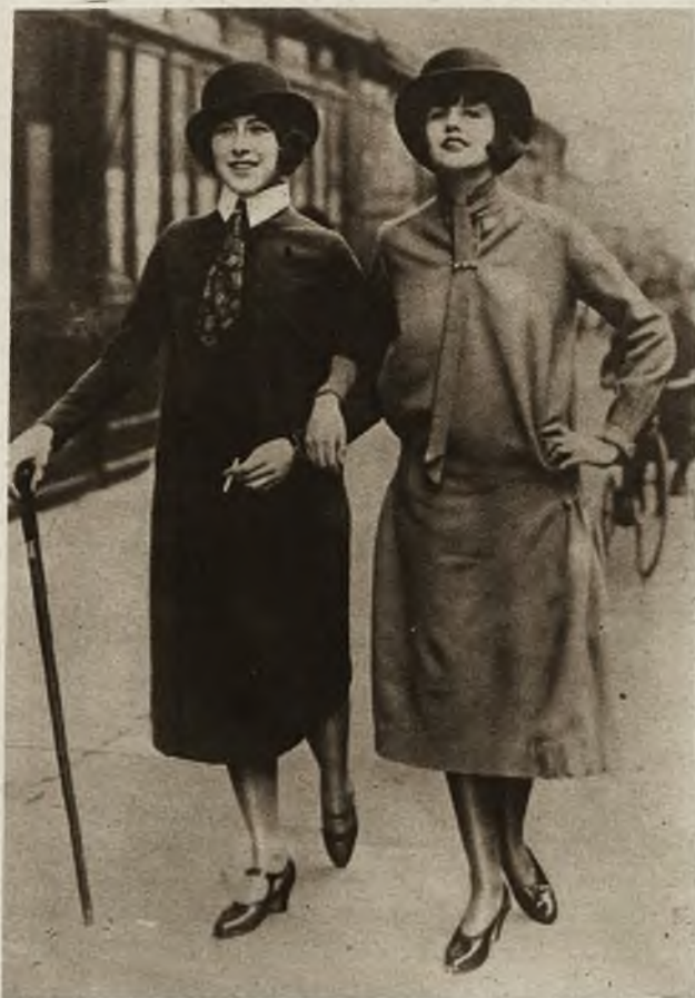
Najmodniejszy kapelusz damski, który prawie w niczem nie różni się od męskiego.