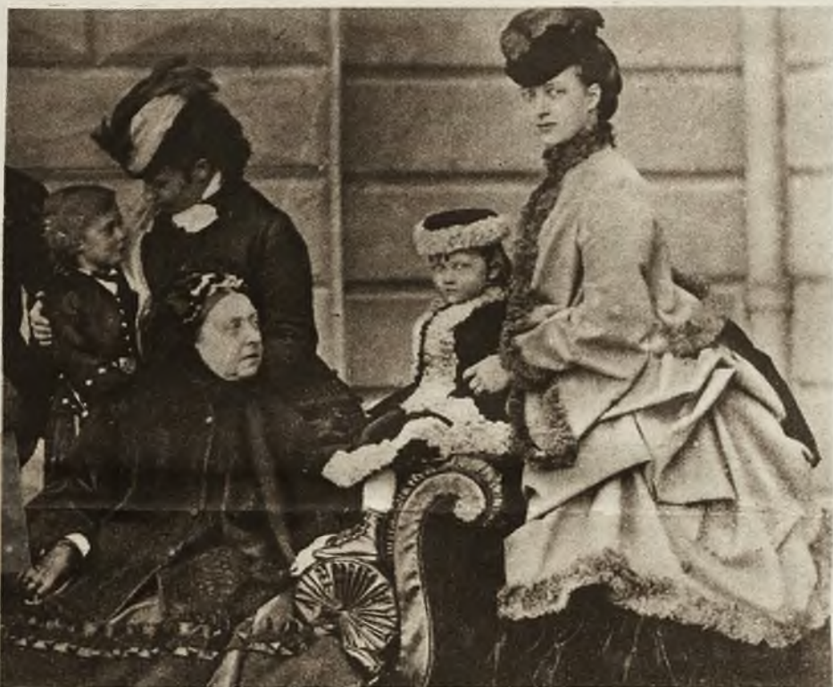
Historyczne zdjęcie. Portret zmarłej obecnie królowej Aleksandry (na prawo) gdy miała lat 16. W fotelu siedzi królowa Wiktorja.