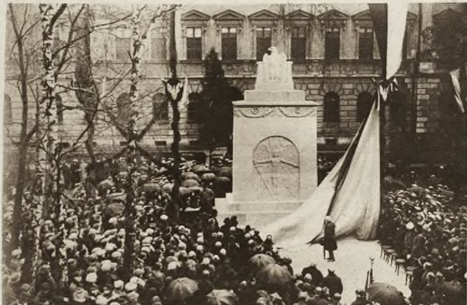
W niedzielę 22 z. m. odbyło się we Lwowie odsłonięcie pomnika „Orląt“, koło Politechniki, w miejscu gdzie był pierwszy cmentarzyk obrońców Lwowa, w roku 1918.