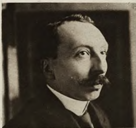
Leon Berard, został wybrany członkiem francuskiej Akademii Umiejętności w miejsce Anatola France'a.