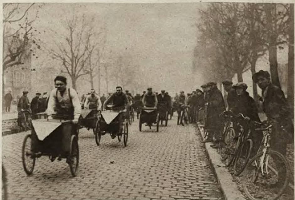
W Paryżu odbyły się wyścigi rowerów transportowych, którymi rozwozi się pieczywo. Wyścigi te cieszyły się wielkim powodzeniem i olbrzymią ilością uczestników.