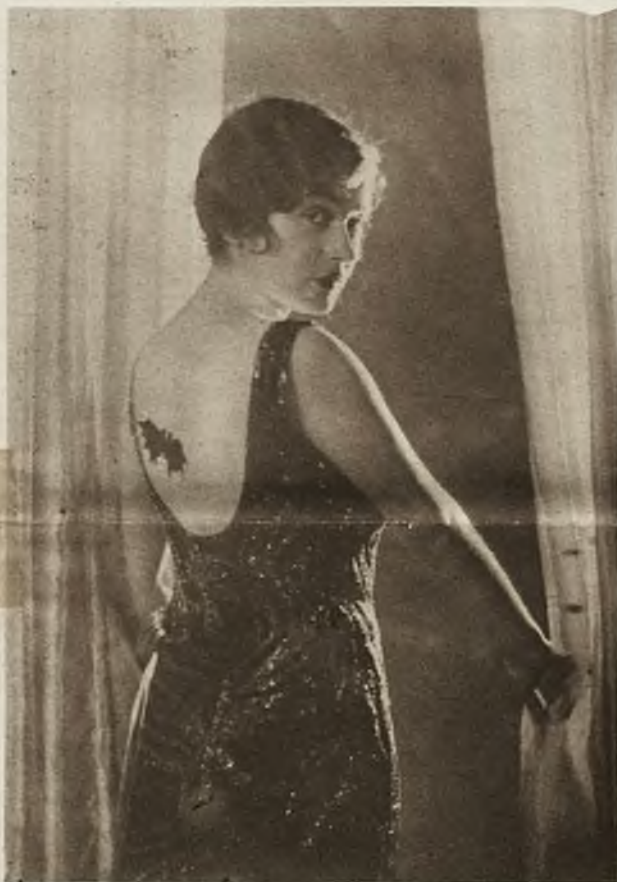
Nowy wybryk mody. Pewna ekscentryczna dama, wpadła na imponujący pomysł wymalowania sobie na plecach podobizny swego ulubionego nietoperza. Coprawda niezrozumiałe jest dlaczego na plecach.