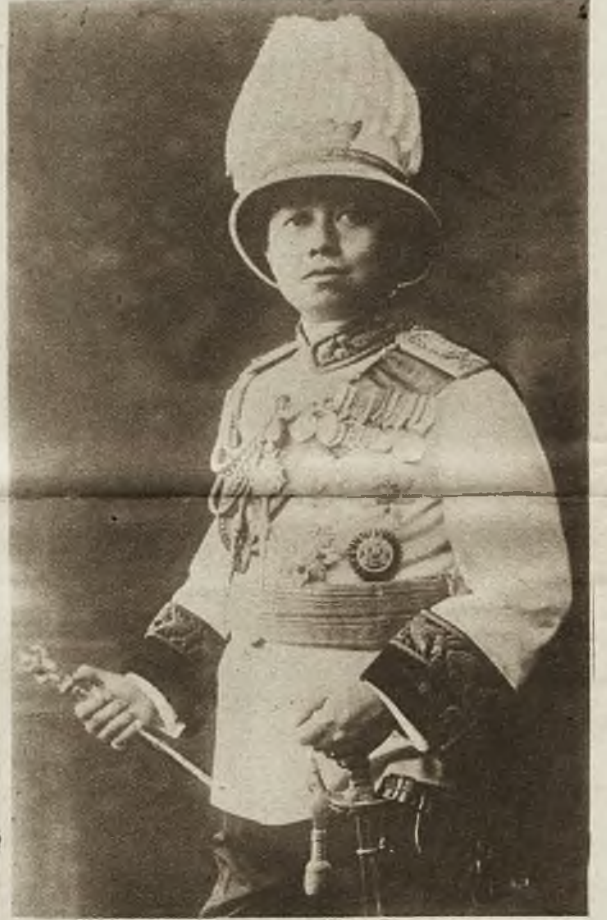
1) Zatopiona angielska łódź podwodna M. 1. leży tak głęboko, że chcąc się do niej dostać, trzeba było zbudować specjalny aparat nurkowy, wytrzymały na wielkie ciśnienie wody. — 2) Książę Walji (w środku) na nabożeństwie żałobnym za zmarłą królową Aleksandrę w katedrze londyńskiej. — 3) Portret zmarłego obecnie króla Siamu. Królem proklamowany został brat jego ks. Sukadaya.