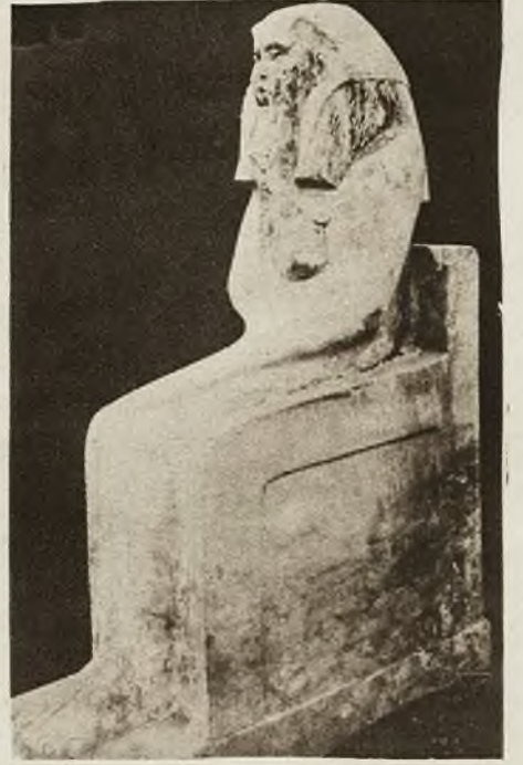
Ekspedycja naukowa uniwersytetu w Harvard, pracująca około wielkich piramid w pobliżu Gizeh, odkryła nowe, ciekawe wykopiska. Zdjęcie nasze, dokonane ze szczytu piramidy Cheopsa, przedstawia pole cmentarne 6-tej dynastji, pochodzące z okresu 3000 lat przed Chr. Z tyłu widoczne miasto Gizeh. Znalaziona tamże statua siedząca, swą niezwykłą formą, dowodzi swego starożytnego pochodzenia.