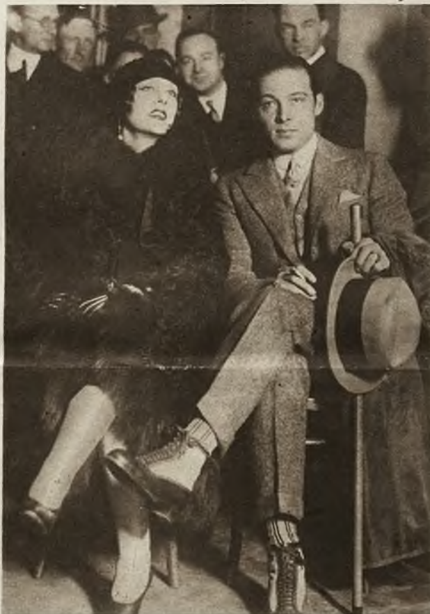
Słynne gwiazdy filmowe Olga Petrova i Rudolf Valentino, jako świadkowie w pewnym sensacyjnym procesie w Hollywood, które tam są na porządku dziennym.