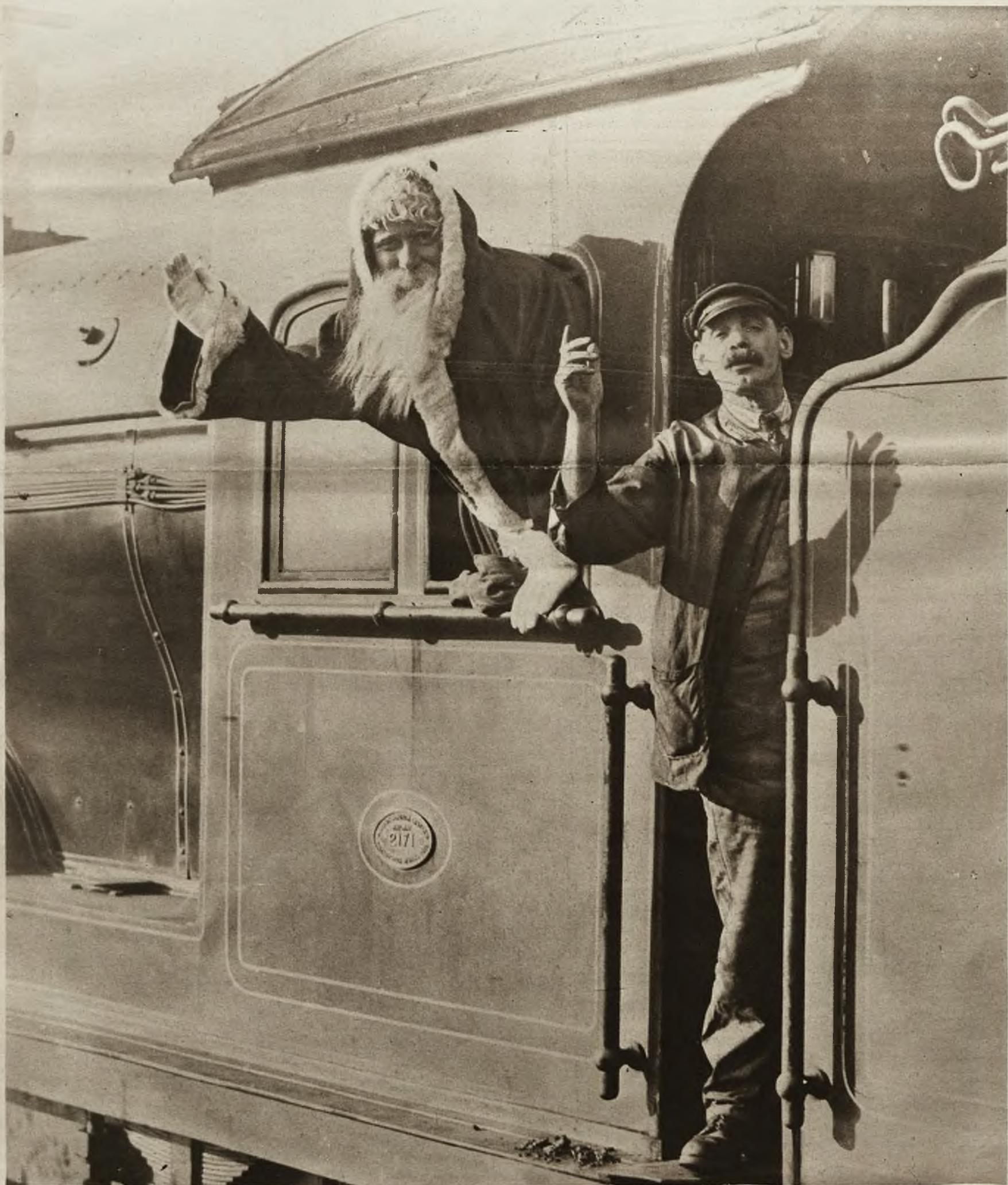
Nawet św. Mikołaj musiał się zmodernizować i zastosować do nowoczesnych środków komunikacji. Podobno namawiano go do aeroplanu, ale staruszek nie mógł się zdecydować i w tym roku przyjeżdża na olbrzymim parowozie, który ciągnie cały pociąg najrozmaitszych darów.