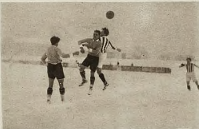
Zawody ostatniej niedzieli, stały pod znakiem zimy. Moment z zawodów Cracovia-Wawel.