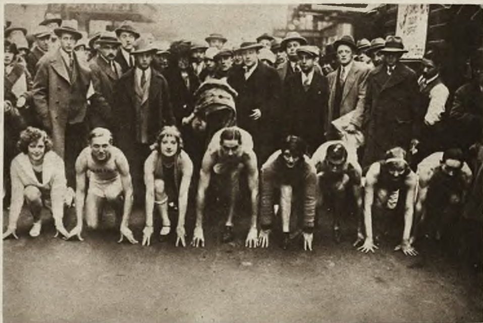
W Nowym Jorku odbył się wyścig na cel dobroczynny, w którym wzięli udział artyści i artystki teatrów. W wyścigu tym, niewiadomo z jakich powodów, zwyciężyły panie.