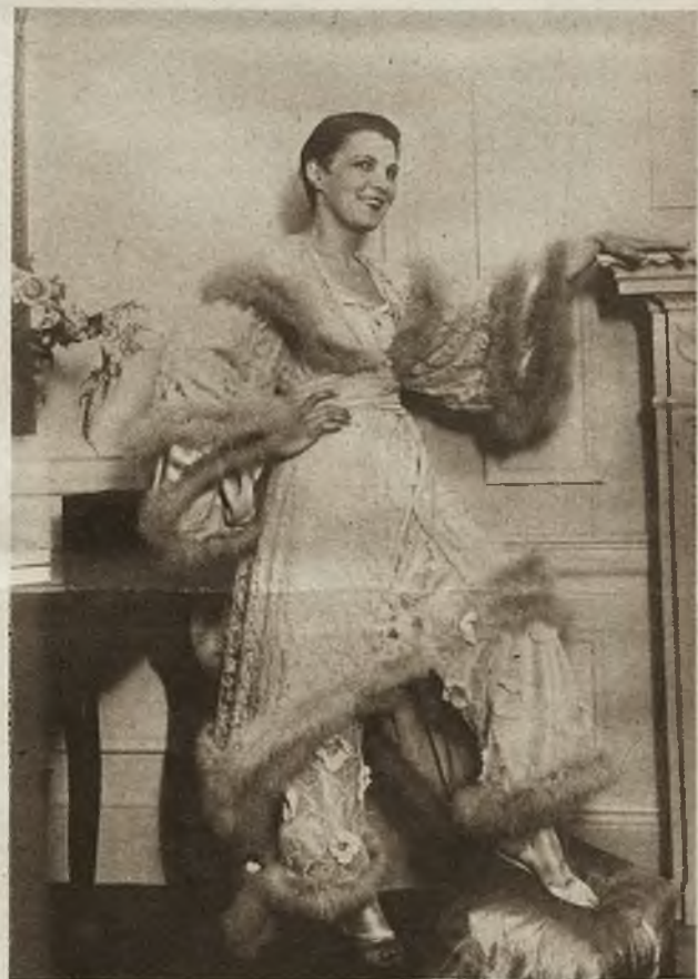
Moda à la szejik Hussein. Elegantki paryskie w poszukiwaniu nowych strojów, zaszły już do szczepów arabskich północnej Afryki. Stamtąd niedaleko już do stroju murzynów środkowo-afrykańskich.