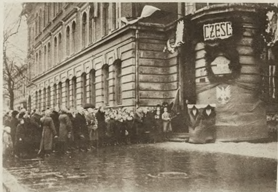
Szkołę Konarskiego, która w walkach listopadowych 1918 r. mieściła jedną z placówek polskich, udekorowano ub. niedzielę w siódmą rocznicę wyzwolenia Lwowa „Krzyżem Obrony Lwowa”.