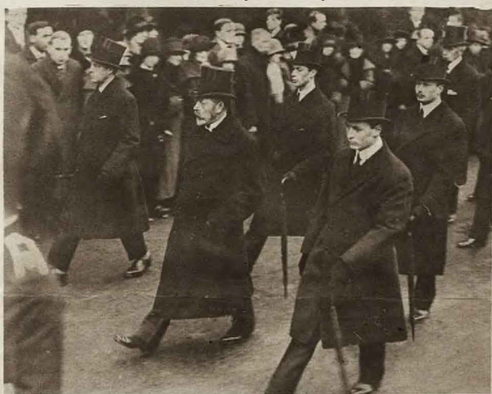
Angielska rodzina królewska w kondukcje żałobnej królowej Aleksandry. Od lewej: ks. Walji, król Jerzy, najmłodszy syn, ks. Jorku, ks. Olaf, norweski następca tronu