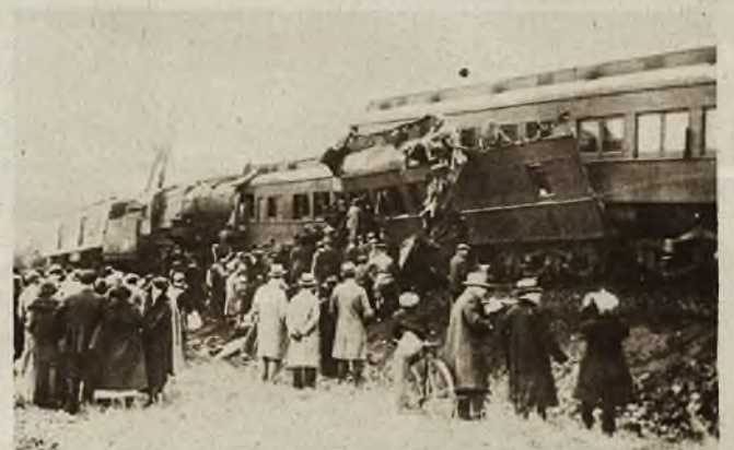
Wagony kolejowe zgniecione w katastrofie kolejowej koło St. Louis (St. Zjedn.).