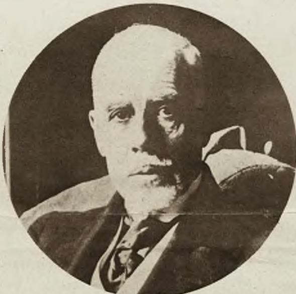
Mannel Teixeira Gomez, prezydent republiki portugalskiej, ma podobno ustąpić, jakkolwiek wybór jego ważny jest do r. 1927.