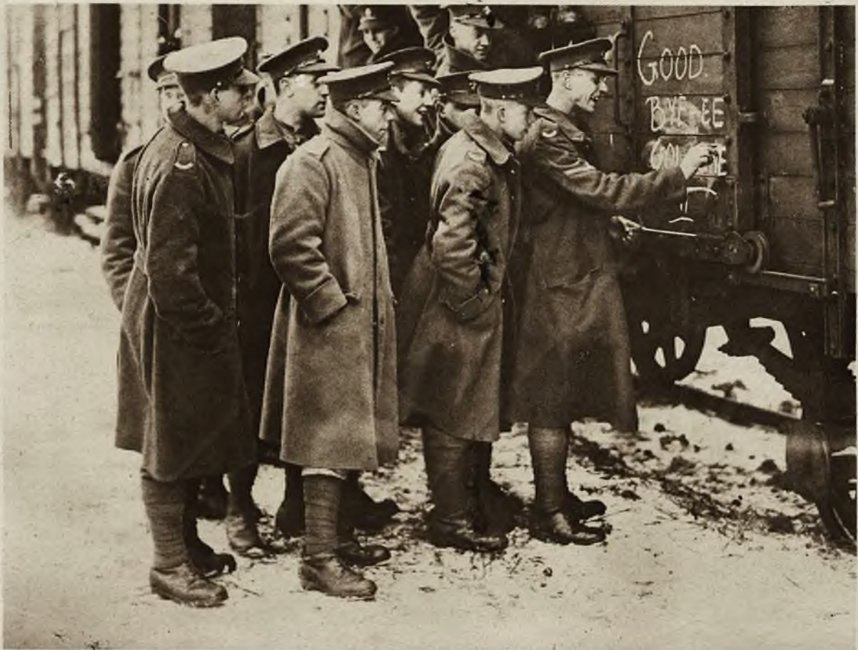
Armja angielska, na skutek paktu w Locarno, zaczyna ewakuować, okupowaną od 7-miu lat Kolonię i sferę nadreńską. Na zdjęciu naszym widzimy żołnierzy angielskich piszących na pociągu pożegnania pożełnalne.