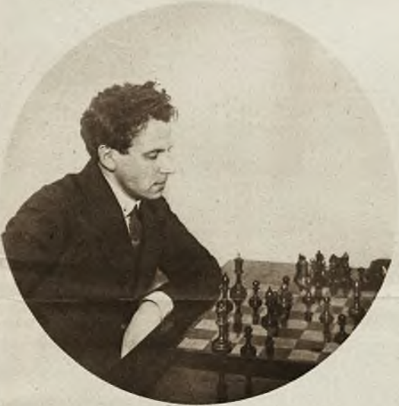
Rosjanin Al. Genewskij pokonał na turnieju szachowym w Moskwie, dotychczasowego mistrza świata Capablancę.