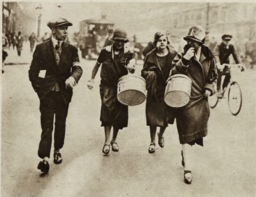
Oryginalny wyścig paryskich midinetek, odbył się w dniu św. Katarzyny po ulicach Paryża. Trzy „szampionki”, pod kontrolą sędziego, naciągają nóżki w celu zdobycia nagrody.