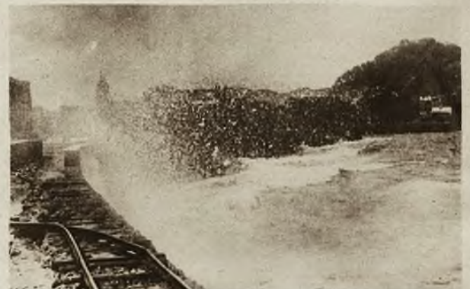
Orkan na wybrzeżu biskajskim. Nietylko tam jest przerwana ale nawet szyny kolejowe wygięta straszna siła wiatru.