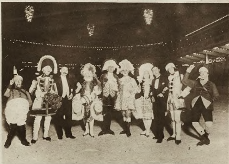
Przy otwarciu pałacu sportowego w Berlinie, odbył się na sztucznym torze łyżwiarskim, oryginalny balet na łyżwach. Na zdjęciu widzimy grupę baletową, wraz z dyrygentem i baletmistrzem.