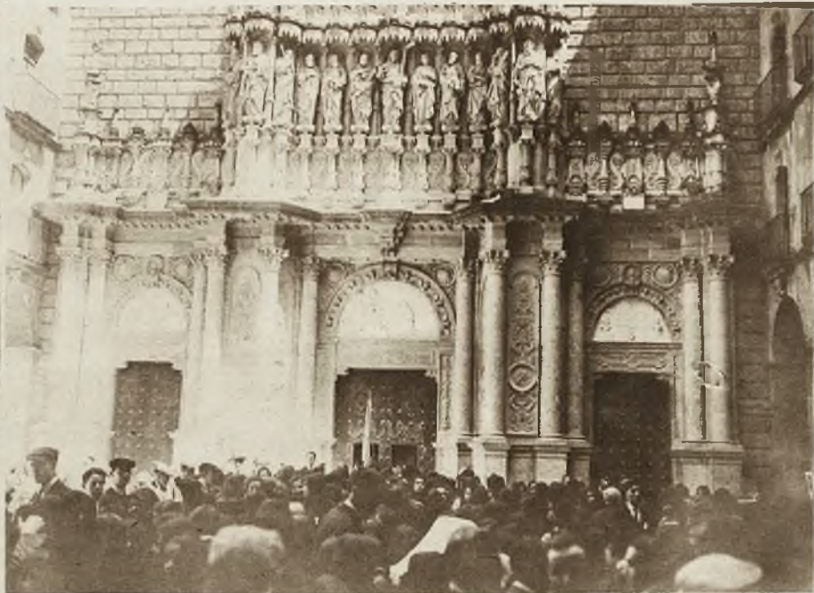
Klasztor Montserrat w Pirenejach hiszpańskich jest jedną z najstojniejszych miejscowości pielgrzymowych w Hiszpanji. W klasztorze znajduje się cudowny obraz „Czarnej Madonny z Dzieciątkiem”, do której z szczególnem nabożeństwem zwracają się kobiety i młodzież. Na lewo widzimy drogę do klasztoru, wykuta w skale. Na prawo główny portal, arcydzieło z czasów baroka.