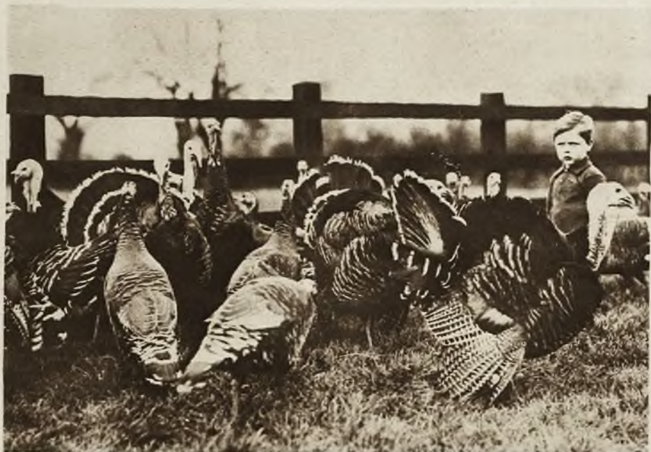
„Ave Caesar Imperator — morituri te salutant”, — oto krzyk jaki wrywa się (bez mała) z rozbulgotanych gardzieli dobrze odchowanych indyków, dla których zbliżające się święta, oznaczają kres — ku zadowoleniu smakoszy, obchodzących na swój sposób święta.