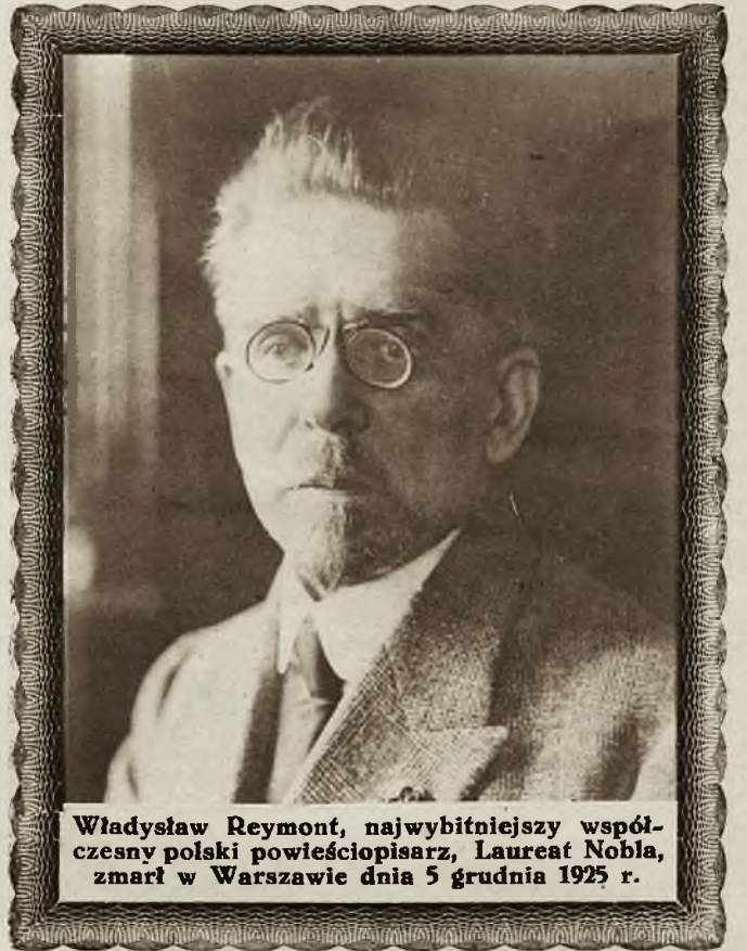
Władysław Reymont, najwybitniejszy współczesny polski powieściopisarz, Laureat Nobla, zmarł w Warszawie dnia 5 grudnia 1925 r.