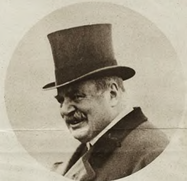
Lord Derby, członek ang. partji konser., wycofuje się z życia politycznego. Nazwisko jego jest bardziej znane z słynnych wyścigów konnych, zainicjowanych przez jego dziada, niż z działalności politycznej.