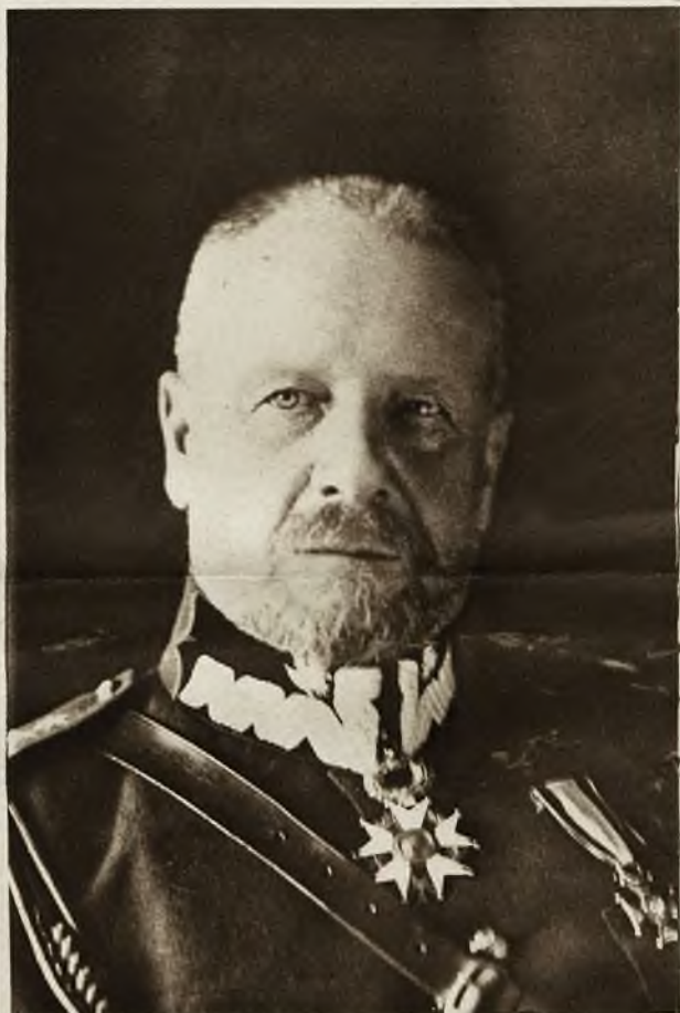
1) Całkiem niespodzianie ustąpił hiszpański dyrektorjat. Na zdjęciu widzimy króla Alfonsa, na lewo za nim gen. Primo de Rivera, który tworzy gabinet cywilny. — 2) Słynna katedra w Rheims, zniszczona podczas wojny, jest już prawie zupełnie odbudowana. — 3) Nowy minister wojny gen. Żeligowski.