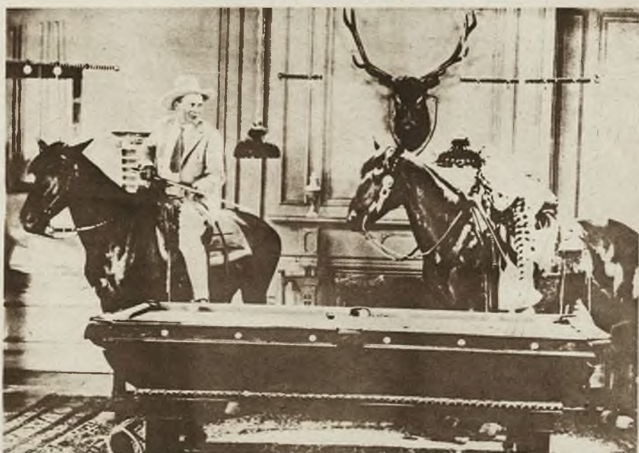
Pomysły ekscentryczne za oceanem mogą pochwalić się nowością nie ustępującą dawniejszym. Na specjalnie tresowanych koniach, umiejących stać bez drgnienia na ślizkiej posadzce kawiarni, cowboje amerykańscy, rozgrywają trudną partję amerykańskiego bilardu.