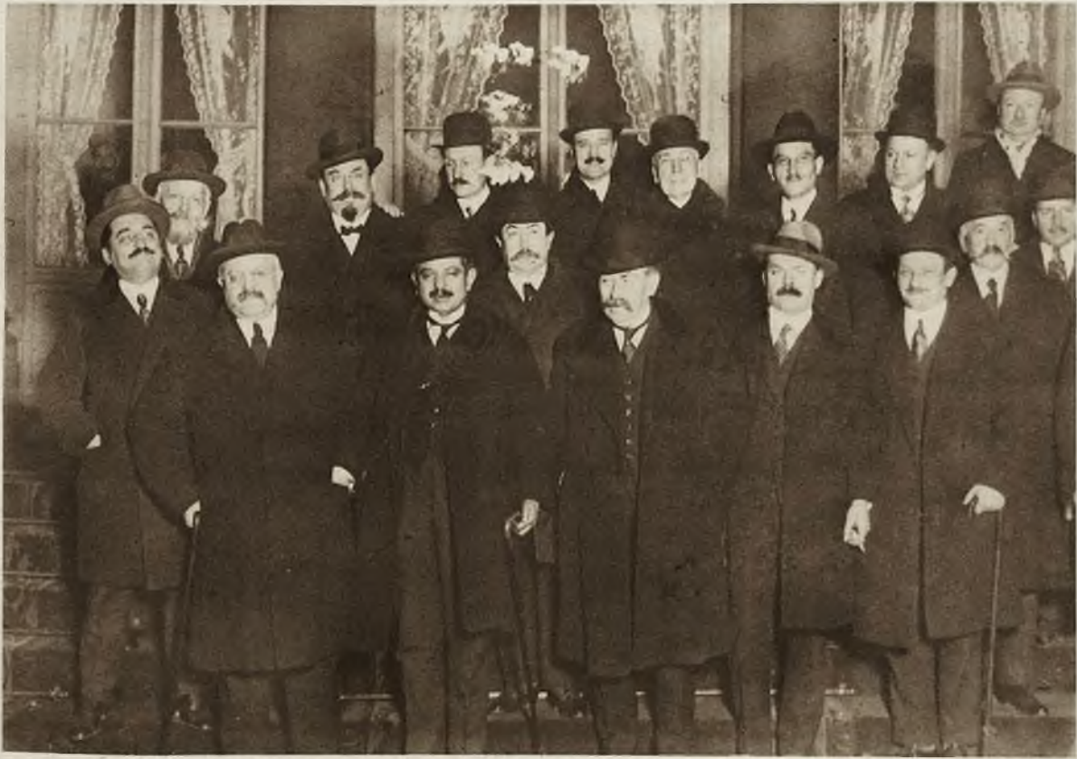
Nowy gabinet francuski. W środku prezydent ministrów Briand (X).