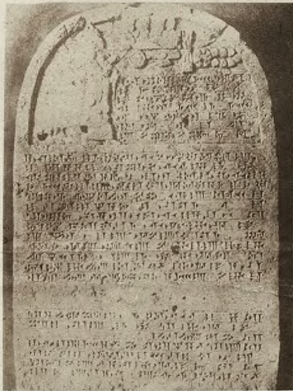
W nowym muzeum konstantynopolińskim złożono niedawno wykopaną tablicę kamienną, pochodzącą z siódmego wieku przed N. Chr. Jest to oryginalne rozporządzenie policyjne, określające szerokość ulicy i grożące właścicielom domów wielkimi karami, gdyby zapragnęli zagarnąć dla siebie część ulicy.