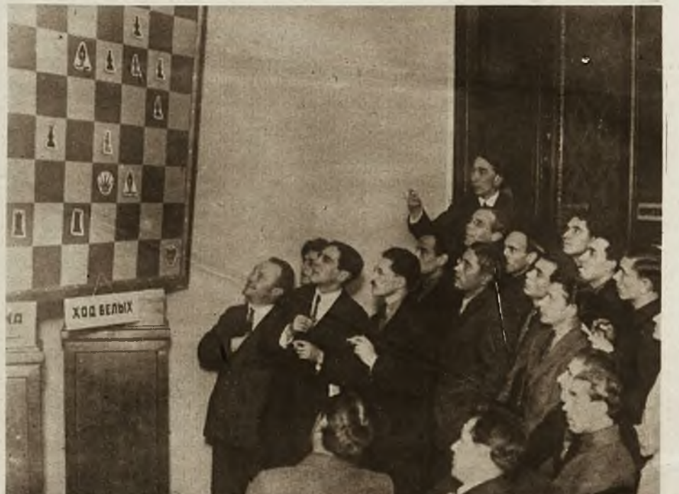
Podczas światowego turnieju szachowego w Moskwie, w klubach tamtejszych wystawione były wielkie tablice szachowe, na których entuzjaści tej sztuki mogli od razu obserwować przebiegi gry mistrzów.