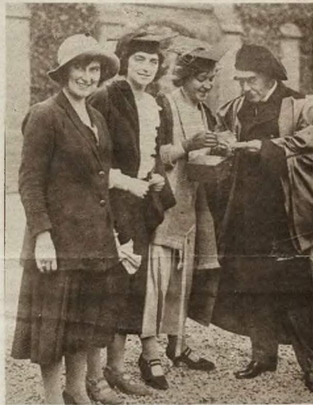
Wielki poeta i pisarz angielski Rudyard Kipling, twórca słynnych poematów dżungli, ciężko zachorował. Na zdjęciu widzimy sławnego autora w stroju rektora uniwersytetu św. Andrzeja, jak rozdziela swe autografy oblegającym go słuchaczkom.