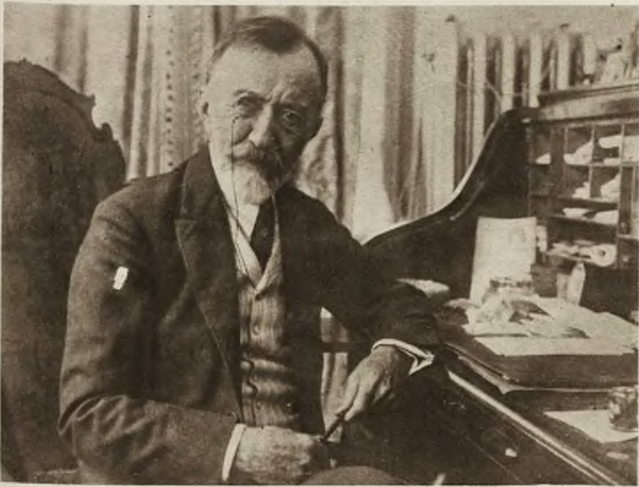
Narodowy poeta turecki, Abdul Hap Hamid był niedawno entuzjastycznie przyjęty w Angorze, gdzie dla powitania go wyruszyły olbrzymie tłumy z Mustafą Kemalem paszą na czele. Zdjęcie przedstawia największego poetę tureckiego w jego mieszkaniu w Konstantynopolu.