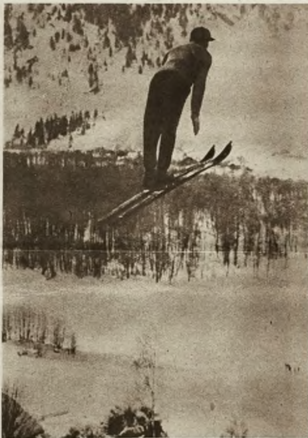
Wczesna zima pozwoliła już na uprawianie sportów zimowych. Zdjęcie nasze przedstawia najlepszego narciarza świata Norwega Thorleifa Hauga w efektownym 50 m. skoku.