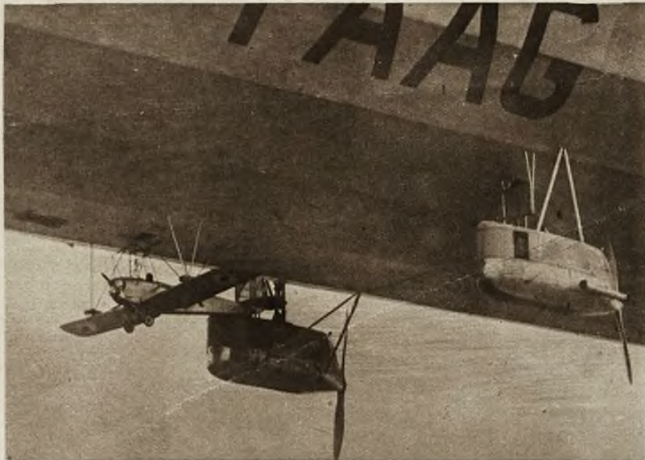
Na podobieństwo okrętów, dźwigających łódzie ratunkowe, wielkie sterowce powietrzne wyposażone są w pomocnicze aeroplany. Zawieszane u spodu balonu, mogą go podczas lotu opuścić, przenieść pocztę lub pasażerów i ewentualnie wyratować załogę w razie nieszczęścia.