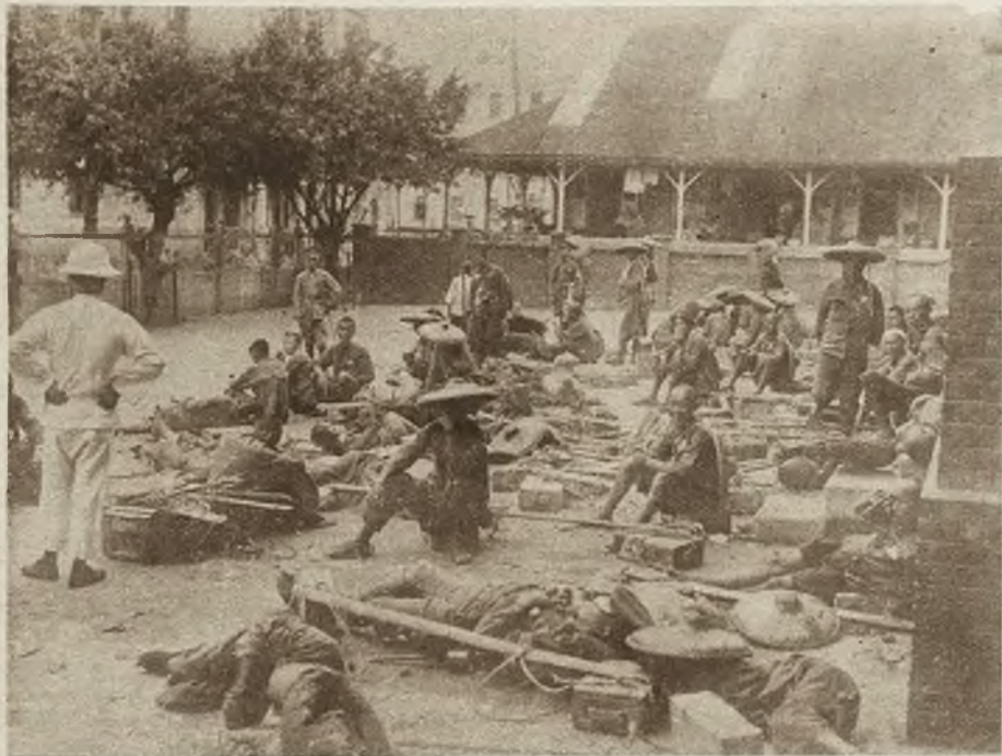
Zółtolicy obywatele niebieskiego państwa zaczynają powoli czerwień. Te kameleonowe przemiany w starodawnych Chinach oznaczają wzrastające wpływy sowieców, którym w najsilniejszym stopniu ulega armja. Na zdjęciu widzimy kolumnę czerwonych kulisów podczas odpoczynku.