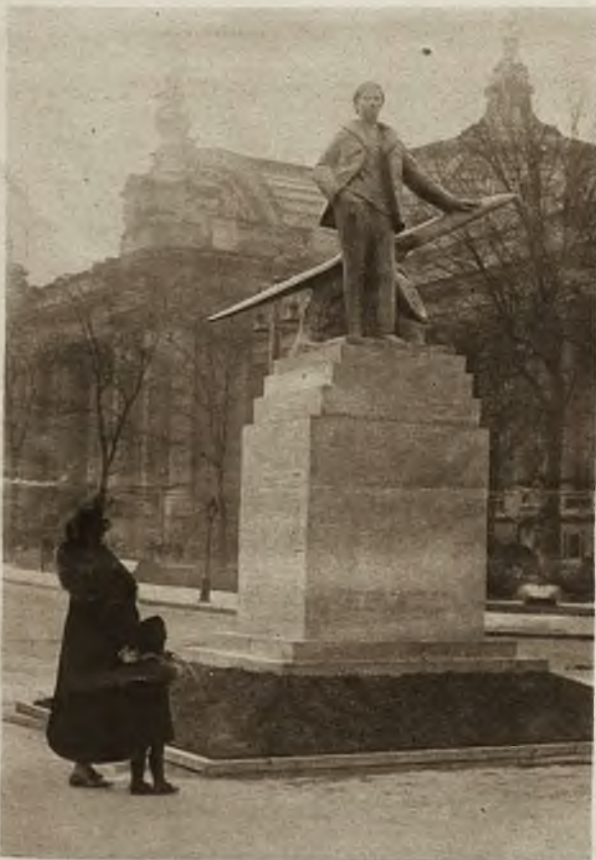
W Paryżu na polach Elizejskich odsłonięto pomnik bohatera francuskiego i światowego lotnictwa Rolanda Garos'a, który należał do pierwszych i najświetniejszych pionierów lotu na maszynach cięższych od powietrza.