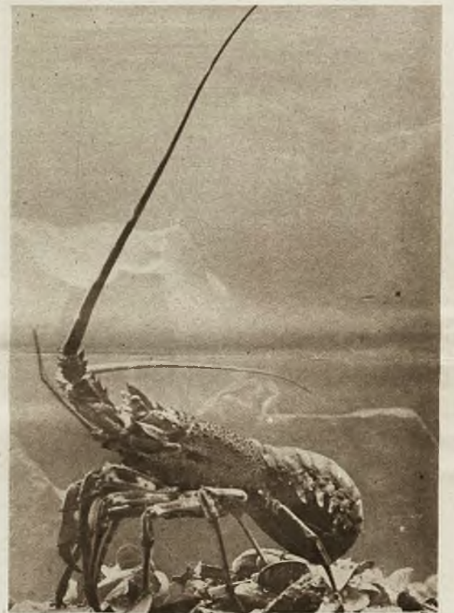
Ciekawy okaz raka albo też ciernistego homara, który od zwykłych różni się kolorem oraz brakiem szczypców. Żyje w zachodnich wodach kanału La Manche.