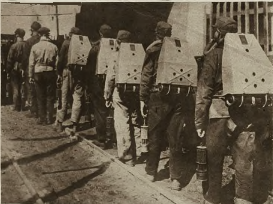
Pogotowie ratunkowe zaopatrzone w najnowsze środki, zabezpieczające od ognia, gazu i eksplozji, udaje się na miejsce wypadku po wielkiej katastrofie w kopalni węgla w Szkocji