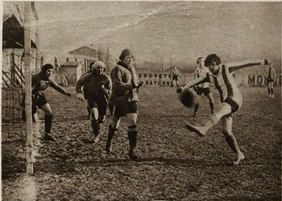
Piłka nożna, której triumfalny pochód dotarł do najodleglejszych zakątków naszej ziemi, od wielu lat już uprawiana jest także przez kobiety i to przede wszystkim we Francji. Na zdjęciu widzimy zamaszystą scenę ze spotkania Parisianów przeciw Hironnelles.