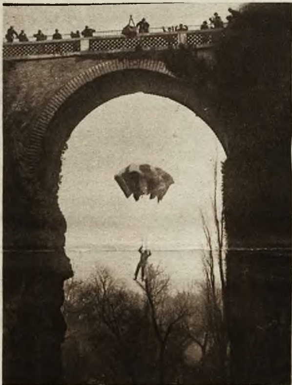
Niezwykle śmiały skok ze spadochronem wykonał nie dawno jeden z lotników francuskich. Z mostu zaledwie 27 metrów wysokiego, rzucił się on w przepaść, ryzykując, że spadochron na tak nieznacznej przestrzeni nie otworzy się należycie. Wysokie drzewa i skały utrudniły jeszcze więcej zadanie.