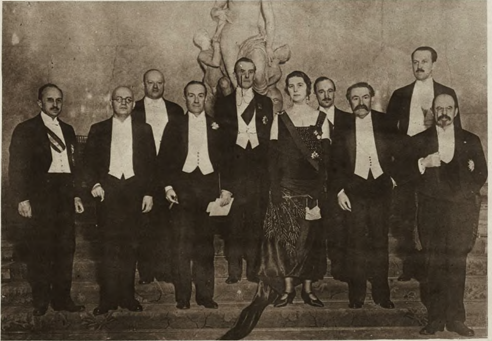
Sir Austen Chamberlain, angielski minister spraw zagranicznych, wydał w posiadłości swojej w Lancaster przyjęcie dla przedstawicieli mocarstw europejskich, którzy brali udział w konferencji w Londynie i w podpisaniu traktatu locarneńskiego. — Na zdjęciu stoją od lewej: hr. Scialoja, dr. Luther, Stresemann, Baldwin, sir Austen i lady Chamberlain, dr. Beneš, Briand, hr. Skrzyński, Vandervelde.