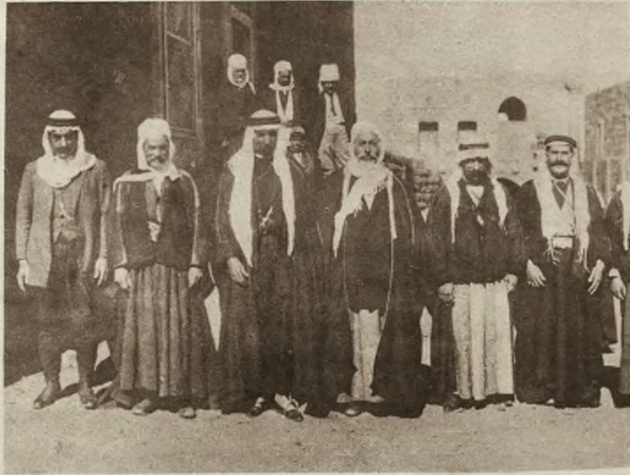
Kilku tych ludzi sprawia Francji nie mało kłopotów. Są to bowiem syryjscy szejki, którzy podnieśli sfanatyzowane tłumy do walki państwowej. Drugi na zdjęciu (od lewej) to sułtan pasza Atrach, wódz rewolty i bohater narodowy Druzów.