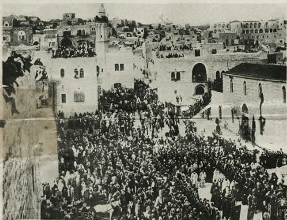
Boże Narodzenie w Betleem. Ze wszystkich stron świata ciągną tłumy pielgrzymów do Betleem, by w dzień Bożego Narodzenia wziąć udział w uroczystym nabożeństwie. Wszystkie wyznania chrześcijańskie otaczają czią miejsce narodzenia Dzieciątka.