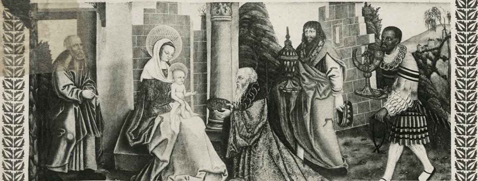
Hold trzech Króli. Obraz pochodzący prawdopodobnie z pierwszych dziesiątków szesnastego wieku, jest własnością bogatego w zabytki kościoła w Szamotulach i przedstawia jedno z najbardziej ciekawych zjawisk malarskich naszego renesansu. Autor obrazu nieznany. Przed Matką Boską kłęczy siwy Król z misą dukatów, za nim drugi z puszką i murzyn z rogiem obfitości. Z drzwi wychodzi św. Józef.