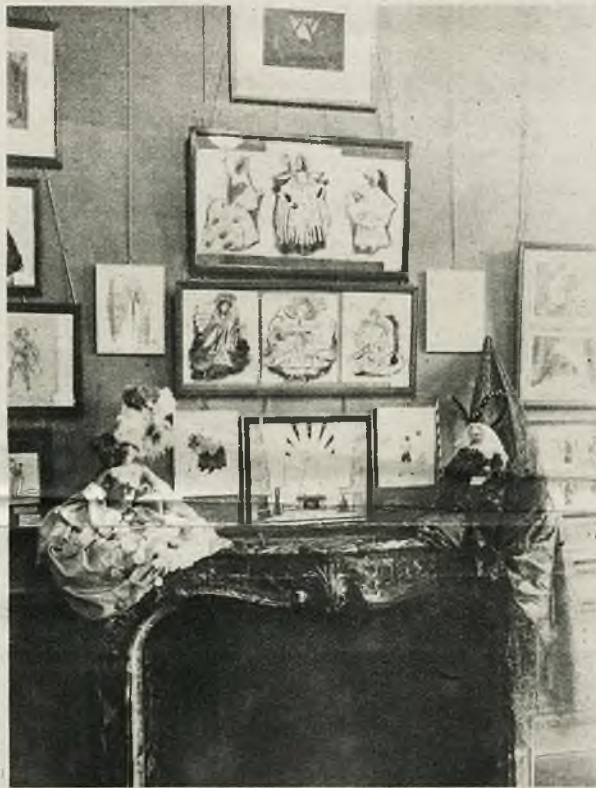
Na międzynarodowej wystawie introspektywistów w Paryżu, wzięła udział także Polska. Na zdjęciu widzimy eksponaty sekcji polskiej, pozostającej pod protektoratem ambasady polskiej w Paryżu.