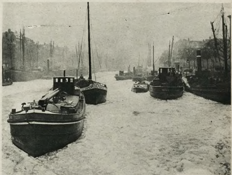
Wczesna zima w Holandji zatrzymała cały szereg statków w podróży po kanałach. Skutek lodem, oczekiwać będą one długi czas na spękanie pancerza lodowego. Na statkach pozostaje załoga, która musi wyrębywać lód wokół okrętów, narażonych ustawicznie na zgniecenie lodami.