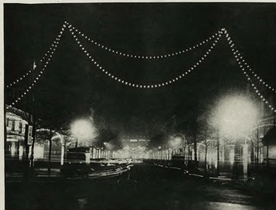
Ciekawe zdjęcie nocne z przedświątecznego ruchu ulicznego w Paryżu. Bogate iluminacje ściągają przechodniów i zalewają tonące w mroku ulice potokami blasków. Smugi na zdjęciu są śladami przejeżdżających, jasno oświetlonych samochodów.