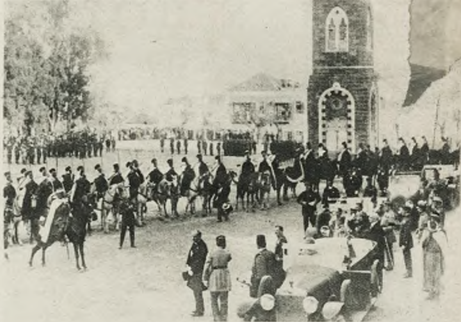
Nowy francuski komisarz rządowy dla Syrii, de Jouvenal, obejmuje władzę w tym zrewoltowanym kraju. Ilustracja przedstawia nam wjazd komisarza wraz ze świtą do Beyrutu.