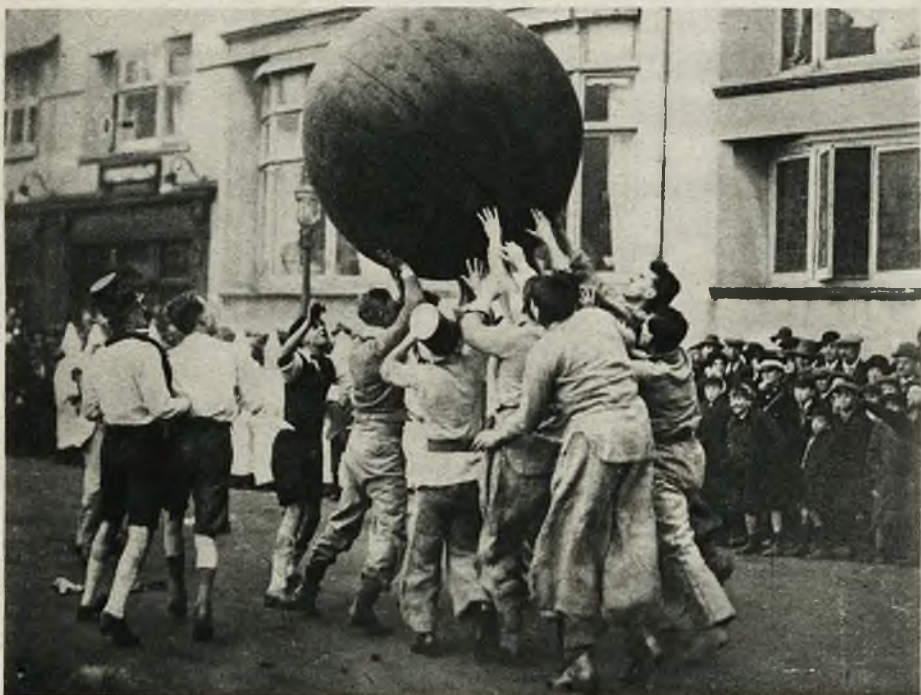
Gra w „piłkę olbrzymią” (push-ball) jest niezwykle popularną na dalekim zachodzie i na drugiej półkuli. Ponieważ gra ta zwraca na siebie niezwykłą uwagę, przeto wykorzystują ją studenci angielscy, którzy w karykaturalnych strojach Ku-Klux-Klanu rozgrywają partje tej gry po ulicach miast i przy tej sposobności zbierają składki na szpitale dla dzieci.