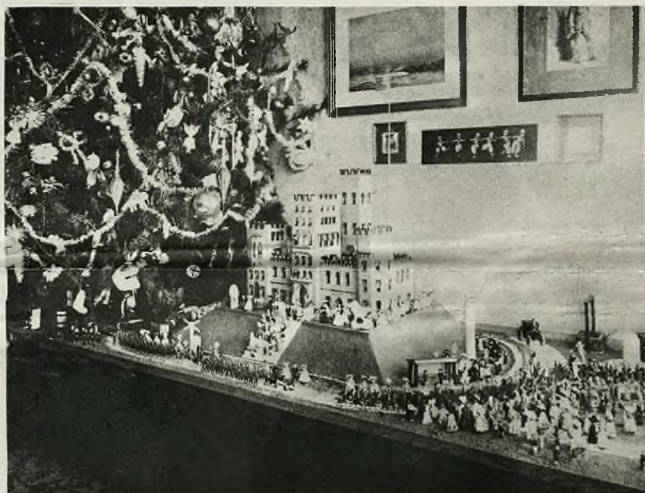
U stóp drzewka leżą, jak starodawny nakazuje obyczaj, liczne podarki, które przynosi tradycyjna gwiazdka. Na zdjęciu są te podarki liczne i bogate, tak też i my życzymy naszym, zwłaszcza młodocianym czytelnikom, by dla nich była gwiazdka nie mniej łaskawą.