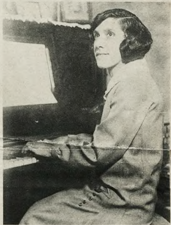
Bohaterka słynnego procesu Rhinelandera, przeciwko której wystąpił mąż z żądaniem rozvodu z powodu murzyńskiego jej pochodzenia. Ponieważ wyrok sądu brzmiał dla męża nieprzychylnie, przeżył w całej Ameryce zawrzał od protestów i walka białych z czarnymi rozgorzała na nowo.