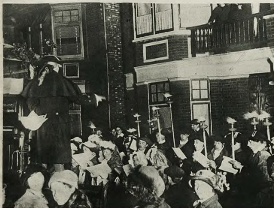
W Anglii istnieje zwyczaj, że w dzień Bożego Narodzenia jeździ po ulicach miasta wóz ze staroświeckim fortepianem, obok którego stojący dyrygent kieruje śpiewami chórów, przybranych w tradycyjne stroje. Liczne rzesze przechodniów przyłączają się do pochodu i w miarę umiejętności śpiewają na chwałę Panu.