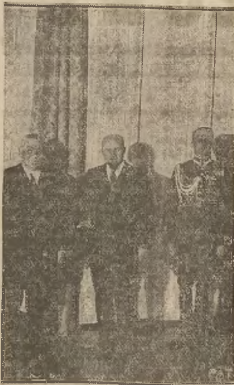
Nowy ambasador turecki w Warszawie, minister Dżewad Bey, złożył onegdaj w południe wizytę p. prezesowi Rady Ministrów Aleksandrowi Prystorowi. — Na ilustracji naszej stoją od strony lewej: ambasador Dżewad Bey, p. premier Prystor i sekretarz p. premiera porucznik Szczeniowski.