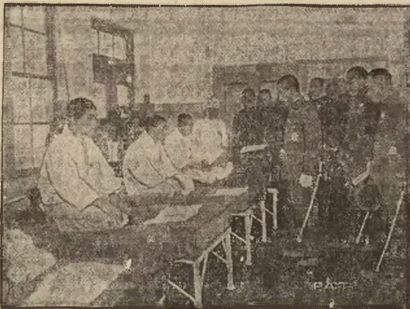
Ranni żołnierze japońscy, ofiary walk pod Szanghajem, umieszczeni w szpitalu gar-

nizowanym w Tokio w czasie odwiedzin ministra wojny gen. Araki.