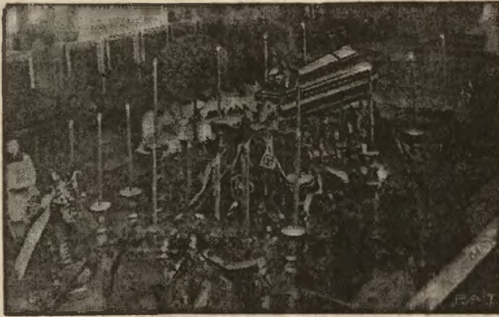
Katafalk w Bazylice wileńskiej, na którym spoczywa trumna ze zwłokami zmarłego kapłana.