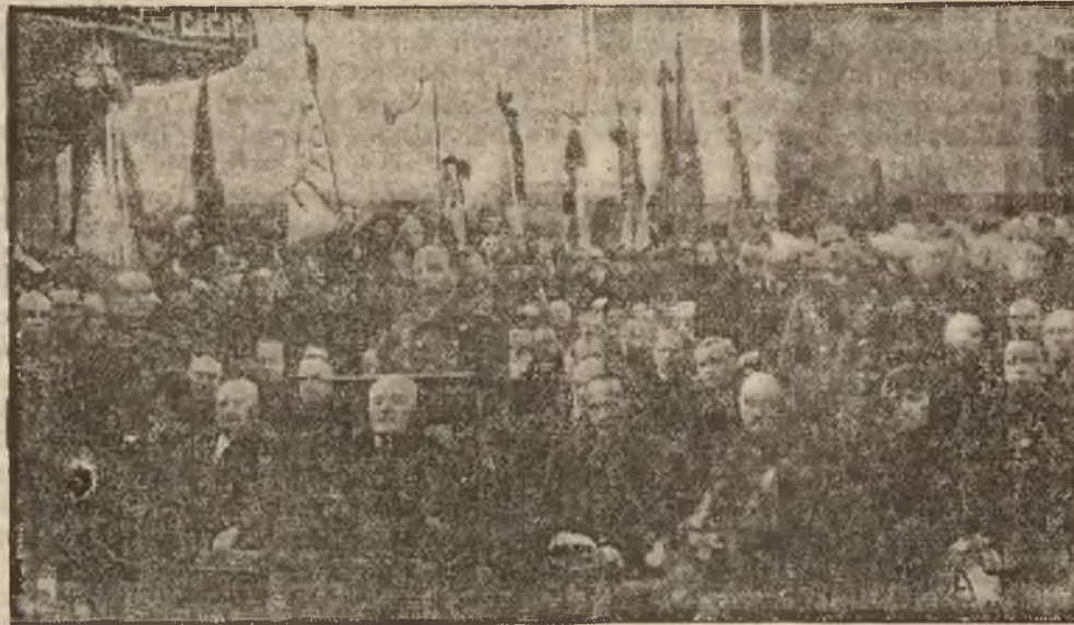
Fragment nabożeństwa żałobnego w Bazylice wileńskiej. W pierwszym rzędzie obok p. Prezydenta R. P. siedzą: ze strony lewej p. prezes Rady Ministrów Al.

Prystor, od strony prawej: marszałek sejmu p. K. Switalski, nieco w tyle za p. Prezydentem, p. minister Skarbu Jan Piłsudski.