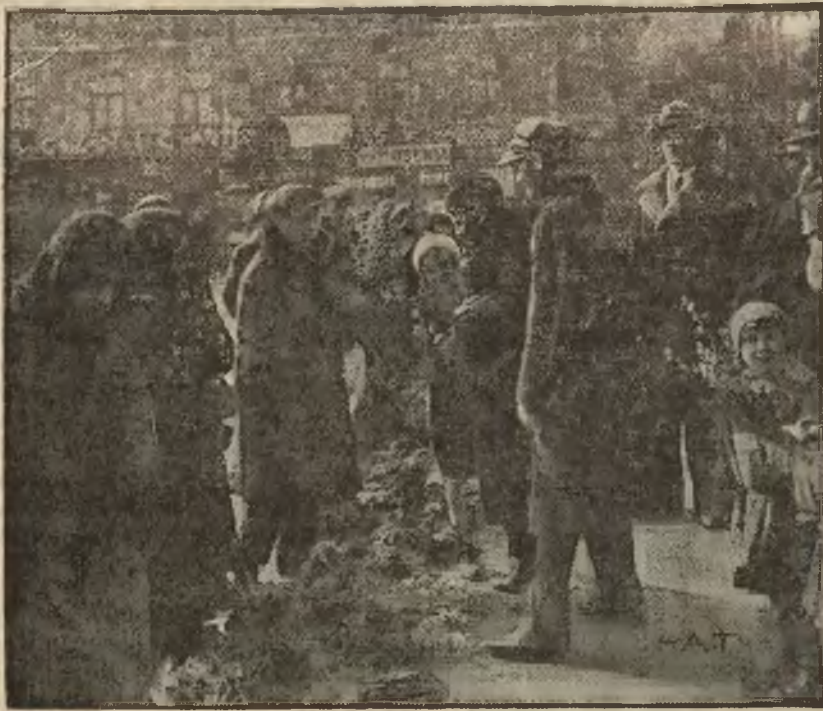
Grupa przekupek, sprzedających w ub. Niedzielę Palmową palmy przed kościo-

łem Św. Aleksandra na pl. Trzech Krzyży.