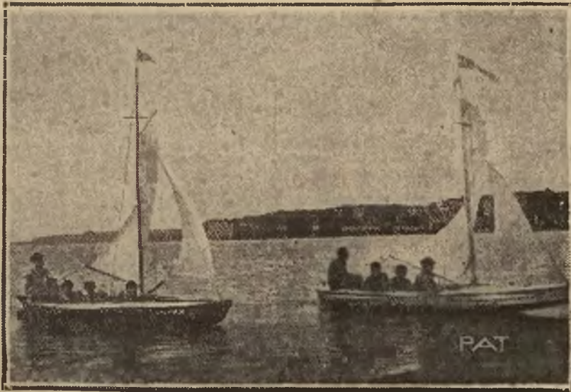
Rozpoczął się już sezon wiosenny wodnych wycieczek po Wiśle. Zdjęcie przedstawia harcerską drużynę „Kajakowców“

z Chelmu, na pierwszej w tym roku wycieczce.