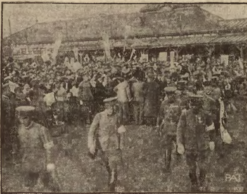
Zdjęcie przedstawia powrót do Tokio Szanghajem i radosne powitanie ich przez pułków japońskich, które walczyły pod ludność.