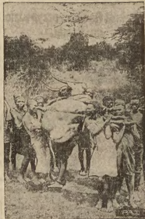
Na zdjęciu widzimy grupę myśliwych murzyńskich obszaru Guasco Nyira w Afryce wschodniej z upolowaną wielką antylopa.