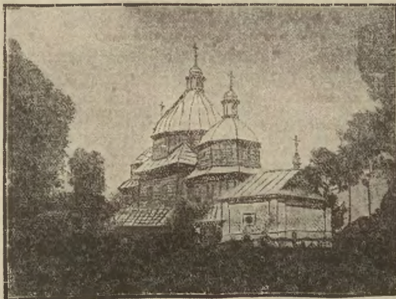
Na zdjęciu widzimy cerkiew Św. Trójcy w Żółkwi, zbudowaną w r. 1601 z drzewa modrzewiowego.