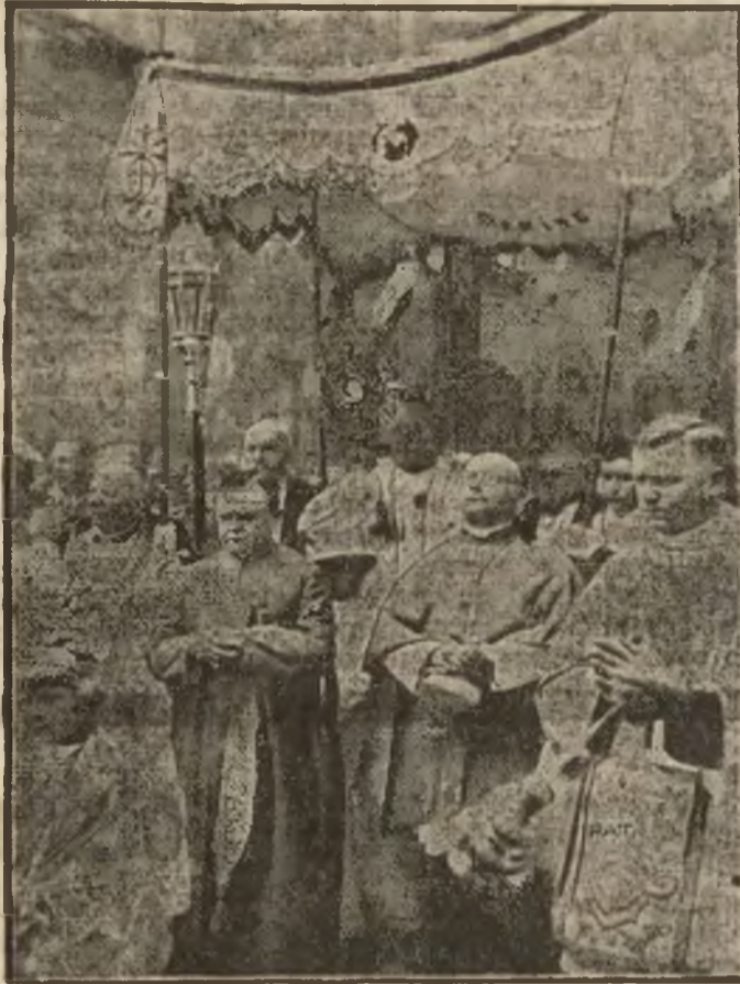
Pan Prezydent R. P. i P. Premier Prystor na procesji Bożego Ciała w Warszawie. Procesję prowadził Ks. Kardynał Ka-

kowski, podtrzymywany przez P. Prezydenta oraz P. Premiera Prystora.