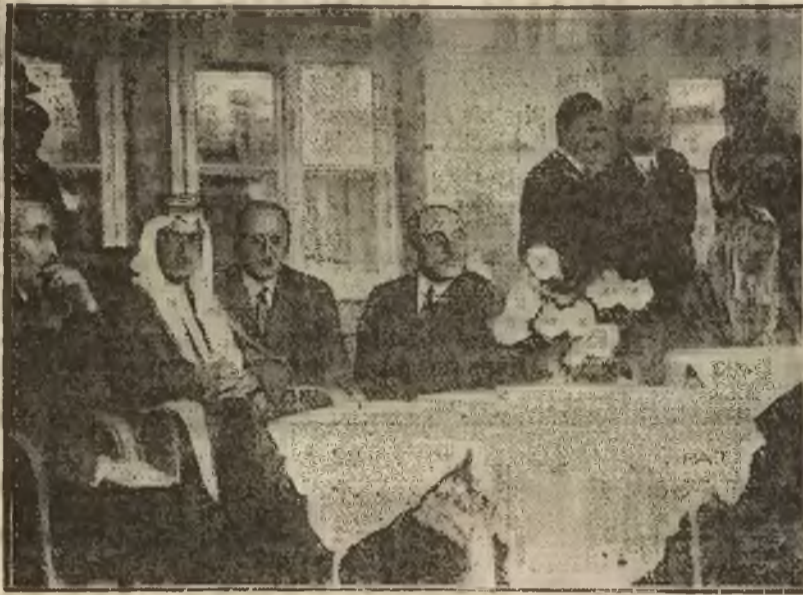
W czasie zawodów o mistrzostwo tenisowe Warszawy zjawił się na kortach W. L. T. K. wicekról Hedżasu emir Faisal