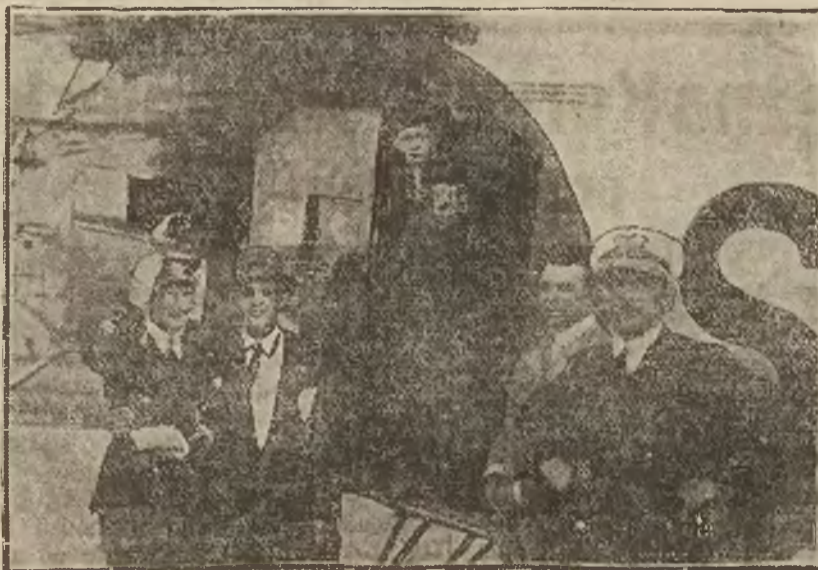
Rumuński następca tronu ks. Michał przybył przed kilku dniami na lotnisko w Bukareszcie celem obejrzenia samolotu

polskich linii lotniczych „Lot“. — Na ilustracji widzimy następcę tronu w drzwiach samolotu.