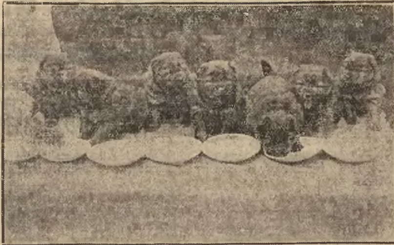
Na zdjęciu naszym widzimy grupę piesków rasy Chow, znajdującą się na wystawie w Londynie.