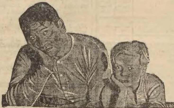
Widzowie „Tommy Boy“ oraz siedmioletni Jackie Cooper zachwycają świat w filmie „Czemp“ reżyserii Kinga Vidora.

Lecz co najbardziej zdumiewa w tej świeżej, niusującej epopei prawdziwego życia — to brak „roboty“ reżyserskiej, brak tej całej sztuczności, jak nam zazwyczaj dają skądinąd doskonałi reżyserowie. Człowiek na widowni zapomina na tym filmie zupełnie, że znajduje się w kinie; wrażeniowo jest poprostu przekonany, że znajduje się wraz z współgrającymi aktorami w fantastycznej krainie słońca; wraz z tabunami dzikich koni, oszałały ze strachu ucieka przed oslepiającym blaskiem błyskawic, bierze gorący i czynny udział w każdym najmniejszym wydarzeniu, rozgrywającym się na ekranie. A gdy przychodzi wreszcie finał filmu, ten żywiołowy wyścig, dla którego światowa prasa nie może znaleźć odpowiednich superlatywów — widz jest poprostu oszołomiony i wstrząśnięty do głębi. Bo „Tommy Boy“ „bierze“ mocniej, niż wszelkie dramaty, miłosne razem wzięte, a jego urok pozostaje przez długi czas jeszcze w duszy wzruszonego i wdzięcznego widza. W. Z.