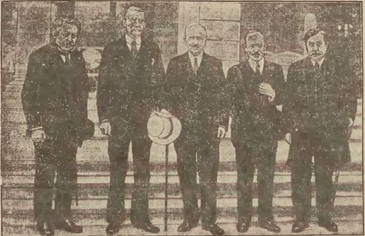
Od lewej ku prawej: Brland (Francja), Chamberlain (Anglja), Sciolaja (Włochy), Benesz (Czechy), Painlevé (Francja), członkowie Ligi narodów.

Skrzyńskiemu, aby mu się powiodło tak ułożyć stosunek nasz do Rosji, iżbyśmy mogli nasze towary fabryczne sprzedawać Rosji. Taby mogło bardzo wpłynąć na polepszenie naszych stosunków gospodarczych, a to jest najpilniejszą naszą potrzebą.