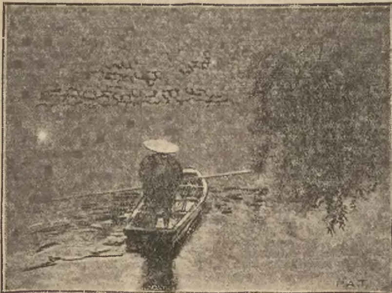
Wieżniacy i robotnicy japońscy nie wyzbyli się odwiecznego stroju, składającego się z płaszczka słomianego i kapelusza w kształcie grzyba.

Na zdjęciu naszym widzimy tak ubranego ogrodnika na kanale parku cesarskiego w Tokio.