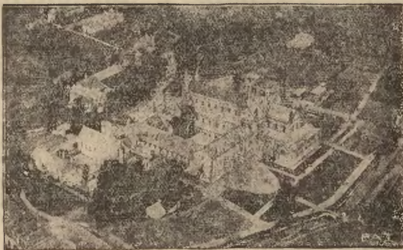
Obszerne zabudowania klasztoru w Buckfast (Anglia), które widzimy na naszej fotografii, zbudowane zostały pracą rąk 7 zakonników w ciągu lat 25. Odczynno to

powstało na miejscu dawnego zburzonego w XVI wieku za czasów reformacji. Poświęcenia nowo wzniesionej kaplicy dokonał kard. Bourne.