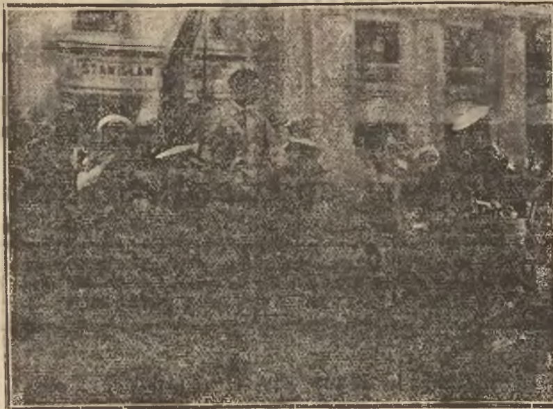
Z trudem udało się ocalić por. Żwirkę przed entuzjastami po przybyciu przed lokal Aeroklubu.